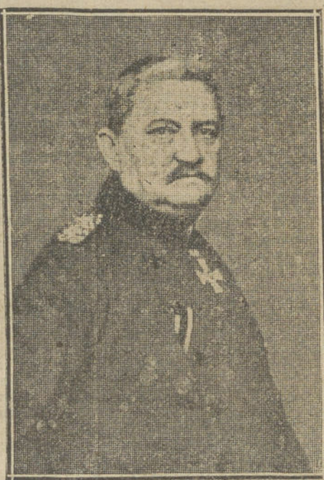
El general alemán ULRICO VON BÜLOW, hermano del Príncipe Bernardo, muerto en uno de los combates de Bélgica.