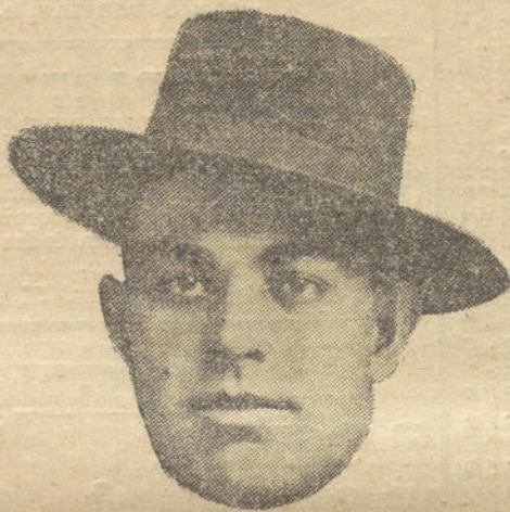
ALGABENO III, que toreará el próximo domingo en la Plaza de Vista Alegre.

Primera, Gobierno interior; segunda, Hacienda; tercera, Comunicaciones; cuarta, Policía urbana; quinta, Cultura é Instrucción pública; sexta, Asuntos judiciales.