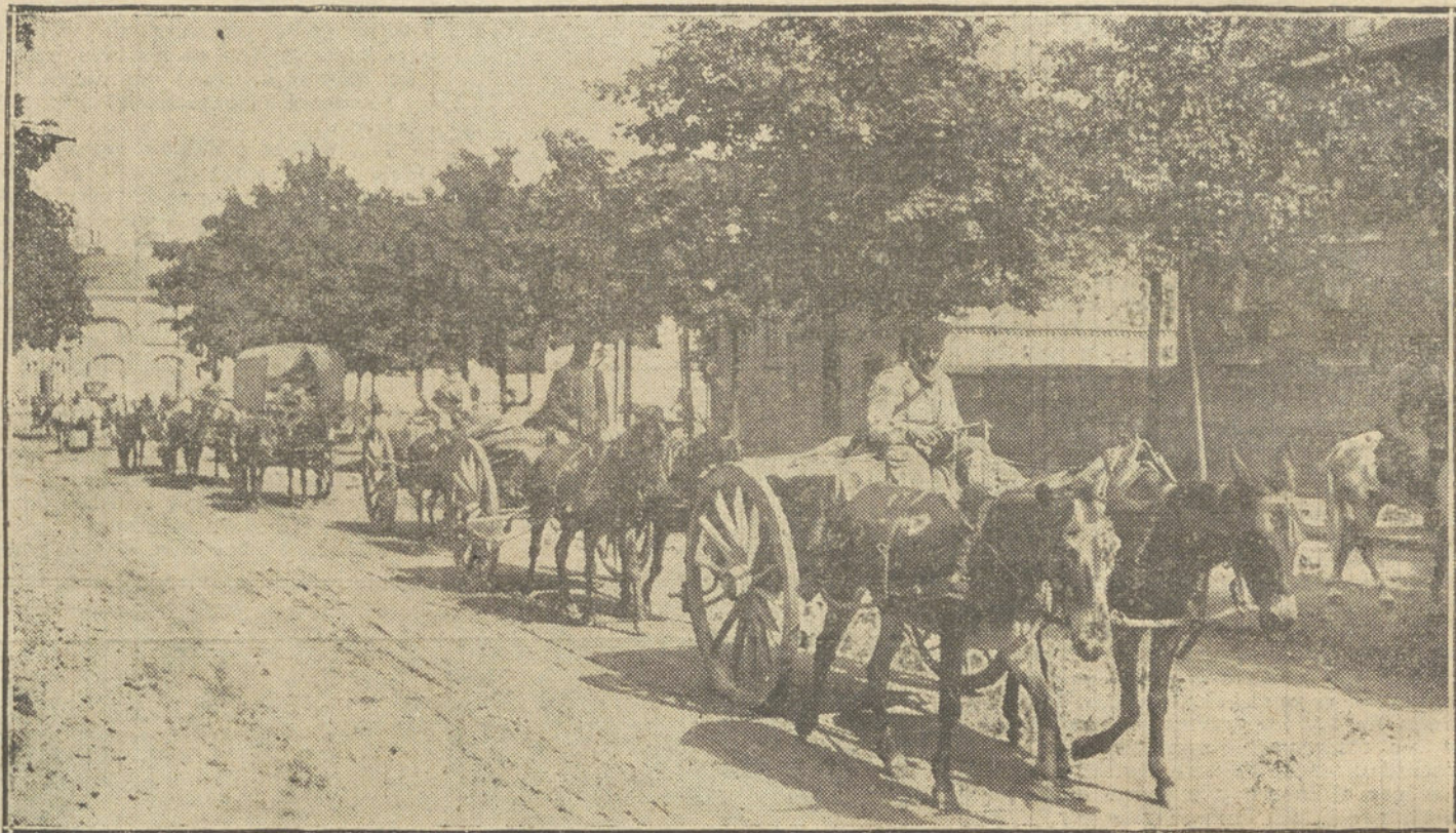
LA GUERRA EN FRANCIA.—Un convoy de aprovisionamiento, conducido por las tropas senegalesas, saliendo de Amiens, para la línea de fuego.

La tercera y última razón esencial es que el propio general French, coincidiendo con Joffre, anunciaba a su Gobierno que, por ahora, había calma, por estar