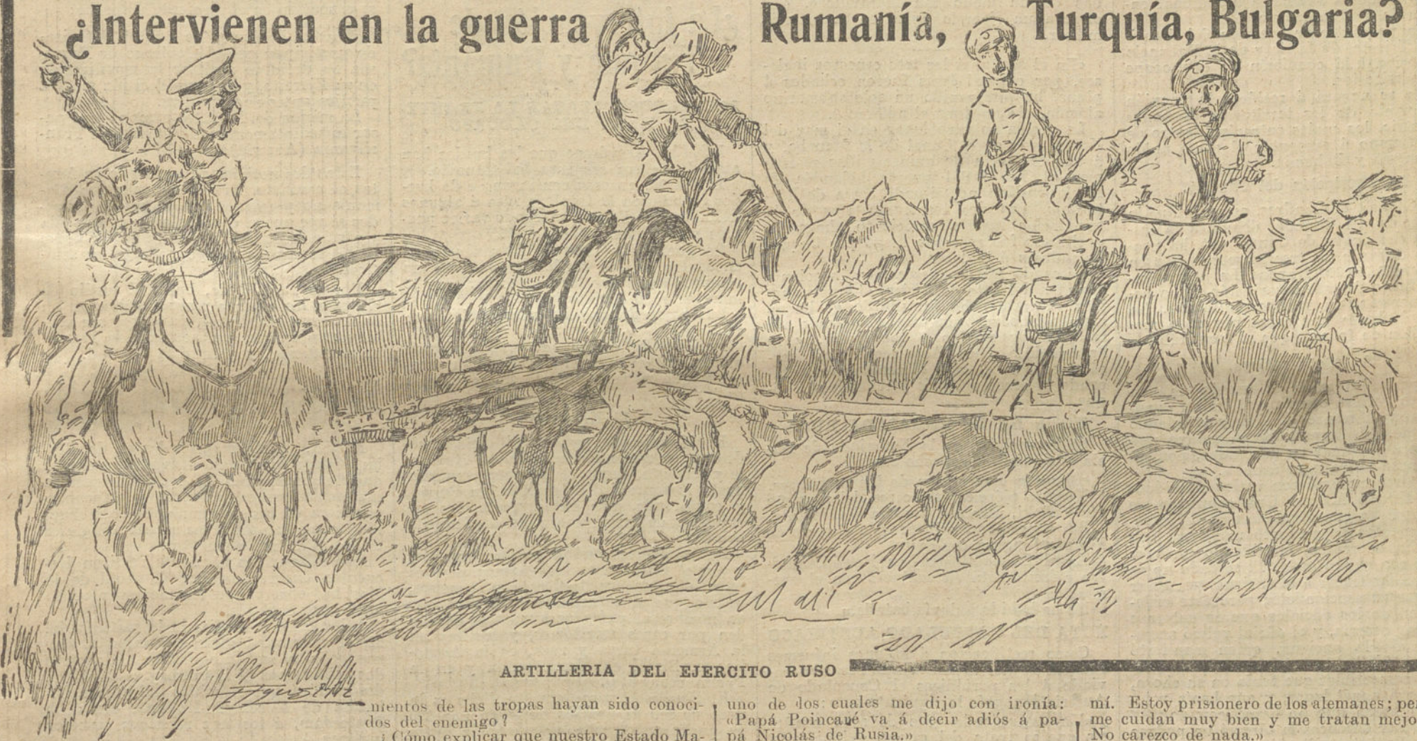
ARTILLERIA DEL EJERCITO RUSO

¿Intervienen en la guerra Rumanía, Turquía, Bulgaria?