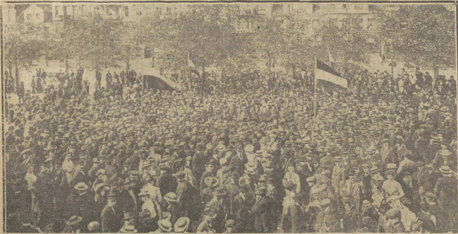
LA GUERRA EUROPEA.—Concierto da do por una música húngara en Hamburgo, a beneficio de las víctimas de la guerra.