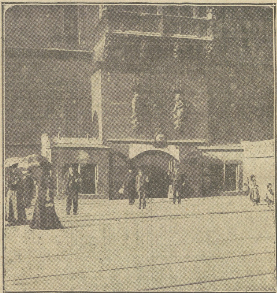
BRESLAU, ciudad alemana hacia donde se dirigen los rusos. Entrada al Schweitzerkeller.

Después el cuadro, a despecho de su marcialidad severa, adquirió un tinte pintoresco; momentáneamente el andén se convirtió en zoco. Los germanos, deseosos de procurarse algunos recursos, ofrecían cuanto llevaban encima a sus rivales. Por gestos procuraban expresarse: enseñaban una moneda de diez céntimos o de cinco, y con los dedos decían a cuántas de aquellas monedas ascendía el precio de la venta. Muchos, a falta de otros objetos, se arrancaban los botones de sus uniformes.