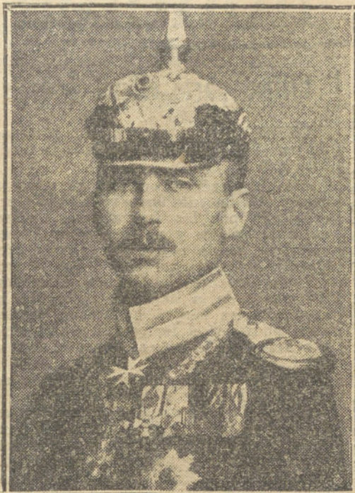
El Príncipe OSCAR DE PRUSIA, hijo del Emperador, que ha sido herido en uno de los combates del Aisne.