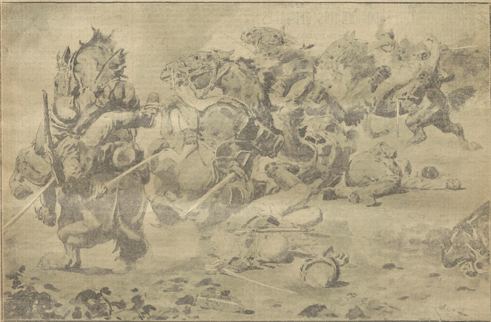
UNA CARGA DE CABALLERIA ALEMANA. (Composición de AGUSTIN)