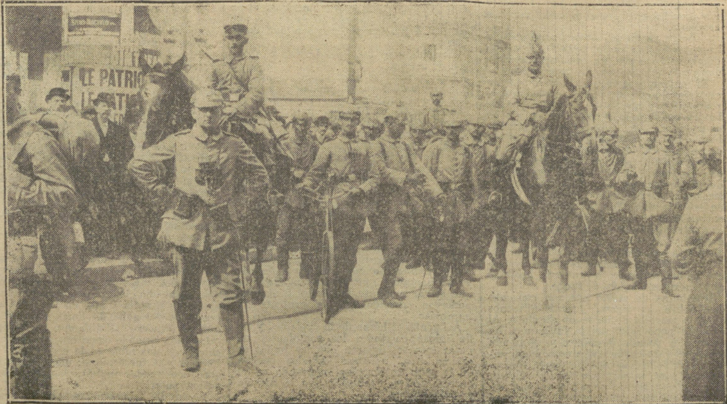
LA GUERRA DESDE BRUSELAS.—Las tropas alemanas en la plaza de la Bolsa, de Bruselas, disponiéndose para hacer una salida de la plaza.

El «Poster Lloyd» publica una carta de Londres dirigida al «Giornale d'Italia», dando cuenta de la gran preocupación que empieza á sentirse en Londres, en vista de la acción de Turquía. En la capital inglesa existe la convicción, según dicho correspondiente, de que los Dardanelos son imposibles de tomar, á causa de la intervención de los oficiales alemanes, y que la acción marítima de Turquía en el Mar Negro, con la cooperación de los cruceros «Goeben» y «Breslau», obtendrá un éxito seguro. En fin; se sabe que Rusia no tiene 200.000 hombres en la frontera turca, y que la movilización rusa en aquella región podría muy bien tener consecuencias peligrosas.