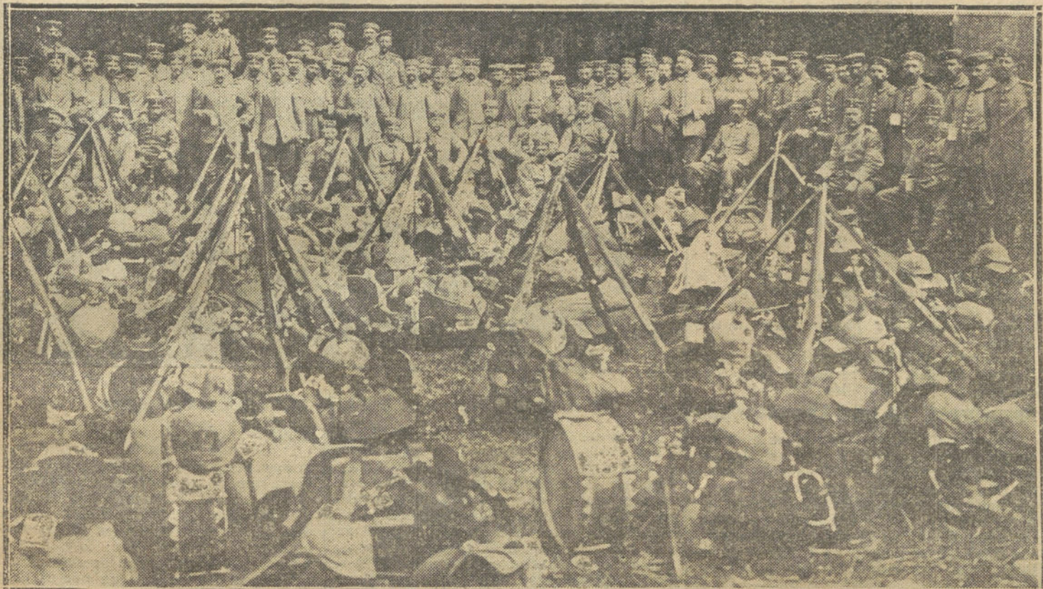
LA GUERRA DESDE BRUSELAS.—Las tropas alemanas acampadas en la Gran Plaza de Bruselas.

Para todo lo referente a publicidad francesa en LA TRIBUNA, dirigirse a nuestra agencia en París, rue VIVIENNE, 22.