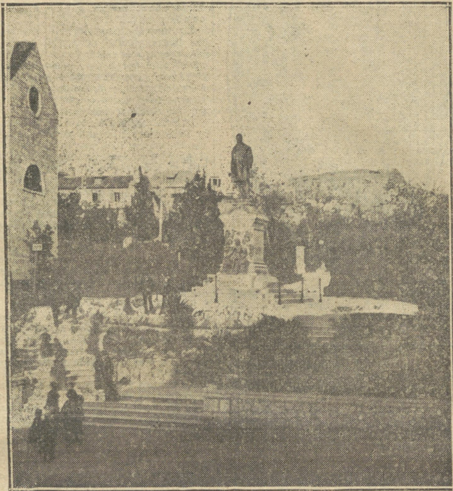
El parque de SEBENICO, puerto de la Dalmacia, donde ayer hubo una escaramuza entre buques de guerra austriacos y la escuadra anglofrancesa.

En los convoyes de prisioneros germanos que hemos visto hay niños de diez y seis años que lloran por sus madres, y viejos sexagenarios que suspiran por sus nietos. Pronto veremos mujeres también: las más robustas, las más jóvenes, las más bravas. Estas prusianas no harán marchas, no pelearán á campo raso, no cargarán á la bayoneta. Su misión es defensiva; custodiarán los fuertes, y, echadas boca á bajo en las trincheras,