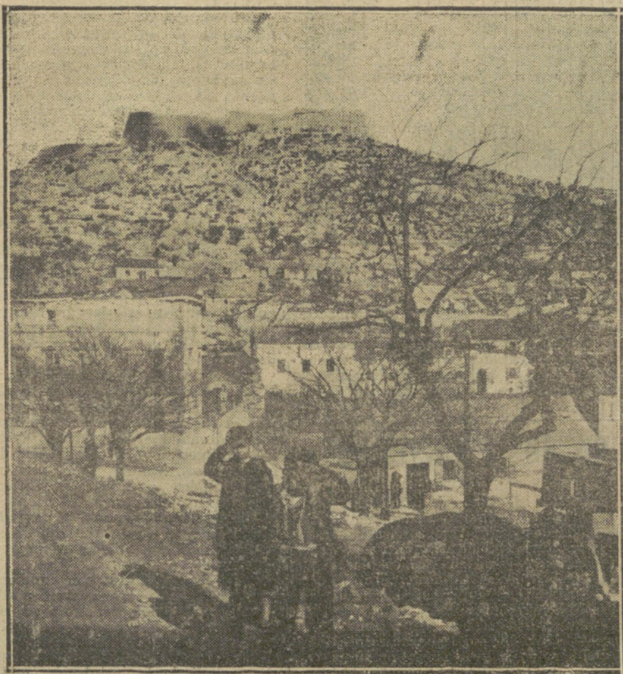
La fortaleza de SEBENICO, cuyos cañones intervinieron en la escaramuza naval del Adriático.

NUMERO DEL TELEFONO DE LA REDACCION, ADMINISTRACION Y TALLERES DE «LA TRIBUNA»: 4.444