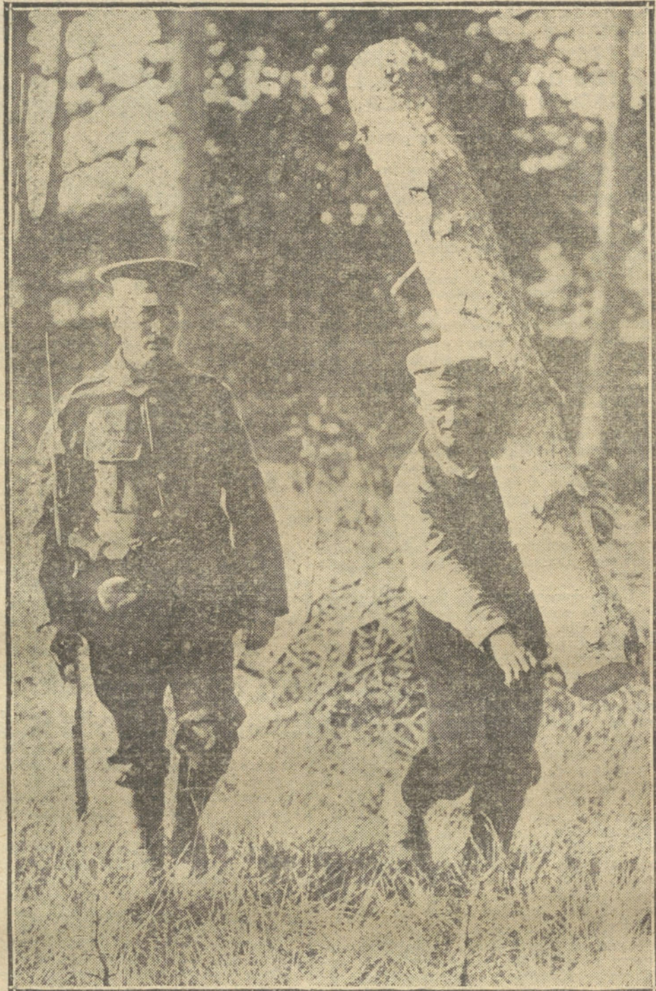
LOS PRISIONEROS DE GUERRA.—Prisionero alemán vigilado por un soldado inglés, trabajando en la construcción de trincheras en Camberley.

Ni una lágrima, ni un gemido; tenía la fuerza del pobre, del que ha vivido en constante lucha; sabía ocultar su aflicción; ni una frase de consuelo para sí misma, nada que revelase sus sentimientos; un silencio... después unos