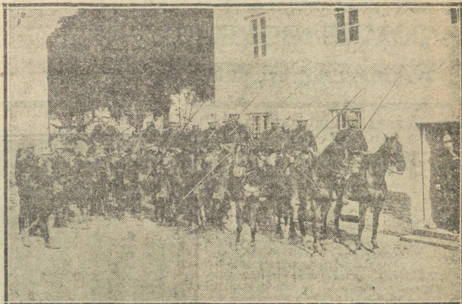
LA GUERRA EN BELGICA.—Lanceros franceses entrando en una aldea belga evacuada por los alemanes.