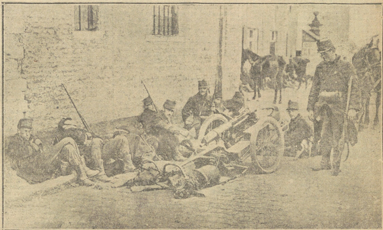
LA GUERRA EN BELGICA.—Tropas belgas (sección de ametralladoras) descansando después de una lucha violenta cerca de Lovaina.

Nosotros hemos recordado que, en ciertos interiores españoles, sobre el mármol