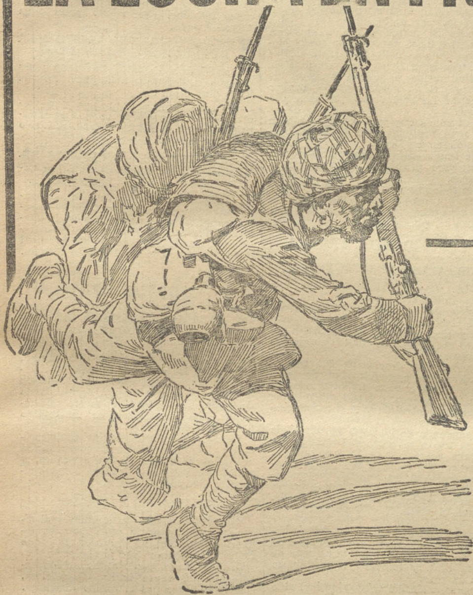
INFANTERIA CIPAYA (Ejército colonial inglés).

LOS COMBATES PRELIMINARES DE LA GRAN BATALLA DE LA FRONTERA RUSOGERMANA. LA BATALLA DEL AISNE NO HA TERMINADO TODAVIA. EL BOMBARDEO DE AMBERES. LO QUE DICEN LOS ALEMANES Y LO QUE CUENTAN LOS BELGAS. PORMENORES DE LOS ULTIMOS SUCESOS. LOS EFECTOS DE LA GUERRA EN ESPAÑA. LA SITUACION ECONOMICA Y LA CRISIS OBRERA. RUMORES Y FANTASIAS. LO QUE DICE EL GOBIERNO