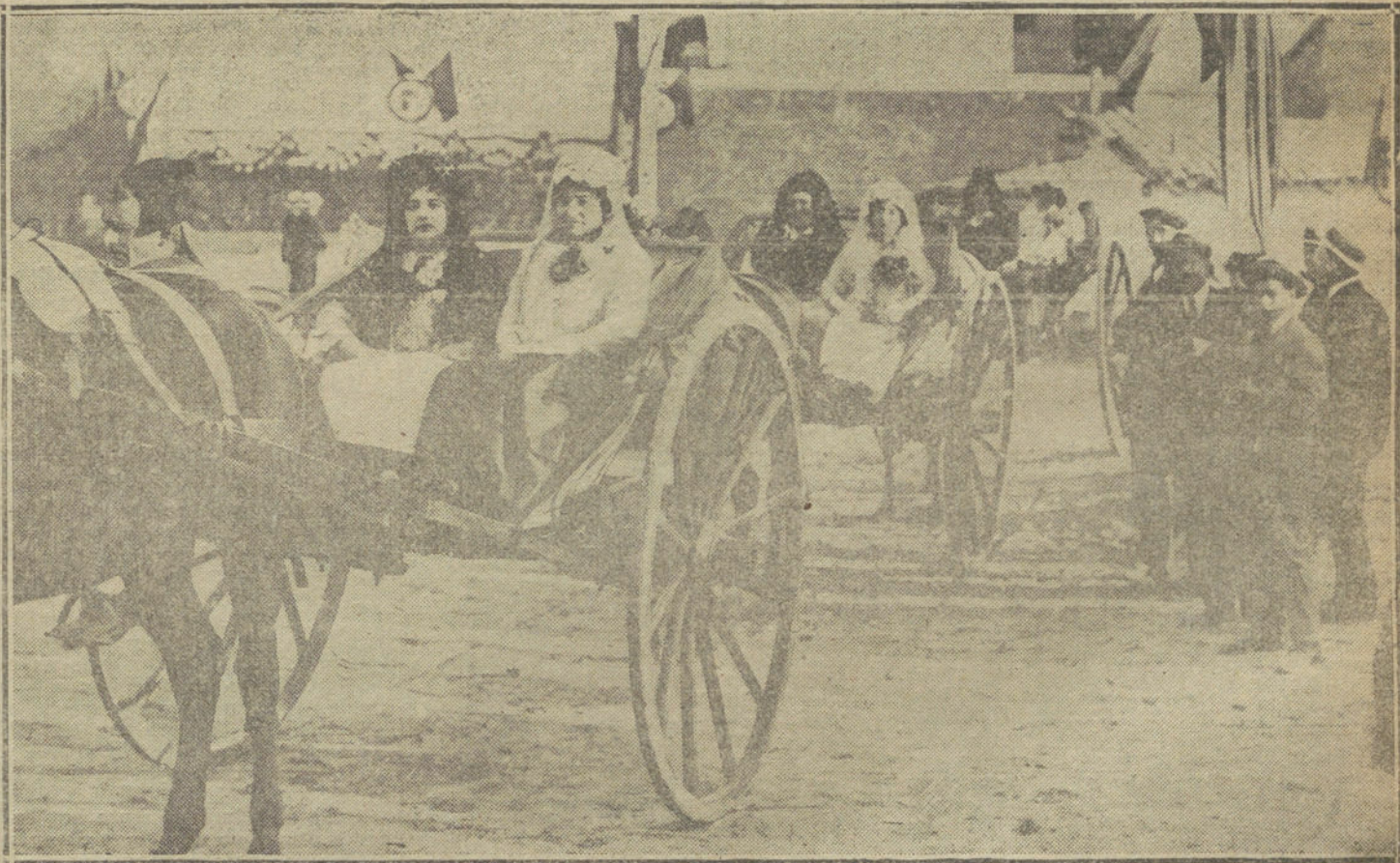
Un detalle de la cabalgata celebrada ayer tarde en el barrio de la Guindalera, con motivo de las fiestas del Pilar.

Los no asociados pueden asistir desde la tribuna entresuelo.