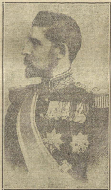
El Príncipe Fernando, heredero del Trono de Rumania.

En el bombardeo de Amberes tomaron parte 200 cañones de 28 y 30 centímetros y 10 morteros de 42.