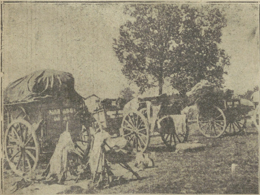
LA GUERRA EUROPEA.—Un convoy de aprovisionamiento y arzones de Artillería cogidos por los alemanes a los franceses en uno de los encuentros del Aisne.

—¡Ya ve usted qué misterios tiene la vida! Después de lo que yo he luchado por vivir, y cuando creía resuelto el problema de mi existencia, porque estoy