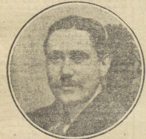
El maestro Turina, autor de «Margot».

El primer acto de «Margot» es de una impersonalidad absoluta. Nada en él demuestra ese espíritu que anima a la personalidad musical de un compositor. Se ve una gran soltura de instrumentación; pero se percibe también demasiado el acento francés. La sombra de Massenet y el recuerdo de «Manon» flota en el ambiente del primer acto.