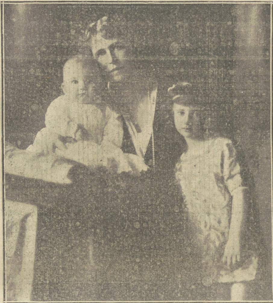
La Princesa María de Rumania y sus hijas. Muerto el Rey Carlos heredan la Corona el Príncipe Fernando y la Princesa María, cuya opinión favorable a la intervención de Rumania en el conflicto europeo era muy comentada estos días por la Prensa extranjera.

la cerilla ó el humo del cigarro pudieran ser causa de un contratiempo. Ya habrá usted notado que cerré la linterna para no ser visto. Pero cuénteme usted cosas de Bruselas y así se distrae y yo no me duermo. ¿Es cierto que hay allí prisioneros franceses?