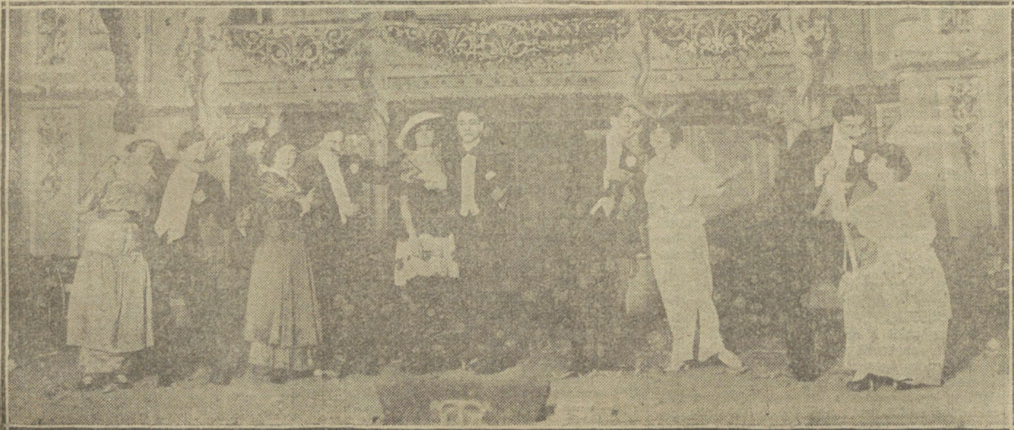
Una escena de «Margot», obra estrenada anoche en el teatro de la Zarzuela.

Pierde Vicente una vez el trapo de engañar y vuelve á la carga. Esta segunda parte es aún más «desaborida» que la primera. Al fin Pastor se cansa del huey y le sacude un linternazo desprendido. El bicho se muere. (Unas palmitas leves.)