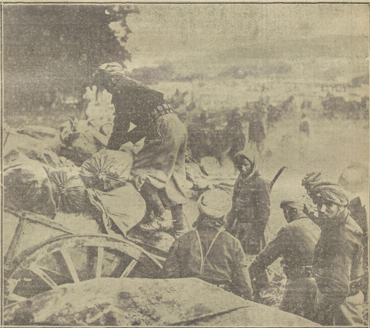
Tropas argelinas descargando en el campamento de France-le-Port, un convoy cogido a las tropas alemanas. (Fotografía trans. VIDAL.)

Y cuando todo se hubo verificado se empezó a honrar la memoria de los inolvidables héroes que habían sellado con su muerte la unidad de la Patria. Hoy se llevan en las comarcas donde se comba-