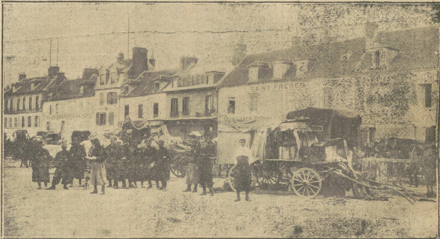
LA GUERRA EN FRANCIA.—Un convoy de aprovisionamiento conducido por tropas argelinas, á la llegada á Compiègne.

Y menos mal que encontré puesto en un vagón de cuarta clase que no tenía más que dos bancos empotrados en la cabeza y cola del coche, llenos todos de fusiles, mochilas y correajes; pero en