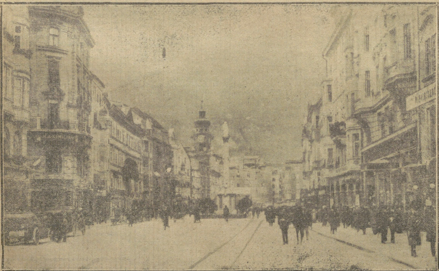
Gran avenida de la Inmaculada, en SALZBURG, ciudad adonde se dice que se trasladará en breve la Corte austriaca.

Además en el registro de señas me ponían: Estatura, 1,68 (yo, que apenas tengo un metro); pelo rubio y ojos azules. ¡Atiza! Excuso decir á ustedes que si tratan de comprobar las señas me di-