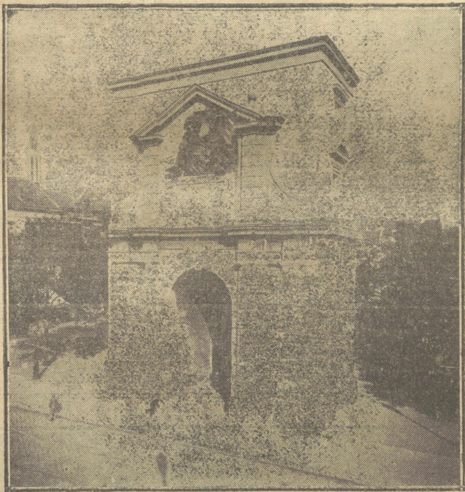
La puerta del Escalda, en AMBERES