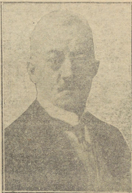
VON SANDT, gobernador civil alemán de Bélgica.

Todos los proyectiles produjeron destroz de bastante consideración, especialmente el que cayó sobre la estación,