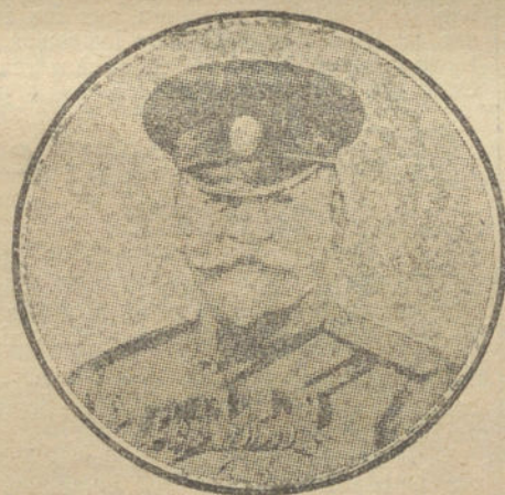
El general ruso SOUKHOMLINO, que ha derrotado a los alemanes en Augustow.

Los primeros soldados que marcharán serán los de la guarnición de Lisboa.