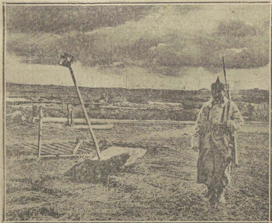
DESPUES DEL COMBATE.—Un centinela alemán junto a la tumba de un cornetero en los campos de Tielit.

La Infantería colonial, blusa marinera azul, pantalón gris azulado con franja roja y capote igual al de la Infantería de línea.