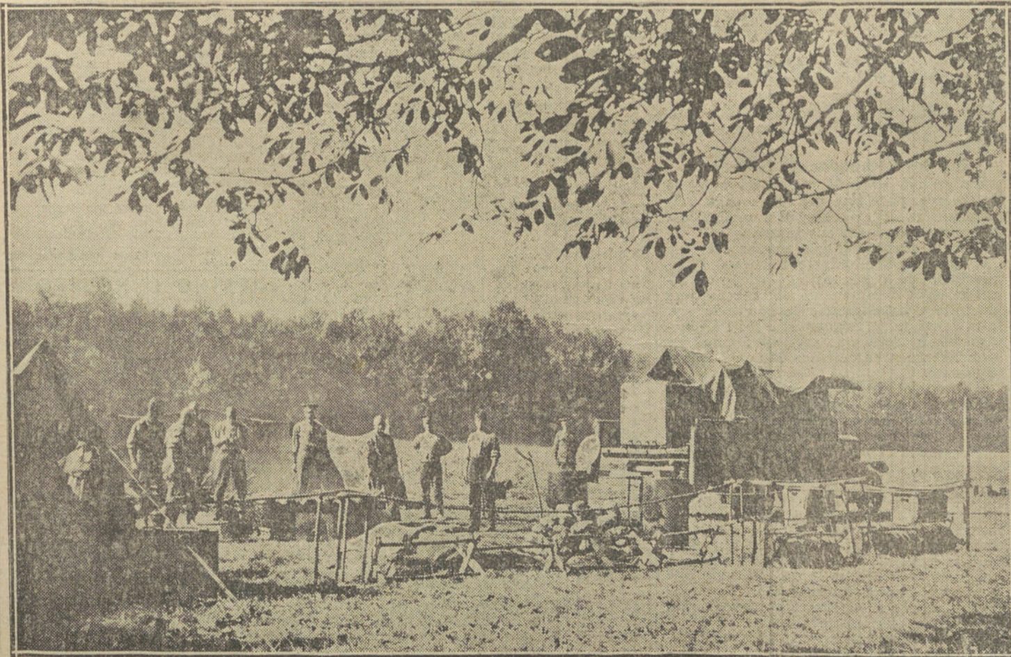
LA GUERRA EN FRANCIA.—Soldados ingleses preparando el rancho en una de las cocinas del campamento de Arras.