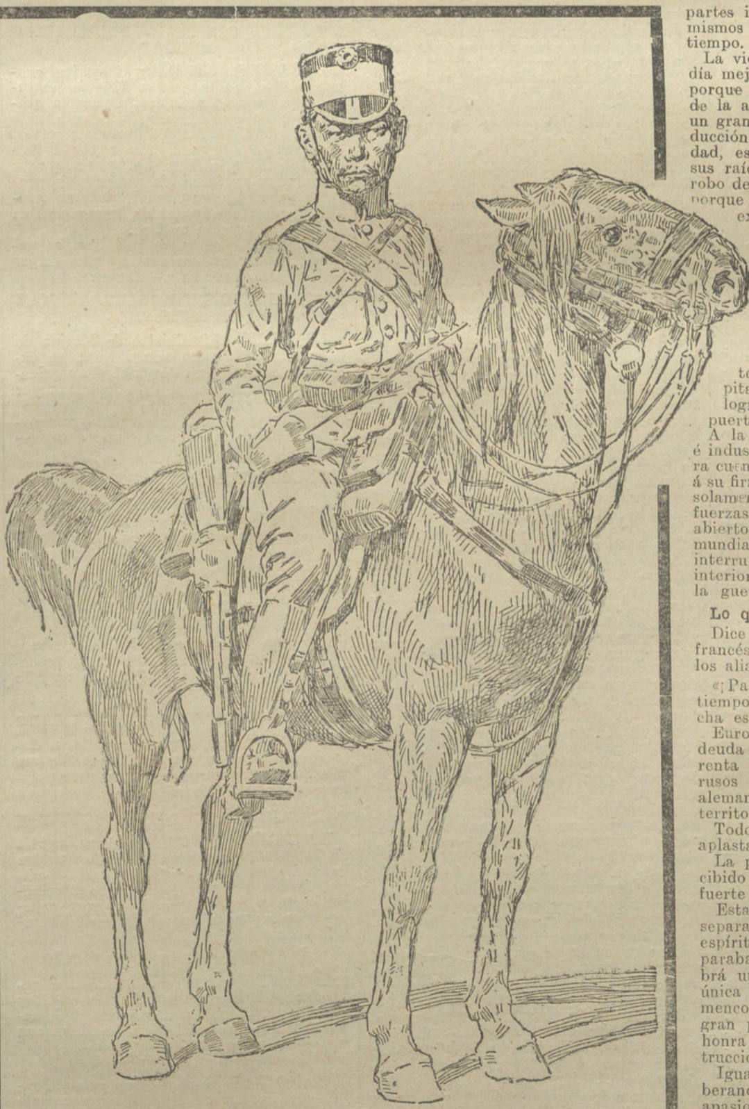
SOLDADO JAPONES DE CABALLERIA

Los daños ocasionados al comercio alemán por este procedimiento sin conciencia por parte de los ingleses, son muy grandes; pero serían incalculables si no llevásemos la guerra hasta el fin. Lo que se ha perdido hasta la fecha en valores sería perdido irremediablemente en el caso de «entenderse» prematuramente. Lo que se puede ganar se puede ganar mayormente sólo a costa de Inglaterra. Su política económica y su Hacienda son mucho más vulnerables, según pruebas irrefutables que van en aumento de día en día, de lo que quieren hacer creer