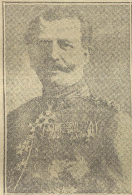
El general alemán VON EINEM, que toma parte en las operaciones de la Prusia oriental.

Si algún gobernante español se atreviese á romper la neutralidad declarando la guerra á Alemania, esta gran catástrofe se produciría inevitablemente, y, en cambio, si todos ayudamos á que España salga intacta de esta inmensa conflagración, una vez firmada la paz, España podrá orientarse fácilmente en la política exterior, y entonces, débiles y arruinadas las grandes potencias, España, con sus costas que dominan el Mediterráneo y el Atlántico y siendo una base magnífica para el dominio de África, allá donde nos inclinemos se nos acogerá con toda clase de ventajas, porque á nuestra futura alianza le llevaremos asegurado el dominio de Europa.