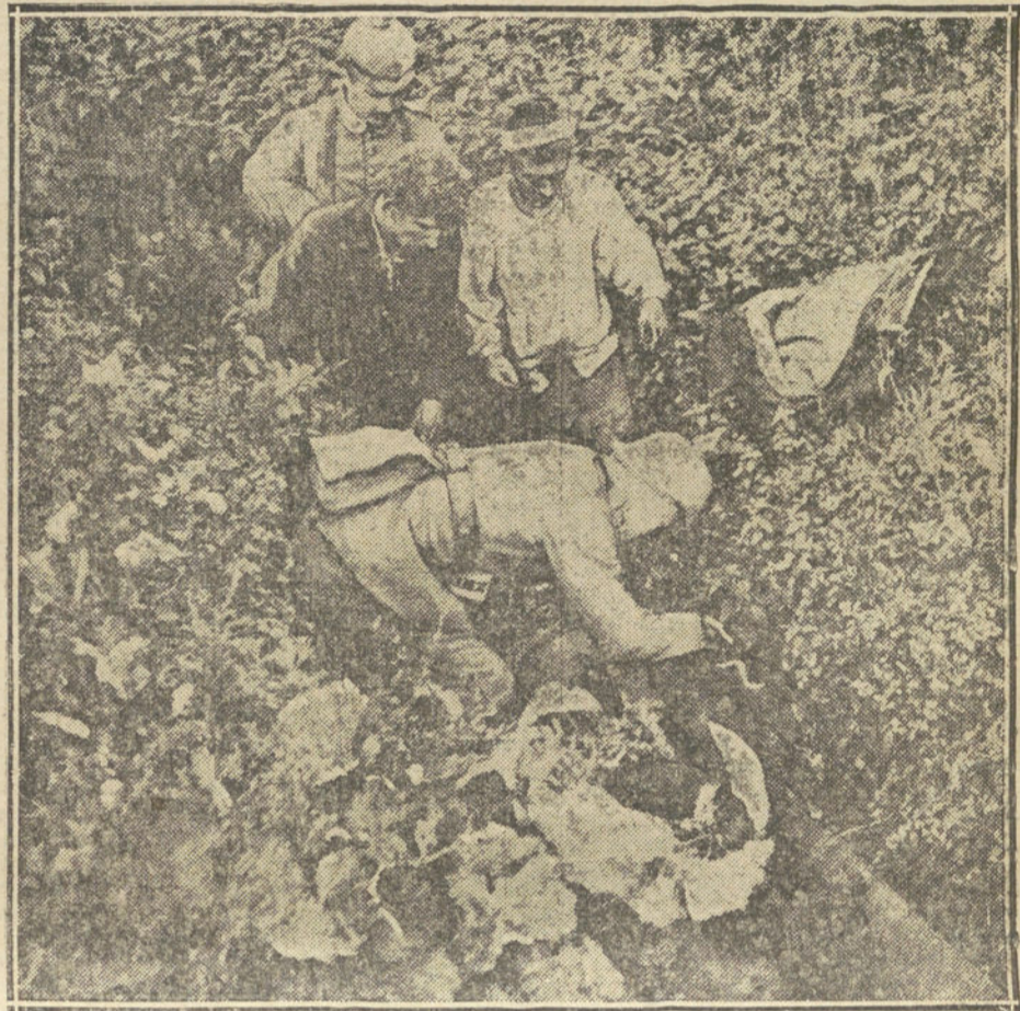
LA GUERRA EN BELGICA.—Soldados alemanes recogiendo heridos después de un combate en los campos de Tiehit.

Y, parándose, levanta los brazos y exclama: —Y, además, que molesta, hombre, que molesta. Eso de ir andando, y al dar un paso más, dejar de pisar tierra española, es cosa que me duele en el alma, que debe dolernos a todos los españoles, ¿verdad? Yo no me conformo con esa tontería que se nos dice de «dos hechos consumados». No los puedo aceptar dentro del patriotismo, aunque la razón lo aconsejara. ¡La razón! Bonita palabra para los ingleses. Hueca, vacía, sin sentido alguno. La razón para ellos no vale nada si no lleva a su lado el interés. ¿Dónde está la razón de que Gibraltar sea plaza inglesa? Hubiera sido conquistada en noble lid, y por fuerza tendríamos que conformarnos con el vencimiento; pero aspirando siempre poder levantar nuestra bandera donde nunca debió arriarse. La plaza ganóla el almirante Rook, en nombre de España, y no de Inglaterra. El almirante Rook, que después de haber fracasado en su intento de desembarcar en Cataluña, quiso buscar aquí el desquite tomando esta peña, que no tenía otros defensores que un puñado de soldados, hambrientos y sin armas, y con menos esperanzas de ser protegidos que el abandono en que España dejaba su defensa, es cosa que también debemos lamentar. Y dice la Historia que D. Diego de Salinas