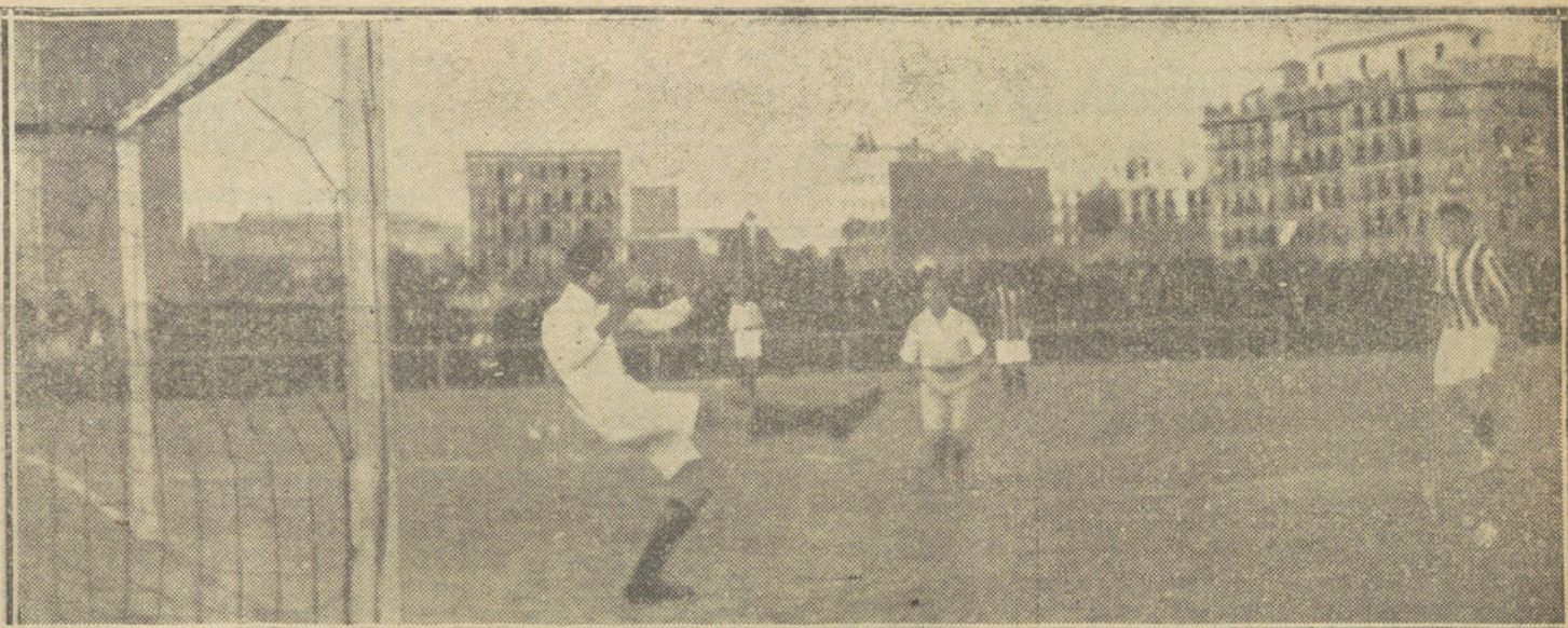
Un momento interesante del partido de fútbol jugado ayer en Madrid, y en el que se despidió del público el señor Pcla.

Industria y comercio. —El suelo alemán no era fértil; el pueblo lo ha hecho fecundo con su ciencia y su trabajo. Lo que fué monte árido, hoy es bosque espesísimo. Una cuarta parte del territorio está cubierta de árboles, excepto en la región Norte. Esta era una inmensa llanura arenosa. Se hicieron laboriosas explotaciones subálveas, se extrae el agua de los lagos; hoy hay praderas hermosísimas, que han centuplicado su rendimiento productivo.