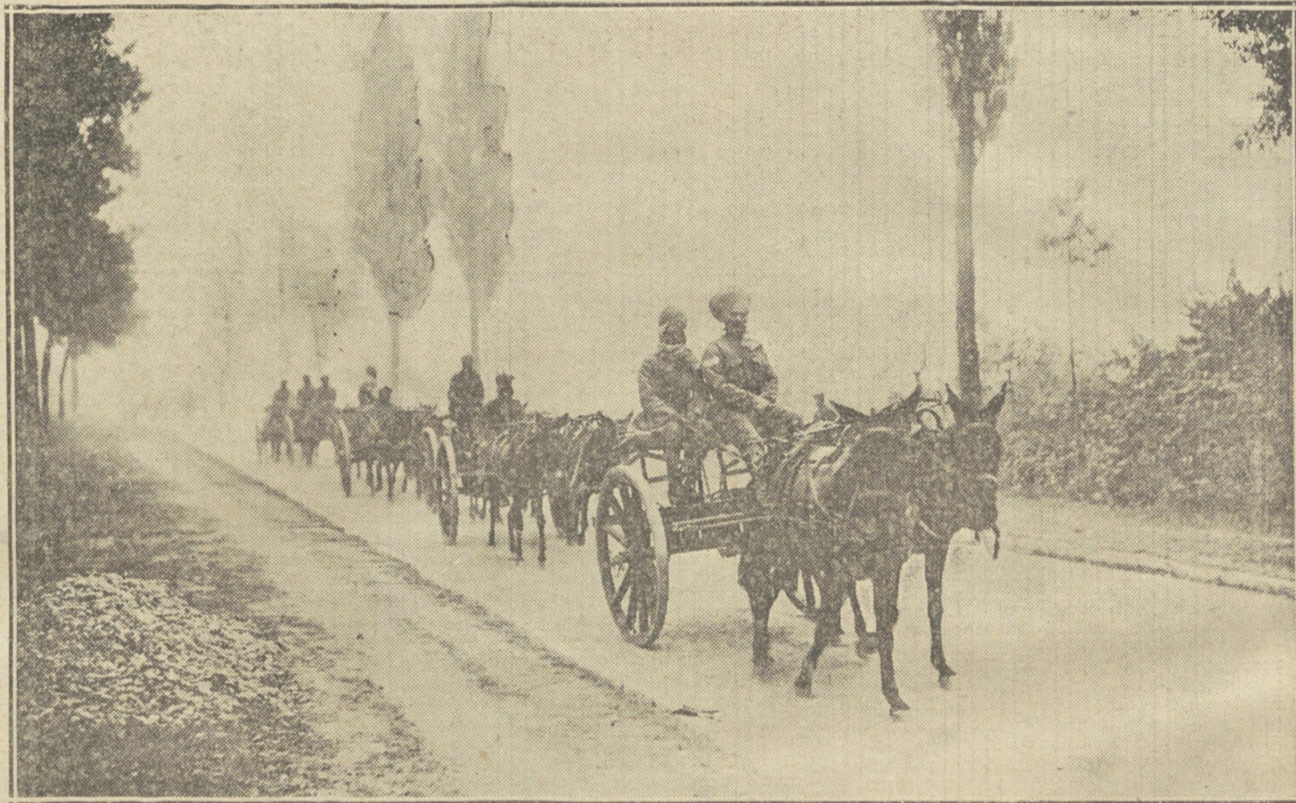
LAS FUERZAS COLONIALES.—Tropas indias en la carretera de Armentieres a Hazenbrouck.

A petición de los ingleses, los barcos alemanes mercantes surtos en el puerto de Amberes fueron echados a pique. Hay contradicción acerca del número de