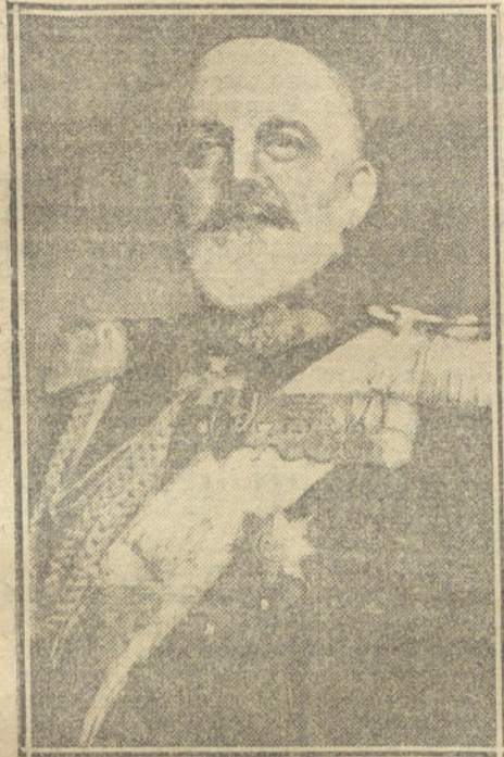
El general alemán VON HEENINGEN, que toma parte en las operaciones de la Polonia rusa.

De este acto sábase sólo que, no obstante lo que resulte del mismo, hoy se reunirá la Asamblea municipal del partido, para tratar del asunto, diciéndose se adoptarán medidas graves contra los desleales.