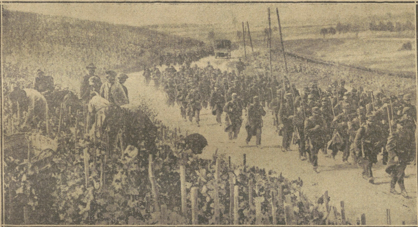
LA GUERRA Y LA PAZ.—Tropas francesas dirigiéndose a la línea de fuego al pasar por una carretera de la Champagne, en cuyos campos trabajan las mujeres y los ancianos.

En lo que se refiere al efecto específico de la guerra sobre la situación de Inglaterra como banquero del mundo, el catóptico alemán dice lo siguiente: «La publicación financiera más importante de Inglaterra, «El Economista», que en el interés de su país no cesa de protestar con