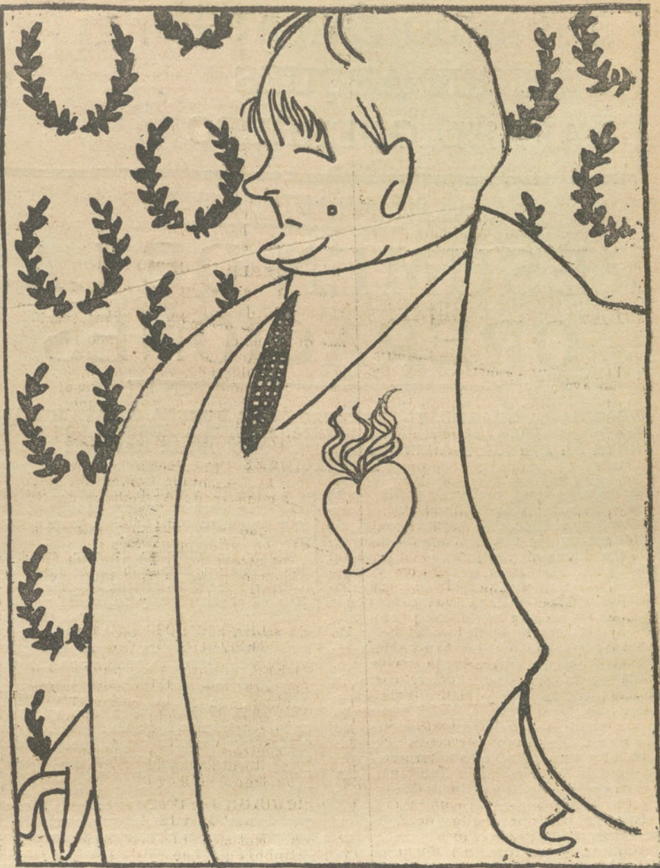
ENRIQUE BORRAS. (Caricatura de BAGARIA)