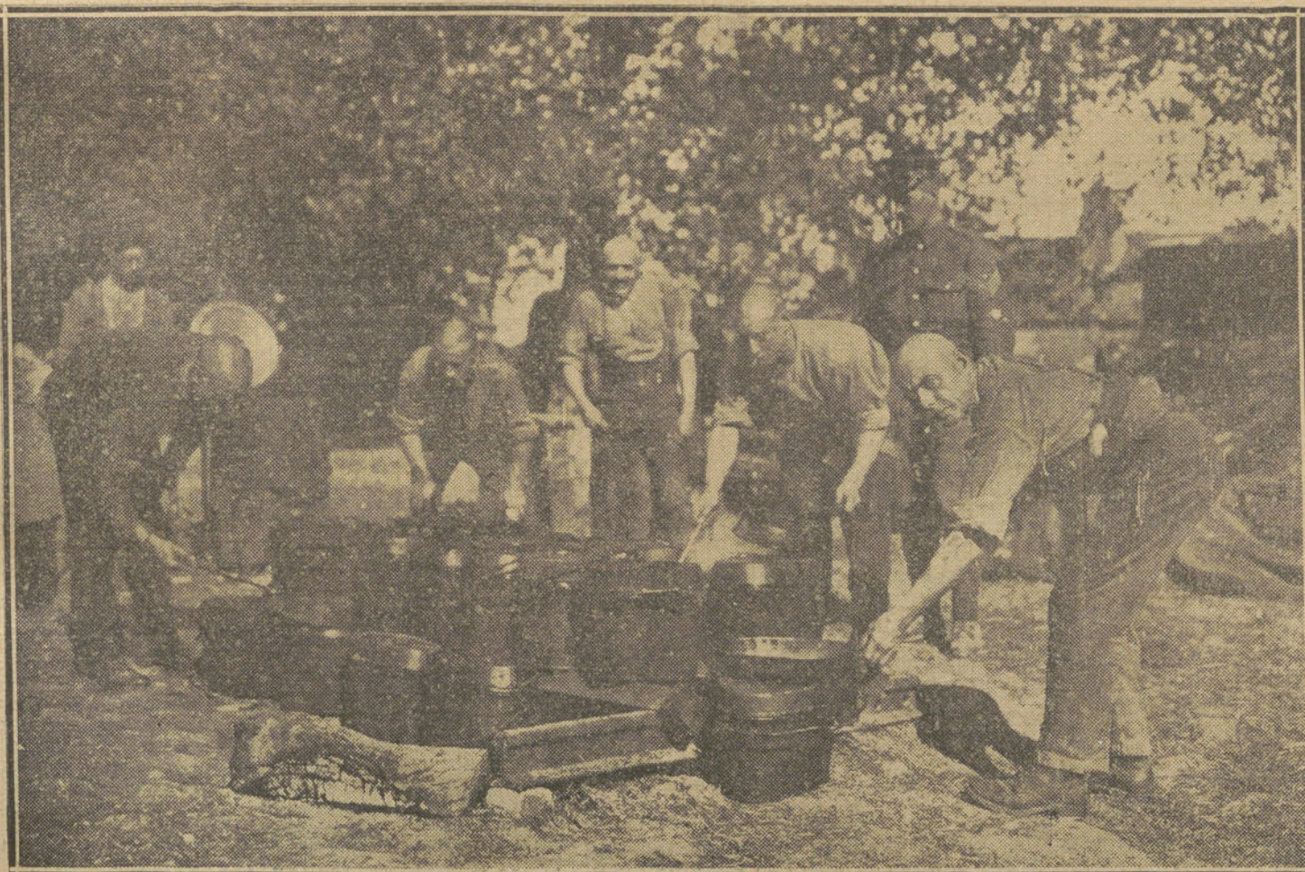
LA VIDA EN CAMPAÑA.—Soldados ingleses disponiéndose a repartir el rancho en el campamento de Iprés.