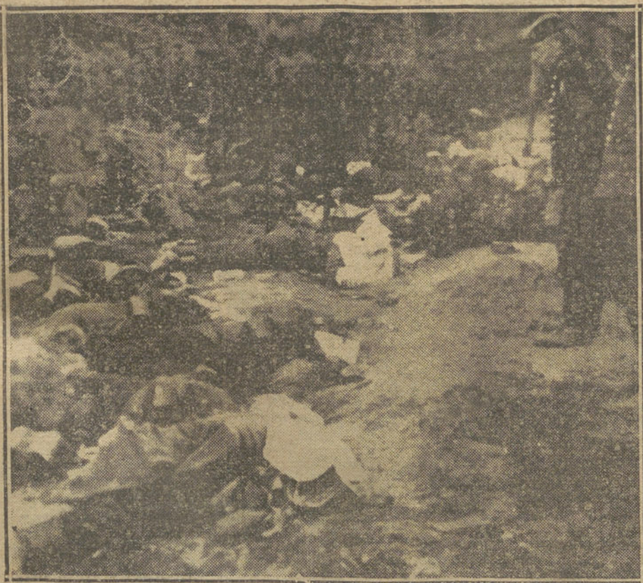
DESPUES DEL COMBATE.—Cadáveres de soldados franceses en un campo próximo a Péronne.

energía contra la política aventurera de Mr. Grey, se queja, sobre todo, de que todo el engranaje maravilloso de la banca mundial inglesa haya sido roto por la participación de Inglaterra en la guerra. Aquí me parece se halla el efecto más grave de la guerra comercial inglesa. Hasta ahora, el Banco de Londres pasaba por el Instituto banquero más seguro del mundo, y todos los Estados «exóticos» buscaban y encontraban dinero en la Bolsa de Londres, como también todas las letras del gran comercio internacional se giraban sobre Londres: Todo esto está ahora acabado.