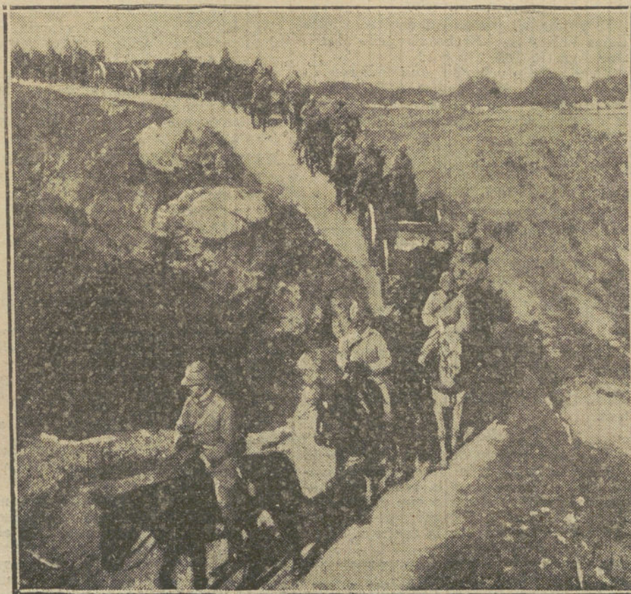
LA GUERRA EUROPEA.—Artillería alemana en marcha.

«El Regimiento alemán, en su prefacio, dice: «La artillería de á pie, artillería pesada, debe, en colaboración con la artillería de campaña, abrir á la Infantería el camino de la victoria.»