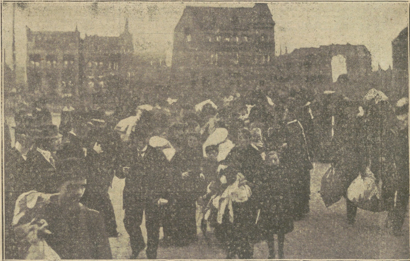
LAS VICTIMAS DE LA GUERRA.—Grupo de fugitivos de Amberes á su llegada á Rotterdam.

Nuestras razones no les causan ya el mismo desagrado que al principio de la guerra. La soberbia está hoy velada por un cierto temor de que fracase el plan de Inglaterra y admiten probabilidades que antes negaban en absoluto. Tienen la preocupación obsesiva de los «zeppelines» y los submarinos, preocupación que no llegan á disimular, á pesar de las bromas que siempre tienen para la eficacia de sus daños. Pero es una sonrisa forzada, sonrisa de conejo.