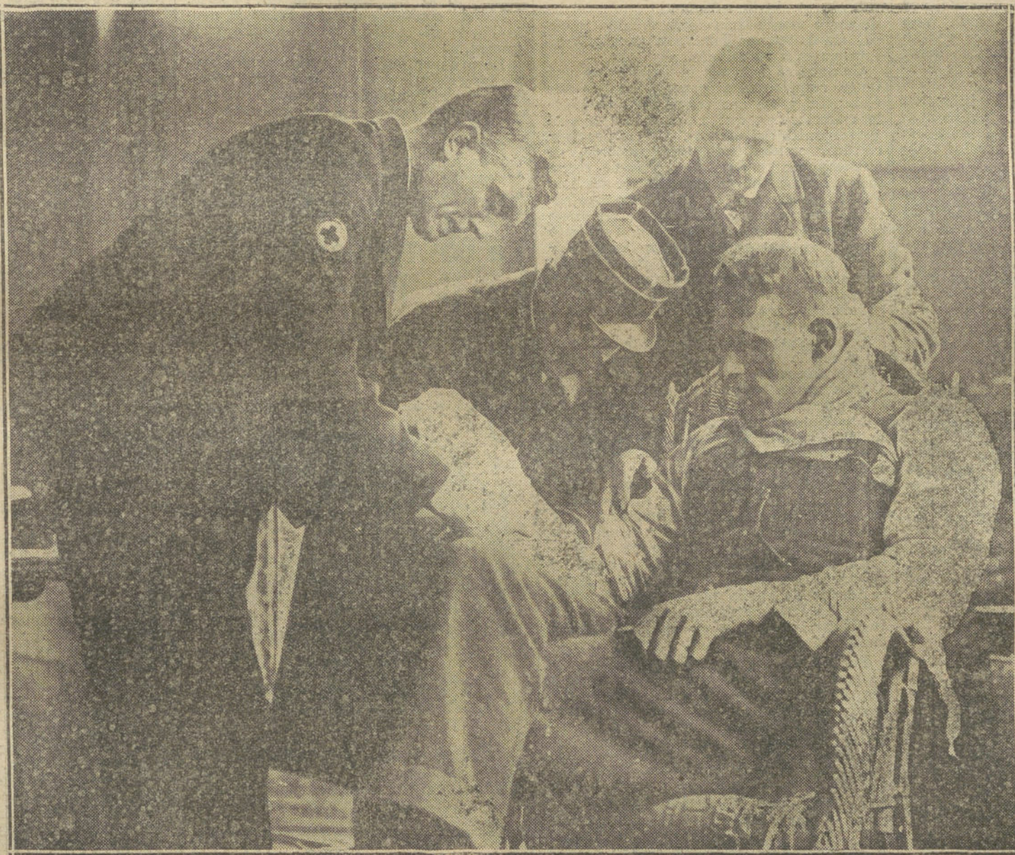
LAS VICTIMAS DE LA GUERRA.—Un aviator militar inglés herido después de un arriesgado vuelo, asistido por médicos franceses en un hospital de la frontera francobelga.

La actividad de los combates en tierra, perderá su intensidad dentro de ocho días, y entonces comenzarán los alemanes a preparar la invasión de Inglaterra. ¿Cómo tendrá lugar ésta? Es preciso suponer que los alemanes intentarán primero con los submarinos y con los destroyers destruir la mayor cantidad posible de la flota inglesa. En seguida los navíos alemanes que se encuentran actualmente en las aguas del Ems avanzarán en dirección de Inglaterra. Vendrán los submarinos, los destroyers, los cruceros rápidos, los acorazados y los navíos transportes. Este ataque será idéntico al que intentaron al principio de las operaciones en Francia. En caso de éxito, los navíos transportes, protegidos por los navíos de guerra, desembarcarán sus tropas. Si, por el contrario, la flota inglesa impidiera a los alemanes atravesar el Ems, avanzarán en dirección a Inglate-