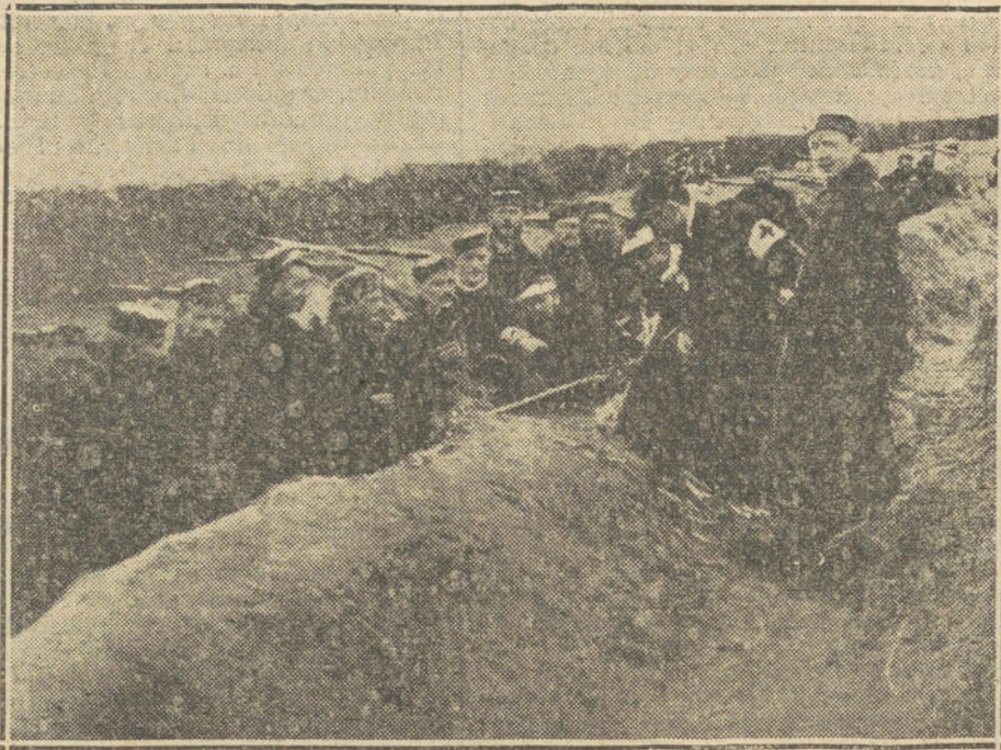
LA GUERRA EN BELGICA.—Un sacerdote alemán visitando á los soldados en las trincheras momentos antes de entrar en fuego.

Los aliados tienen también á su favor que la batalla se entabla casi al borde del mar, y, por lo tanto, la ayuda de los cañones de gran alcance de la escuadra inglesa cooperará muy eficazmente. Luego hay que contar con las condiciones del terreno en donde se entabla la lucha, que, como digo más arriba, será una de las mayores dificultades á vencer por los alemanes. La región de Iprés, como la cuenca del río Iser, como la de Dunkerque, son comarcas inundables á voluntad del hombre, y no es aventurado suponer que los aliados hayan abierto