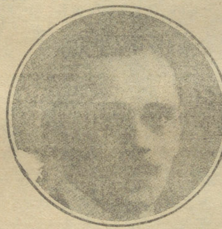
El Príncipe MAURICIO DE BATTENBERG, hermano de la Reina de España, muerto heroicamente en uno de los últimos combates.

PARIS. M. Poincaré ha dirigido los siguientes telegramas de pésame por la