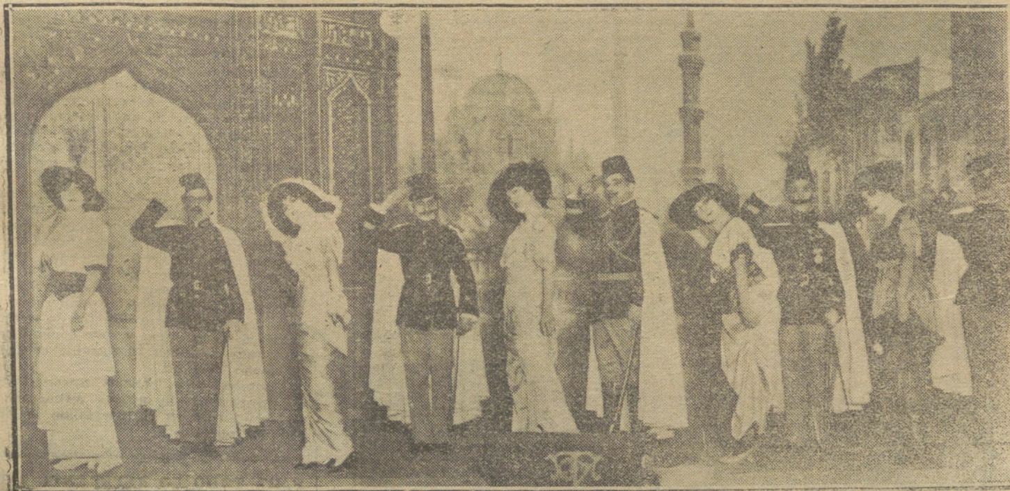
Una escena de la opereta «El príncipe bohemio», de Manolo Merino y el maestro Millán, estrenada anoche con gran éxito en el teatro de la Zarzuela.