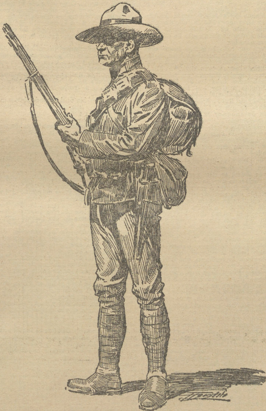
INFANTERIA AUSTRALIANA (Ejército colonial inglés.)

El periódico suizo la «Gaceta de Lano» publica un artículo acerca de la vida en Londres. En él dice lo siguiente: «La guerra no ha modificado mucho la vida nacional de Inglaterra. El estado de guerra no se ha proclamado en todo el territorio. El «Metro», el «tube» funcionan regularmente en Londres. Hay muchos uniformes en las calles. En las Universidades, más de dos tercios de estudiantes se han inscripto como soldados. Todos los almacenes ponen en sitios