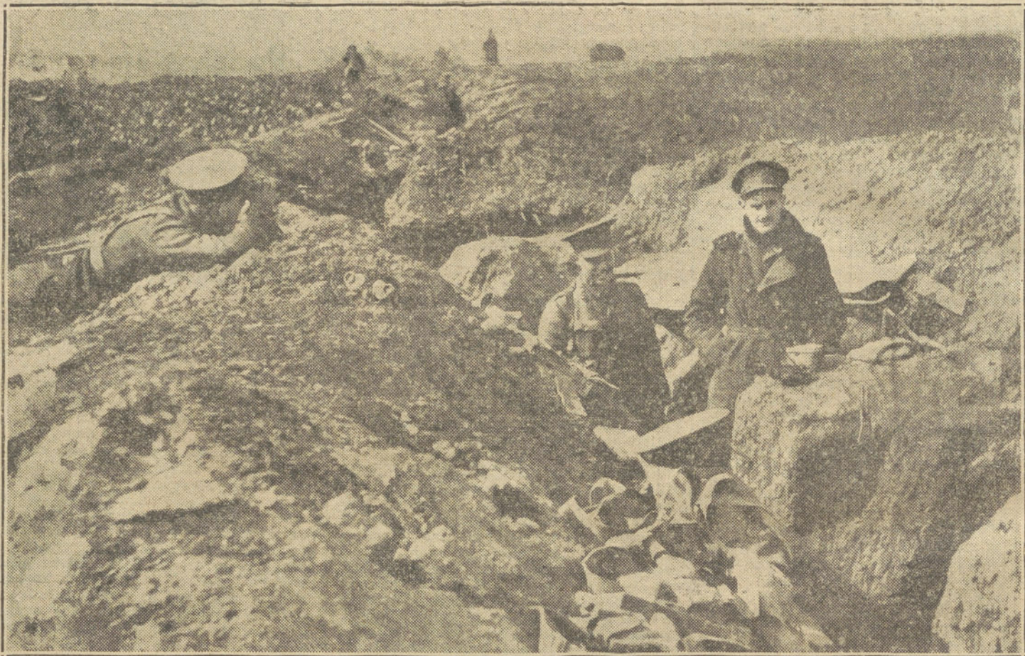
UN ALTO EN LA MARCHA.—Oficiales ingleses en una trinchera del Aisne, después de un violento combate.

La contestación dada por el Almirantazgo es razonable y lógica: «La vasta extensión del mar y Océano—dice el manifiesto del Almirantazgo—y los miles de islas de los archipiélagos ofrecen a los barcos del enemigo una casi libertad de acción. A pesar de los esfuerzos hechos para cortar sus provisiones de carbón, siempre han podido aprovisionarse, no obstante las grandes dificultades, que diariamente aumentan. Por consiguiente, el descubrimiento y destrucción de esos barcos no es sino cuestión de tiempo y suerte.»