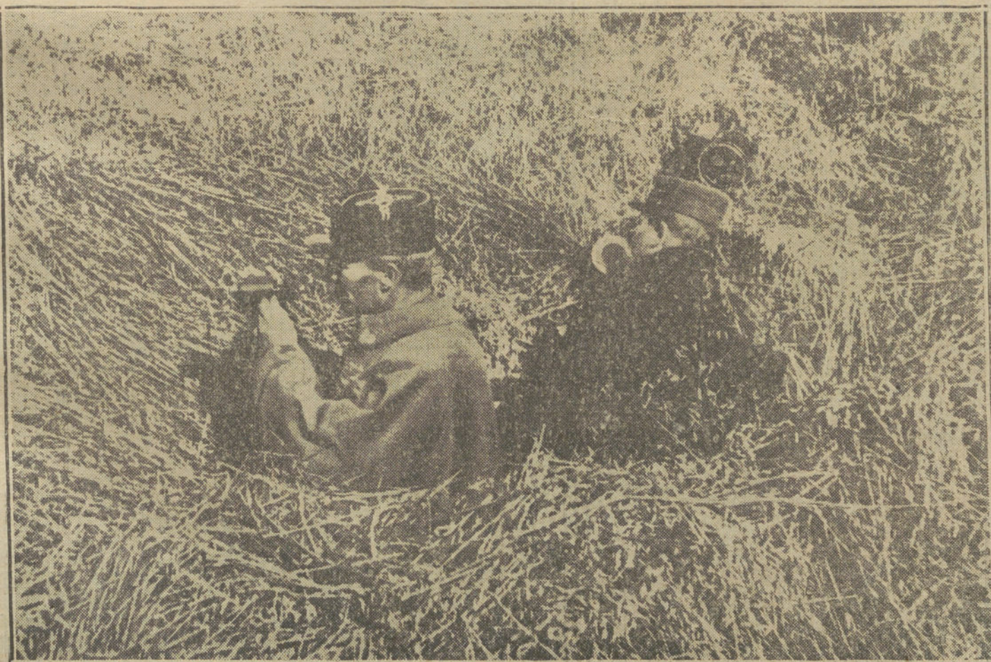
LA VIDA BAJO TIERRA.—Un jefe de un grupo de Artillería y un telegrafista militar prestando servicio de campaña durante uno de los combates del Aisne.

El soldado turco fué siempre bizarro y tenaz. Plewna es una página gloriosa y triste de la marcial historia otomana, y aun en el reciente conflicto balkánico, las líneas infranqueables de Tchataldcha, dieron patente de su abnegación legendaria.