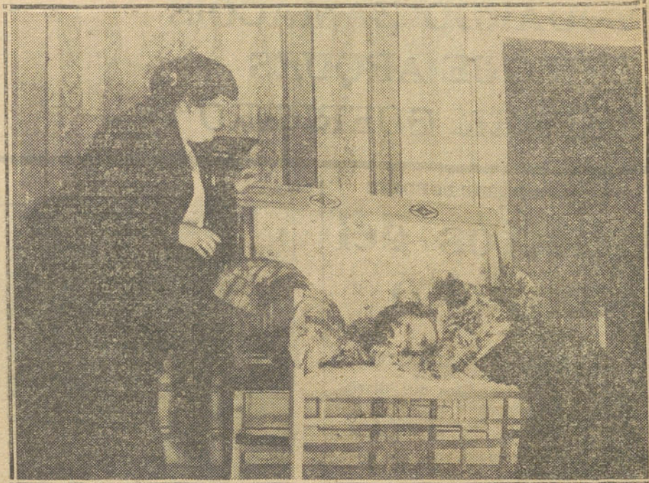
Una escena de «La pasión», comedia de Martínez Sierra, estrenada anoche con éxito en el teatro de Lara.