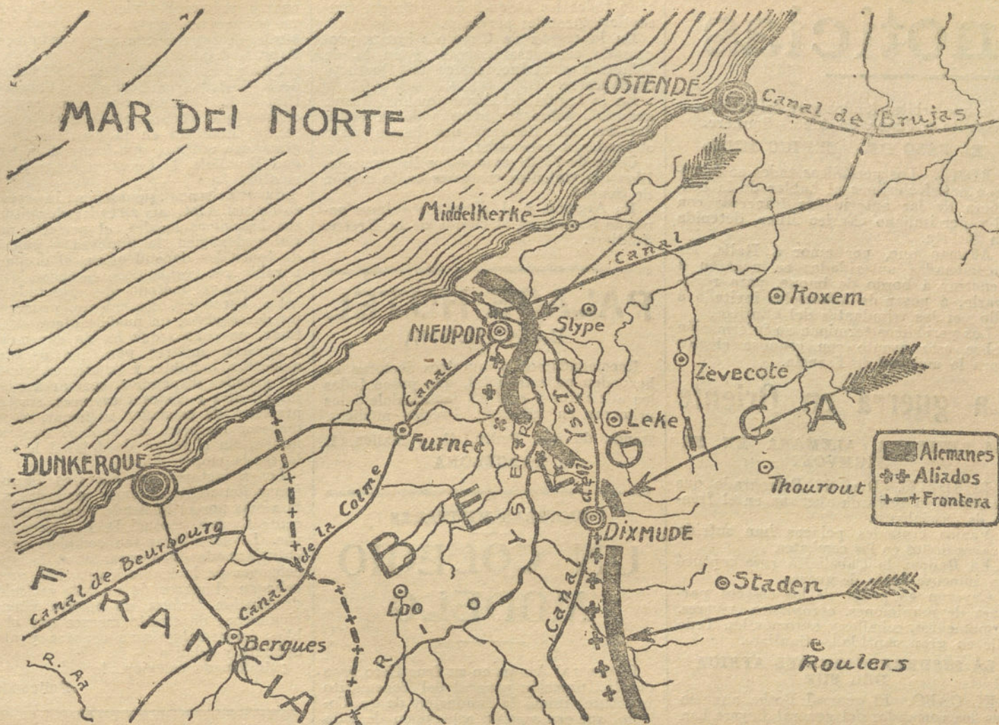
Situación geográfica del puerto de Dunkerque, hacia donde se dirige el avance alemán.

LONDRES. También se afirma en Amsterdam que han pasado sobre la población de Hasselt ocho «zeppelines» armados.