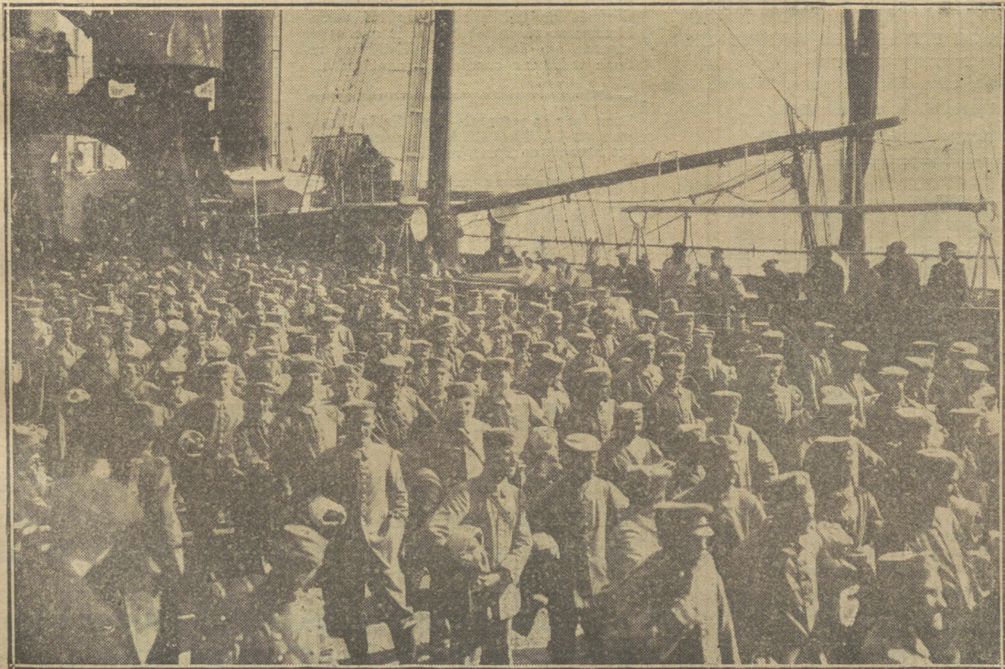
LA GUERRA DESDE BURDEOS.—Embarque de prisioneros alemanes para Marruecos en el puerto de Burdeos.

PARA TODO LO REFERENTE A PUBLICIDAD FRANCESA EN «LA TRIBUNA», DIRIGIRSE A NUESTRA AGENCIA EN PARIS: 22, RUE VIENNE, 22.