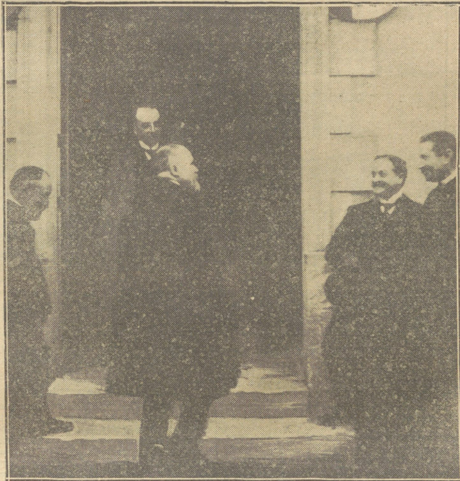
LA GUERRA EN FRANCIA.—M. Poincaré, entrando en el Hospital de convalecientes de Martillac. El Presidente de la República es recibido por el alcalde, M. Vayssieres.

Estas afirmaciones contradicen los juicios anteriores de que me hacía eco en artículos precedentes, según los cuales, la lucha en el Iser se consideraba como la de mayor trascendencia entre las que se han librado desde que empezó la guerra. Y como nosotros, observadores imparciales, no tenemos las mismas razones que los periódicos franceses para el disimulo, seguimos pensando que si en esa batalla el éxito se decide resueltamente por los alemanes, beneficiará grandemente la posición de éstos. No hablemos ya del peligro que significa para Inglaterra, y que ya señalaba anteriormente; pero retemos estos dos hechos concretos. Los aliados, al oponerse al avance alemán, intentaban impedir la unión de las fuerzas que bajaban de Amberes con la antigua ala derecha, que manda el general Von Kluck, y evitar el peligro del movimiento envolvente iniciado por los alemanes al correrse hasta la costa. Rota esa barrera, las consecuencias pueden ser éstas: repliegue del ala izquierda francesa para evadir el movimiento envolvente, y, como consecuencia, abandono