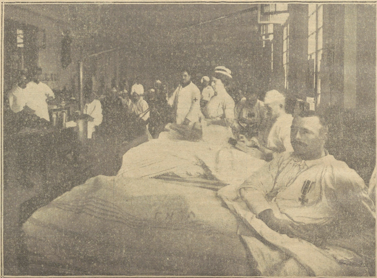
LA GUERRA DESDE BURDEOS.—Sala de heridos alemanes en un hospital de alemán que ostenta en su pecho la Cruz de Hierro.

LA TAREA DE DEVOLVER TODOS LOS TRABAJOS QUE NO PUBLICAMOS SERIA ABRUMADORA, Y PARA EVITARLA, COMO PARA PREVENIR RECLAMACIONES, QUE RESULTARIA IMPOSIBLE ATENDER, RECORDAMOS QUE NO SE DEVUELVEN LOS ORIGINALES.