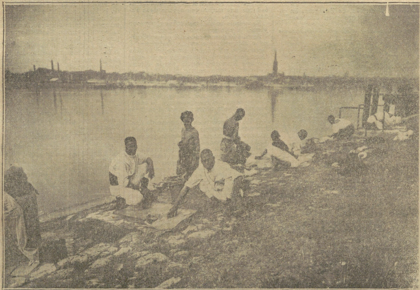
LA GUERRA DESDE BURDEOS.—Tiradores argelinos lavando sus ropas en el Garona.