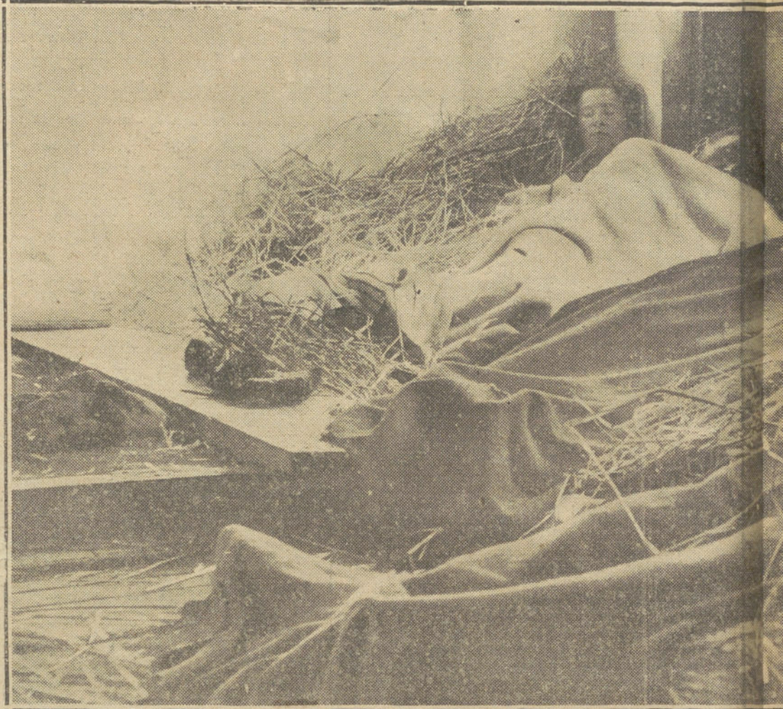
LAS VICTIMAS DE LA GUERRA.—Fugitivos belgas de Amberes

¡Y pensar que todas aquellas muecas eran «póstumas»! ¡Pensar que la persona allí representada, la que gesticula y corre y pasa por innumerables momentos durante el rápido devanar de la película, ya es tierra! ¡Considerar que aquellas facciones tan expresivas, aquellos nervios tan vibrantes, siguen moviéndose después que la carne duerme en paz! ¡Pensar en el milagro de la imagen, de la sombra, que continúan viviendo cuando el cuerpo