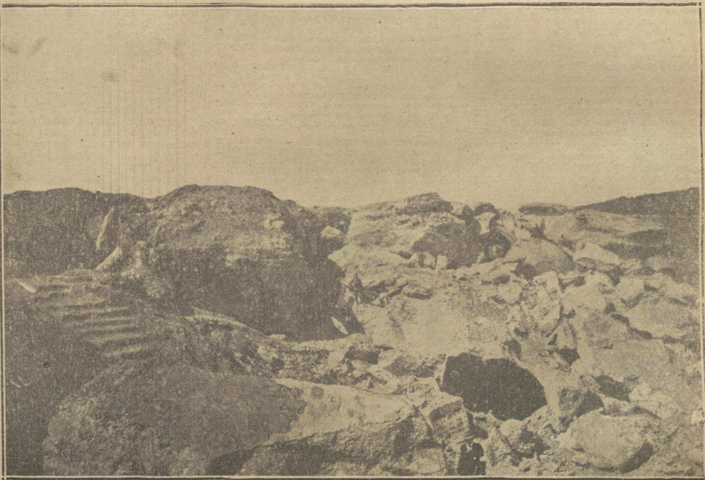
LA GUERRA EN BELGICA.—Efectos causados por un obús de un mortero de 42 en el fuerte Louvain.