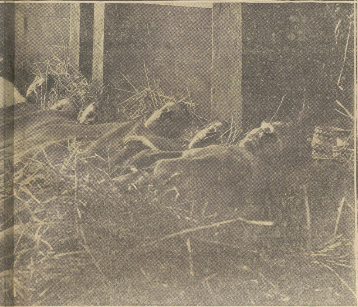
Refugiados en un caserón de la frontera holandesa.

pital de los lugares y tierras de los Holsteins-Gottorp.