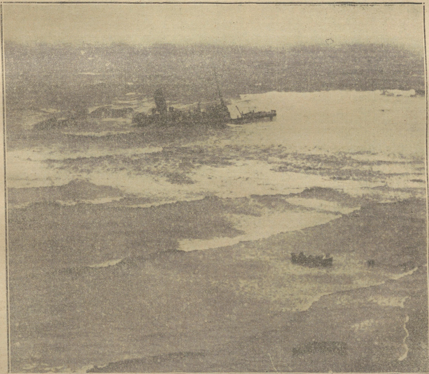
LAS VICTIMAS DE LA GUERRA. —Naufragio del buque hospital «Rohilla», que se fué a pique al chocar con las rocas en la costa de Ashore, empujado por una espantosa galerna. (Fotografía obtenida desde una de las lanchas de salvamento que acudieron en auxilio de los naufragos, trans. VIDAL)