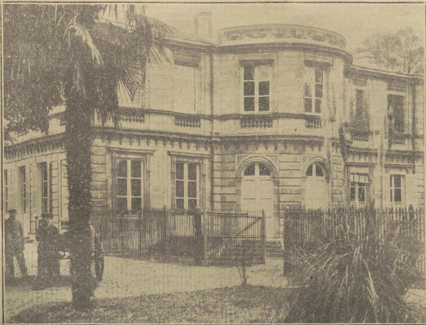
LA GUERRA DESDE BURDEOS.—Edificio destinado a hospital de heridos alemanes, dirigido por la Asociación de Damas francesas.