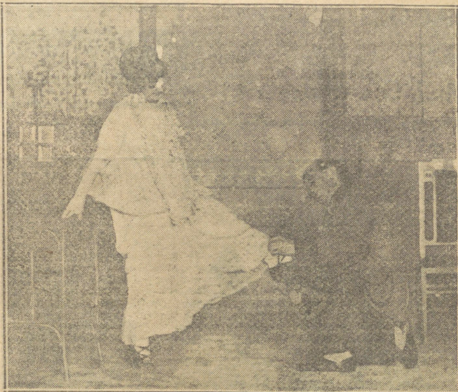
Una escena de la obra de los Sres. Fernández Portero «Las minas de Costabella», estrenada con gran éxito en el teatro Alvarez Quintero.

¿Dónde está, pues, la linde espiritual de ambas culturas? ¿Dónde reside el ceceo que separe el grano germano del