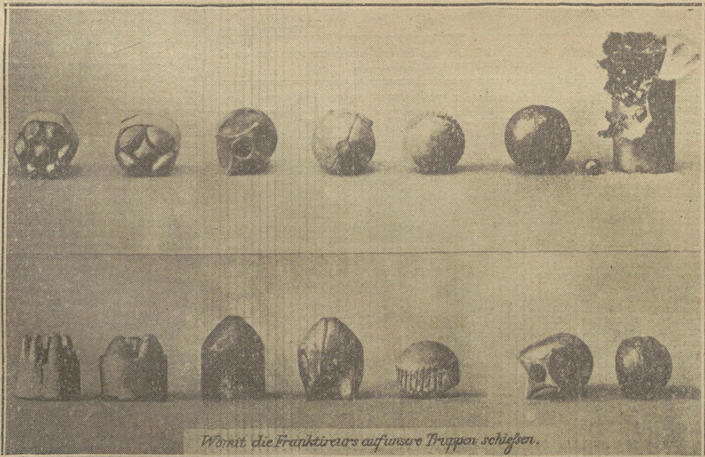
Womit die Franktireurs auf unsere Truppen schießen.

De este modo abandonaría su independencia cualquiera de los beligerantes que pudiera aprovecharse primero de la ocasión. Se puede decir que los socialistas de todas partes del mundo intentan ayudar á establecer una paz que sea perdurable y que están unánimes en cuanto á limitar la raza imperialista en las preparaciones para la guerra, las cuales conducen sin duda alguna á la misma. Pero no se puede tratar de un desarme universal en el futuro inmediato, aun cuando toda Europa se destruya. Es el horror de las consecuencias del militarismo imperialista. Mientras que haya naciones menos civilizadas que Europa, será preciso que ésta proteja su defensa para su propia seguridad y protección.»