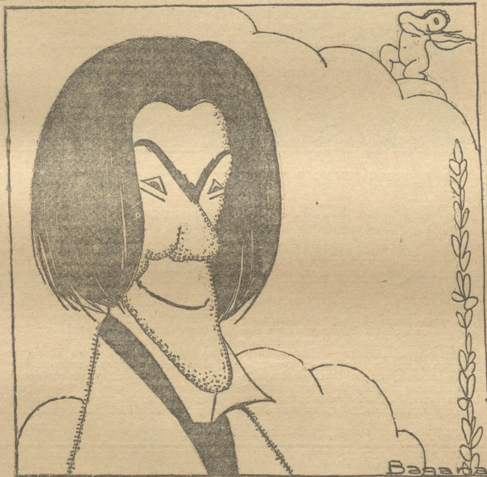
FRANCISCO COSTA, notable violinista que da esta noche un concierto en el Ateneo. (Caricatura de BARRIA)

grano latino? ¿Tendremos que venir á parar en que las razas, como concepción cultural, no son acaso más que un anhelo místico, esa abstracción metafísica que sin delimitaciones reales se incuba en las conciencias, y en ellas levanta el altar de un rito, y en la hegemonía de creencia estriba esa fuerza misteriosa de irradiación que posee? ¿Es el misterio religioso, que el catecismo nacional impide descifrar? Es, en una palabra, el cinturón de hierro que aprisiona á una masa determinada, ó acaso la utopía que liga á unos millones de hombres, acaso más extraños entre sí que con los de la nación más lejana. Pero es, en fin, la creencia que arraigó ya en todos ellos. Es la voz de una masa. ¿Eficaz? ¿Consciente? ¿Fundada?... Conformémonos con sentir que es la voz de la masa. Después podremos decir con el doctor Stokman, el personaje que creara Ibsen: «La voz de la verdad no es la voz del mayor número. ¿Cuáles son las verdades que proclama la mayoría? Las viejas. Y cuando una verdad se hace vieja, está á punto de convertirse en mentira.»