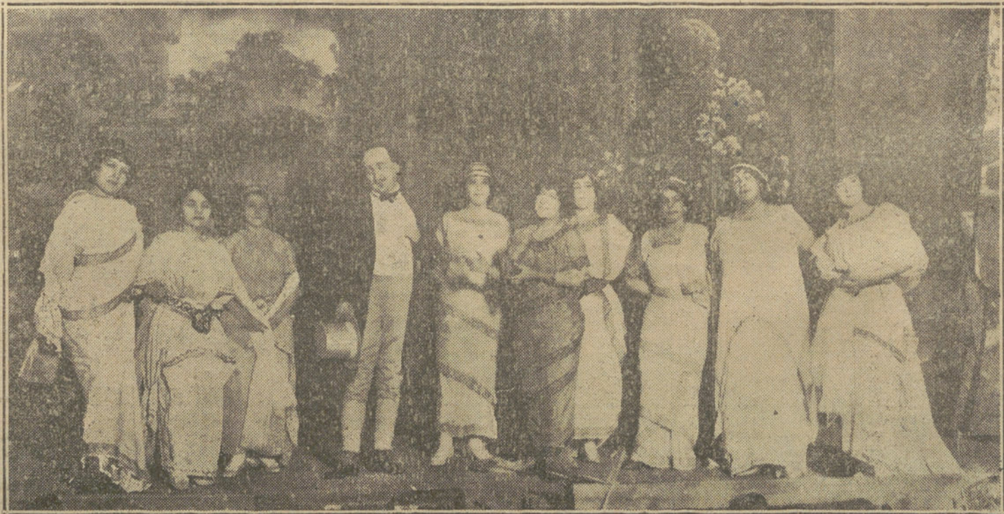
Una escena del segundo cuadro de la obra de Manolo Garrido y el maestro San José «Amor y gloria», estrenada anoche con ruidoso éxito en el teatro de Novedades.

Don Alfonso saldrá para Madrid mañana, en el sudexpreso.