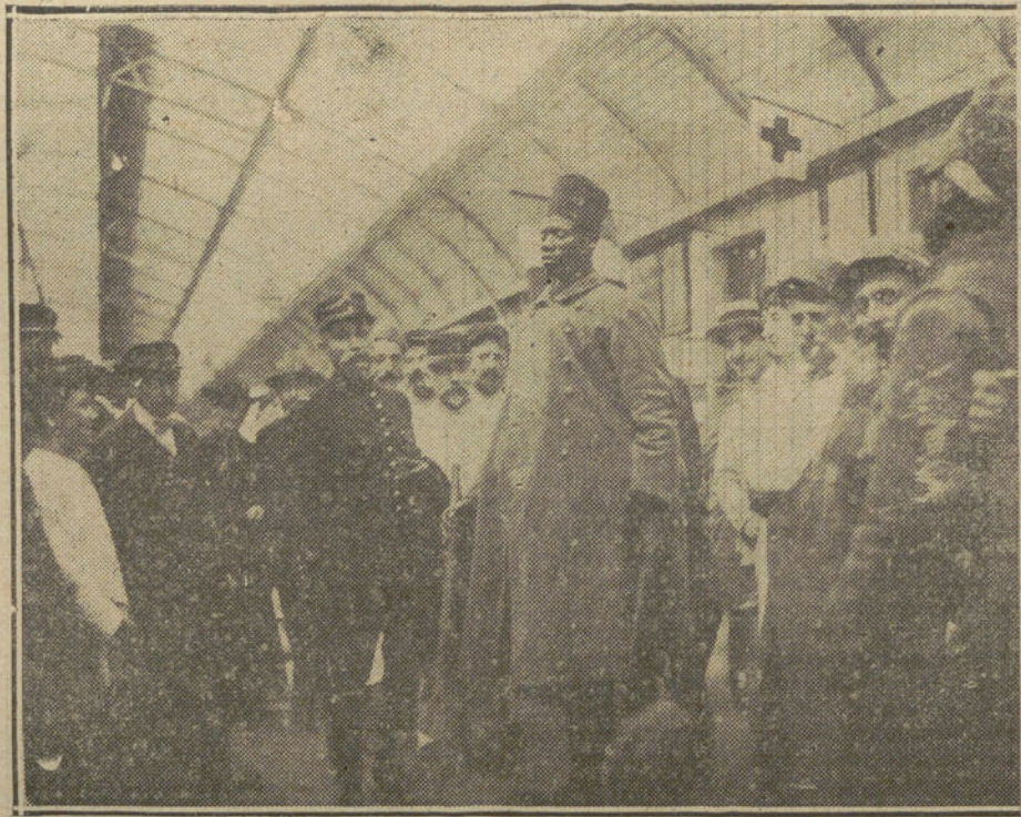
LOS TIRADORES ARGELINOS.—Un gigante argelino en la estación de Mont-de-Marsán.

Fueron encargados de defender la línea del Iser, y no dejaron de cumplir su misión con la misma abnegación y heroísmo con que defendieron los fuertes de Lieja. A ellos, a ellos solamente, se debe que los alemanes no hayan llegado a las proximidades de Dunkerque, no obstante el fuego de los barcos de guerra de los aliados. Hubo momentos en que se esperaba que las posiciones de los aliados quedaran envueltas y destruidas. Pero los belgas se formaban de nuevo con tenacidad épica, aunque sus enormes bajas bastaban para haber quebrantado la moral de cualquier ejército. La posición fué salvada por los héroes de Lieja; los diques dejaron de aprisionar