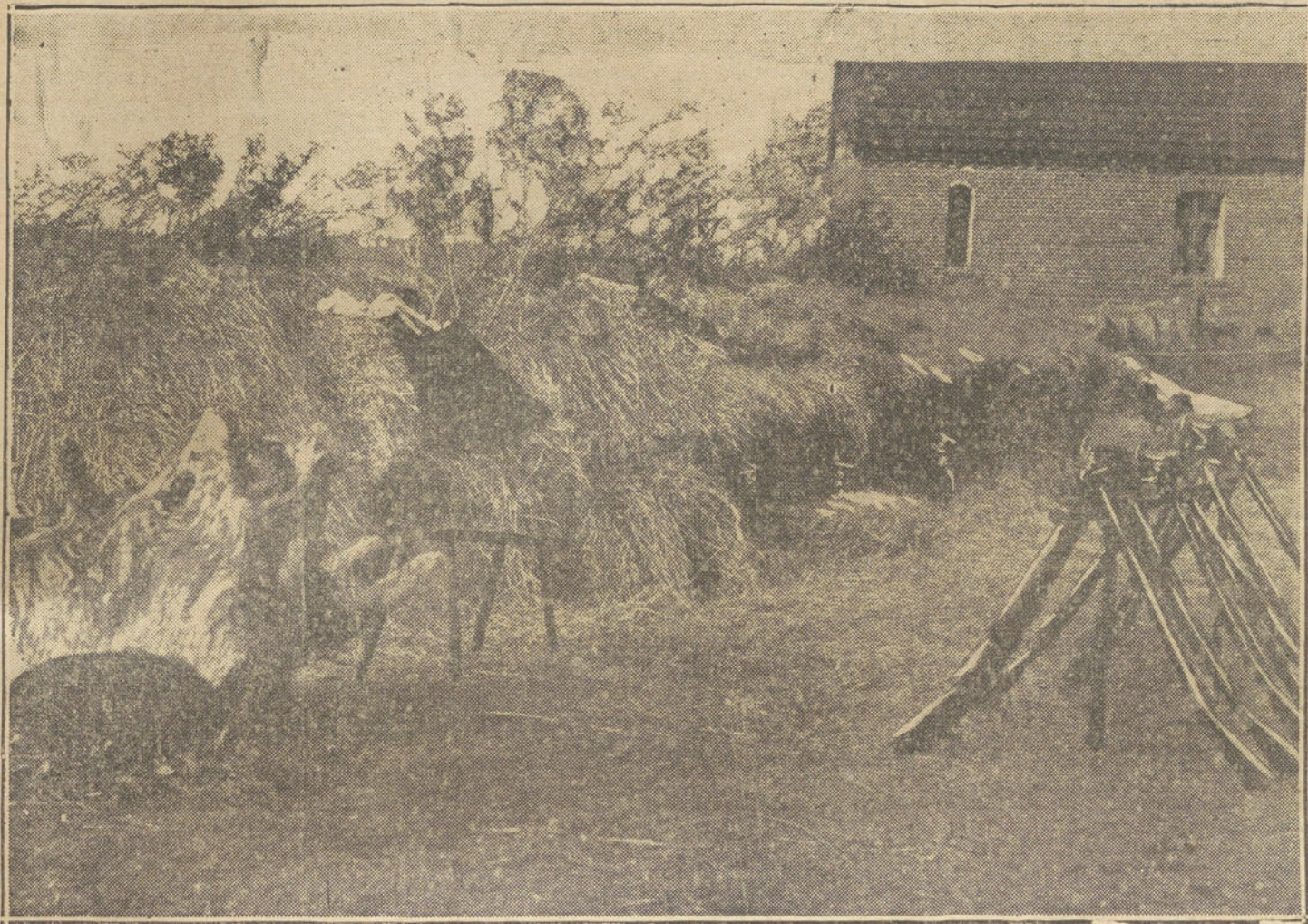
VIVIENDO BAJO TIERRA.—Trincheras alemanas en las cercanías de Ipres.

Los hechos actuales han venido á demostrar lo contrario.