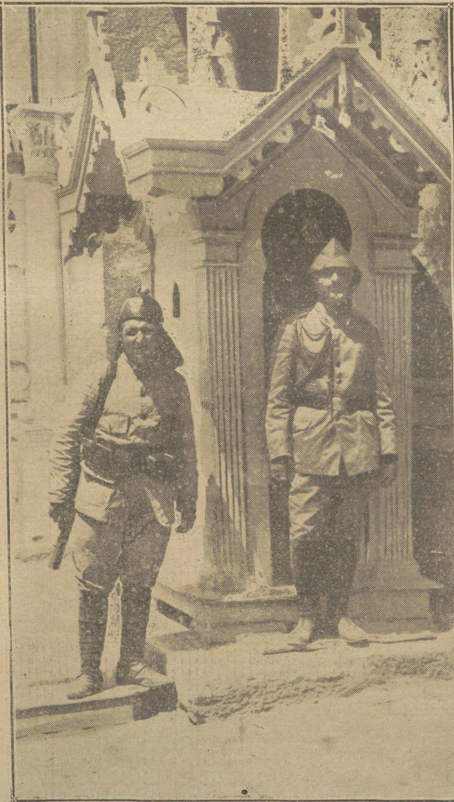
EL EJERCITO TURCO. —Soldados turcos á la puerta del ministerio de la Guerra de Constantinopla, con los nuevos uniformes de campaña. El centinela lleva un curioso casco, que sólo se usa en Turquía cuando se hacen las guardias.

El «Fremden Blatt» trae una información de Petersburgo, según la cual este metropolitano de la iglesia greco-católica de Lemberg ha sido transportado á la población rusa de Kursk, acompañado de una fuerte escolta de la Guardia civil.