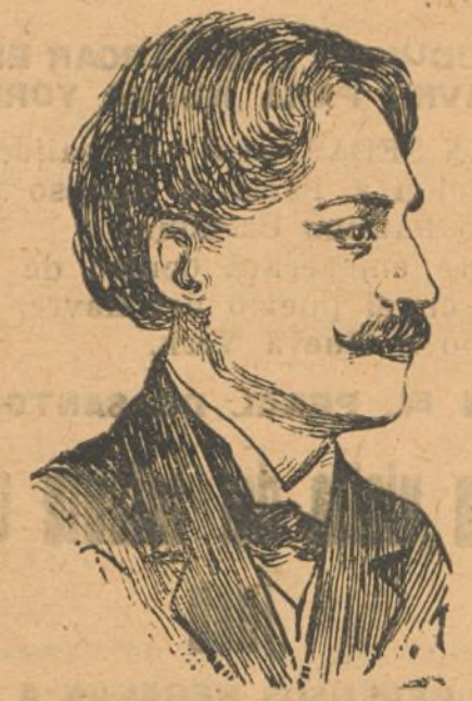
Henri Barbusse, ilustre novelista francés, miembro del Instituto de Francia, que se encuentra gravemente enfermo.