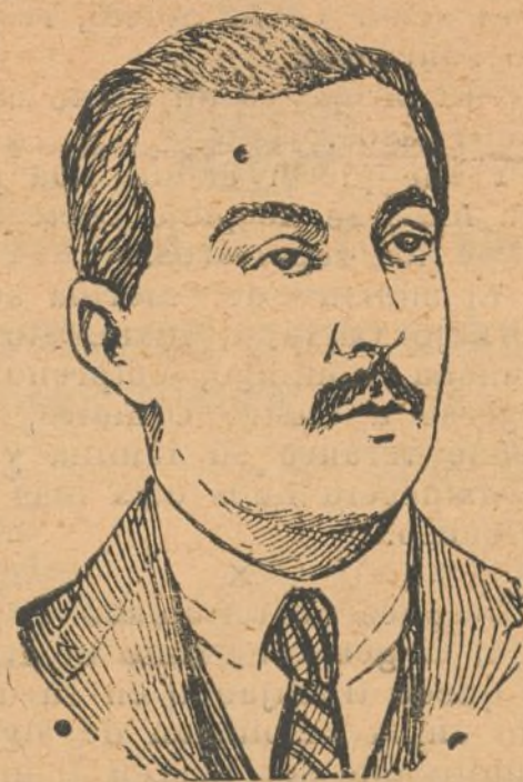
Achmed-Bey Zogu, que se ha proclamado rey de Albania, con el nombre de Sanderbeg III.