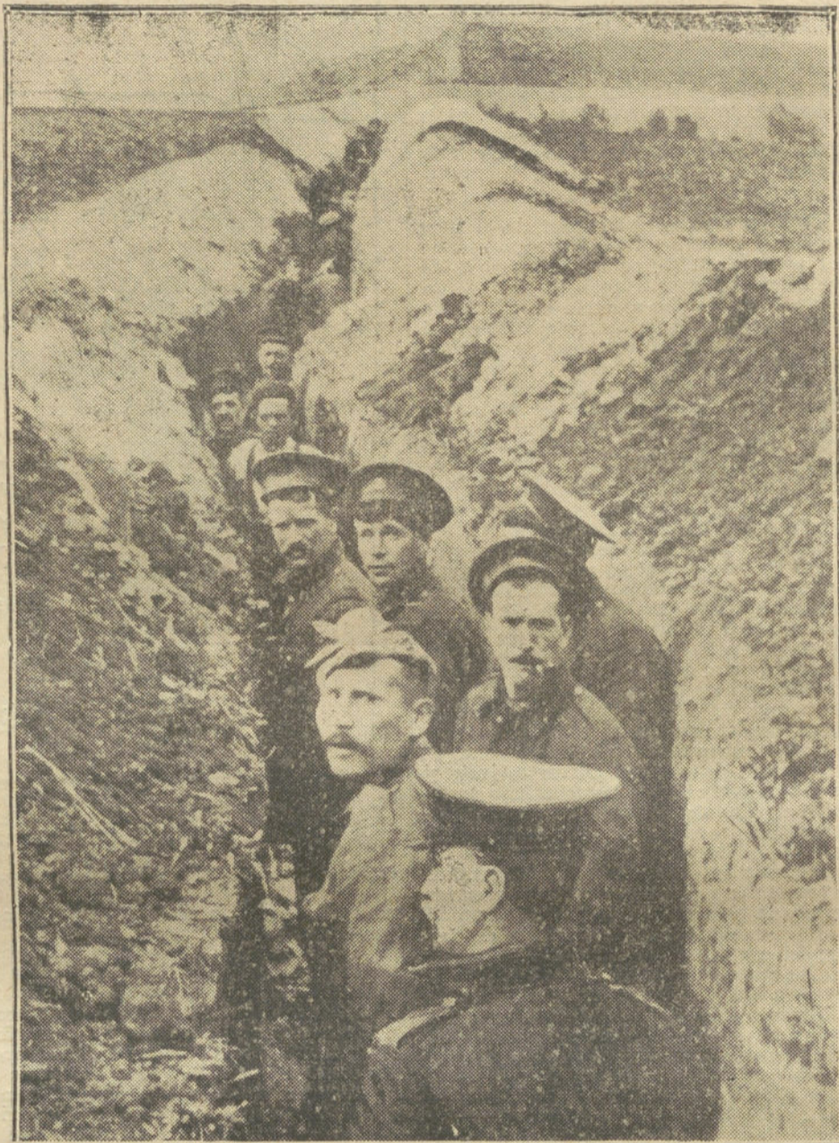
LOS INGLESES EN LA GUERRA.—Una trinchera de tropas inglesas en la costa belga.

Desgraciadamente, los libros de Historia, por su esterilidad moral, no valen el trabajo que costó escribirlos. Las naciones carecen de experiencia; una vez y otra, en el interminable filar de los siglos, las vemos seguir los mismos derroteros fatales, estrellarse contra los mismos obstáculos, caer en las mismas celadas. El hombre se guarda siempre del hombre que, en una ocasión le hizo daño. Los pueblos, no. Repasad los cronicones de las ciudades grandes y pequeñas: todas las naciones han sido sucesivamente enemigas y aliadas, todas las viejas murallas padecieron la acometida de todos los ejércitos. Rusia y el Japón, por ejemplo, que recientemente se destrozaron en Puerto Arturo, ahora luchan juntas; Inglaterra y Prusia que, personificadas en Wellington y Blücher, se