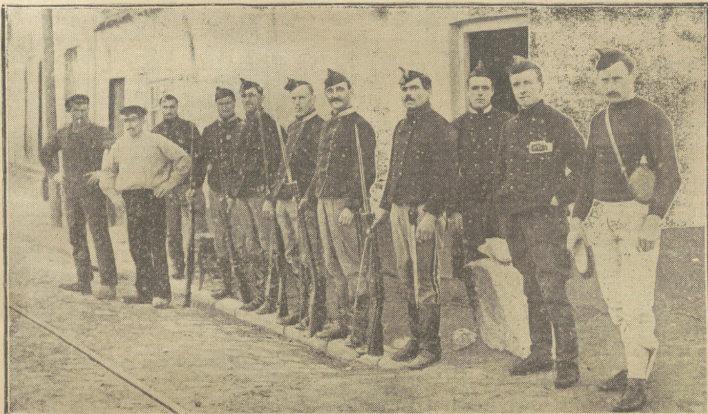
LA GUERRA EUROPEA.—Grupo de soldados belgas fugitivos de Ostende refugiados en una localidad del Norte de Francia.