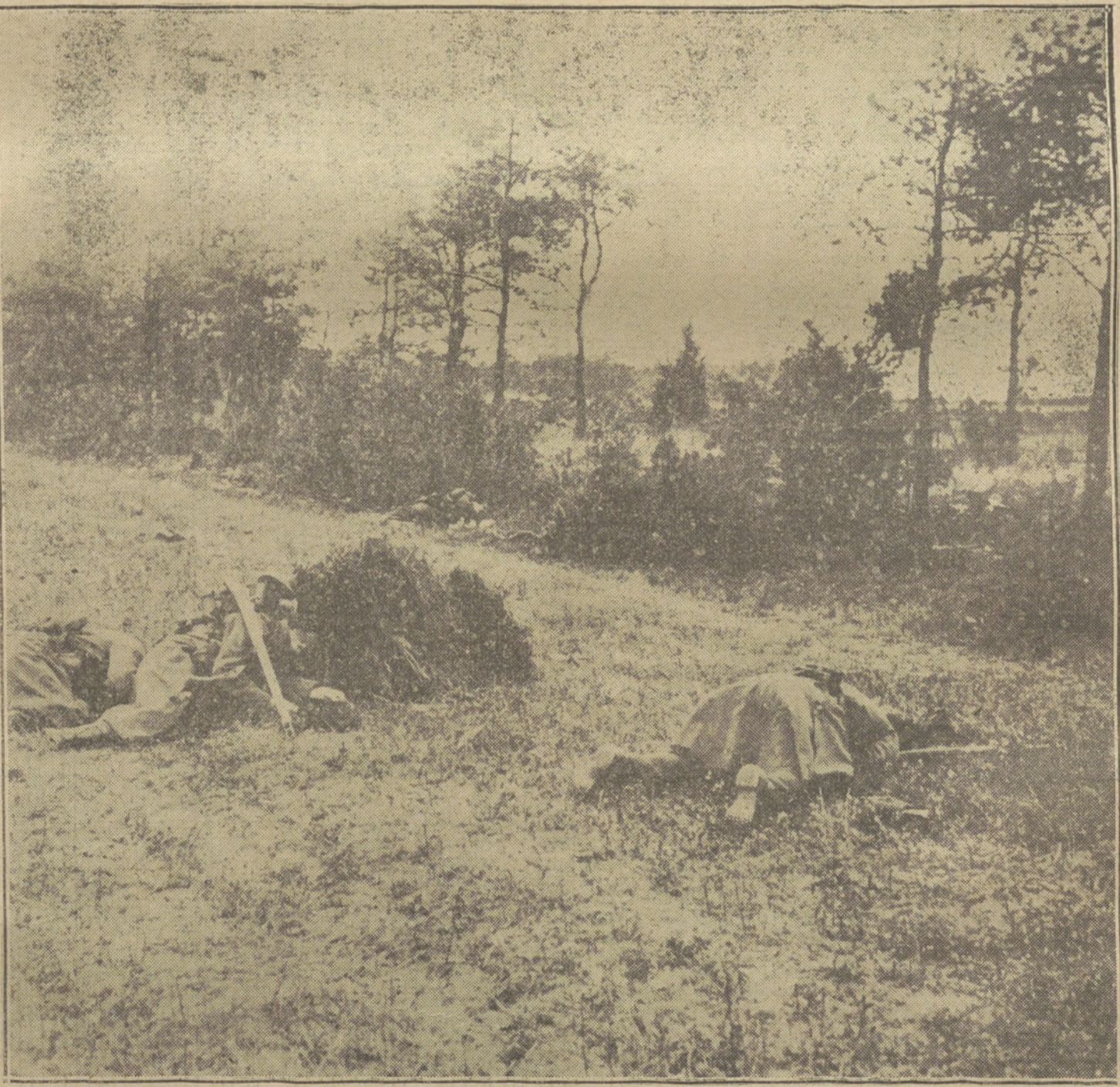
DESPUES DEL COMBATE.—Soldados franceses y alemanes muertos en el campo de batalla, después de un formidable encuentro. (Fot. NEWSPAPER).