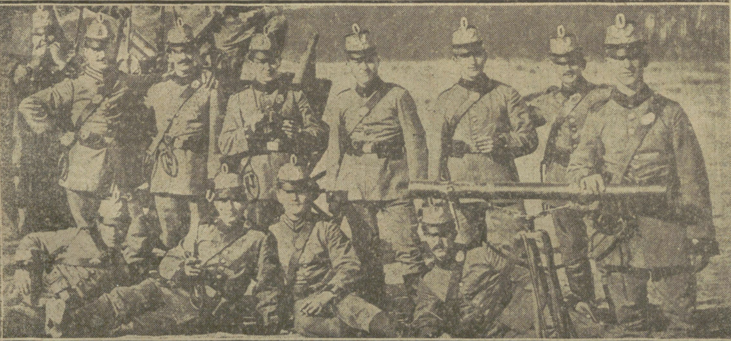
LA GUERRA EN BELGICA.—Destacamento de fuerzas bávaras que luchó heroicamente con fuerzas del regimiento inglés London-Scottish, en cuyo encuentro perecieron casi todos los combatientes.

LA TAREA DE LEVOLTAR TODOS LOS TRABAJOS QUE NO PUBLICAMOS SERIA ABRUMADORA, Y PARA EVITARLA, COMO PARA PREVENIR RECLAMACIONES, QUE RESULTARIA IMPOSIBLE ATENDER, RECORDAMOS QUE NO SE DEVUELVEN LOS ORIGINALES.