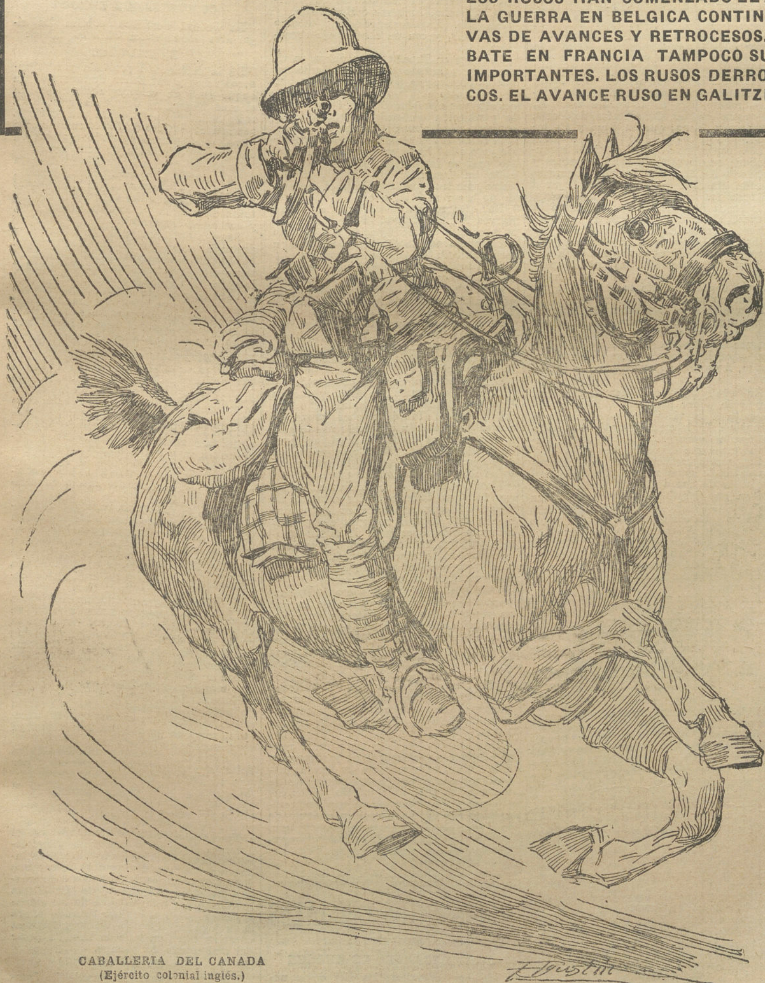
CABALLERIA DEL CANADA (Ejército colonial inglés.)

LOS RUSOS HAN COMENZADO EL ASEDIO A CRACOVIA. LA GUERRA EN BELGICA CONTINUA CON ALTERNATIVAS DE AVANCES Y RETROCESOS. LA LINEA DE COMBATE EN FRANCIA TAMPOCO SUFRE ALTERACIONES IMPORTANTES. LOS RUSOS DERROTADOS POR LOS TURCOS. EL AVANCE RUSO EN GALITZIA. DESDE ESPAÑA