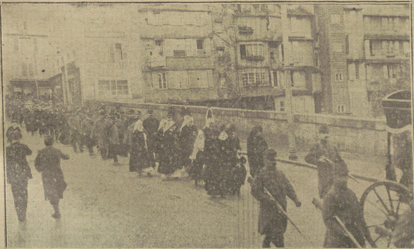
LAS VICTIMAS DE LA GUERRA.—Entierro de un soldado francés muerto en el hospital de Pau. La comitiva fúnebre, que presiden la familia del muerto y las damas de la Cruz Roja, desfilando por las calles de Pau.

DEDIQUESE USTED DURANTE EL DIA AL TRABAJO Y LEA DESPUES PARA SU DISTRACCION «LA TRIBUNA», EL PERIODICO GRAFICO MAS AMENO Y MEJOR INFORMADO.