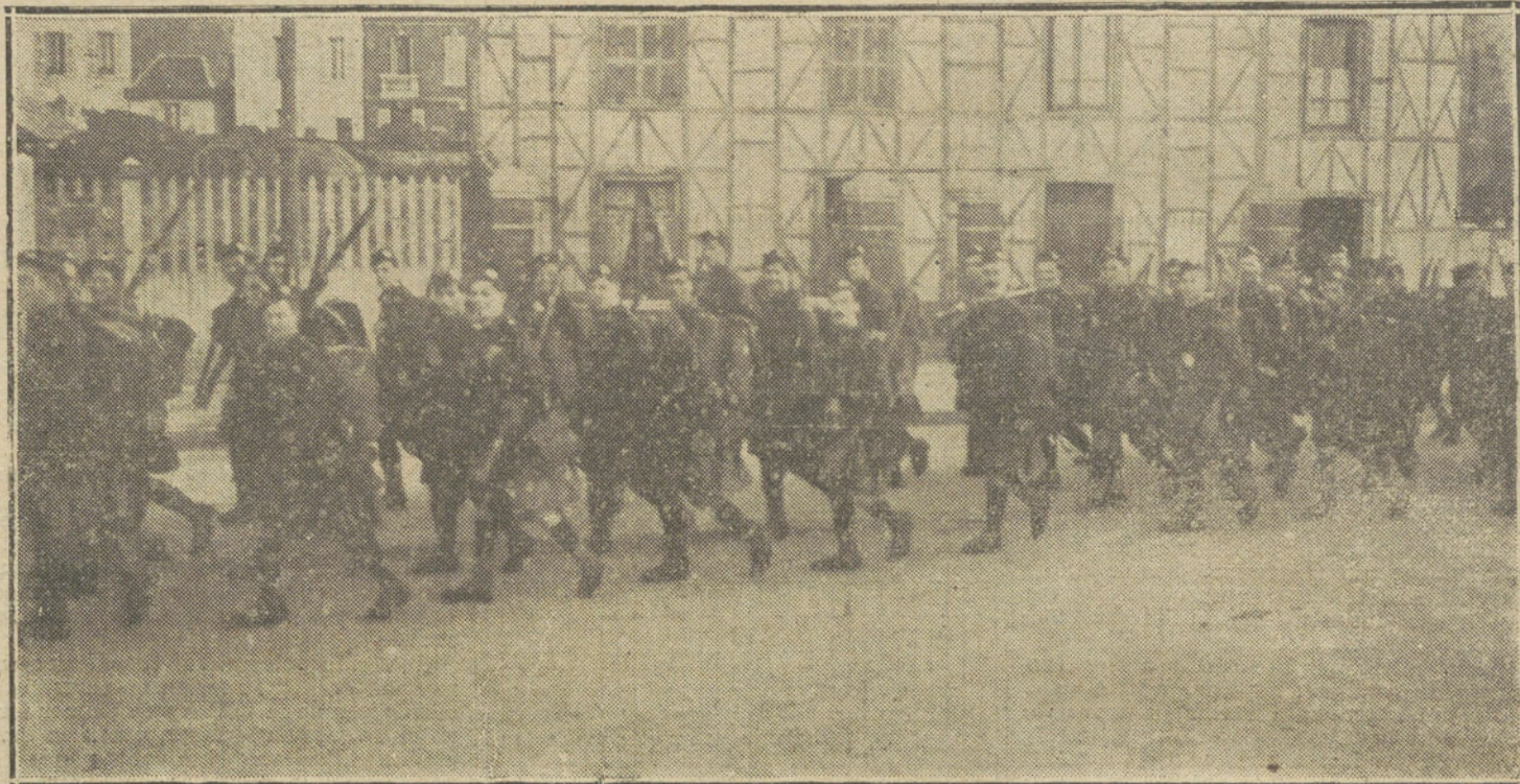
LA GUERRA EN FRANCIA.—Llegada a El Havre de una expedición de tropas inglesas.

A nosotros, francamente, esa desdeñosa actitud de nuestra Embajada no nos ha cogido de susto; de antiguo, y por personal experiencia, conocemos la costumbre que los encargados de velar en el extranjero por nuestros intereses tienen de encogerse de hombros. Los periódicos debían ocuparse de esto. Yo estoy cierto de que los súbditos de la más insignificante República americana se hallan mejor defendidos por sus embajadores y sus cónsules que nosotros lo estamos por los nuestros. Hablo de París. Al español que