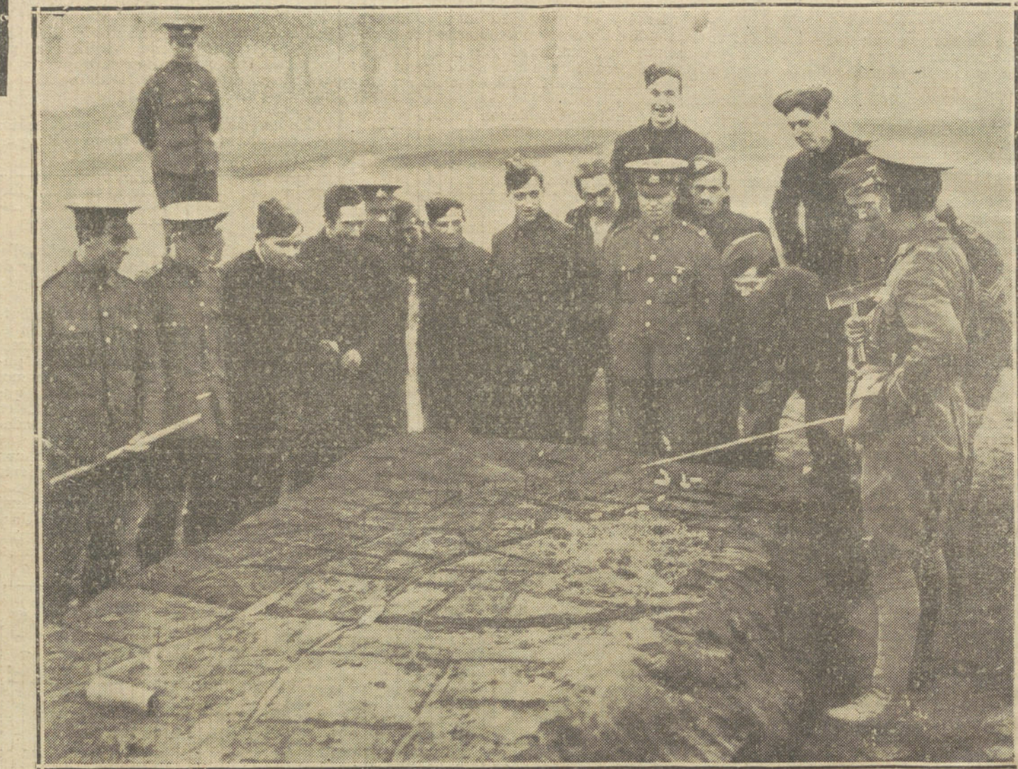
LA GUERRA DESDE LONDRES.—Los nuevos reclutas ingleses, estudiando la marcha de las operaciones sobre un croquis del campo de batalla.

—Pero confiese, querido Max—le digo—, que no sólo por el gusto de esta pequeña broma de saludar a los ingleses