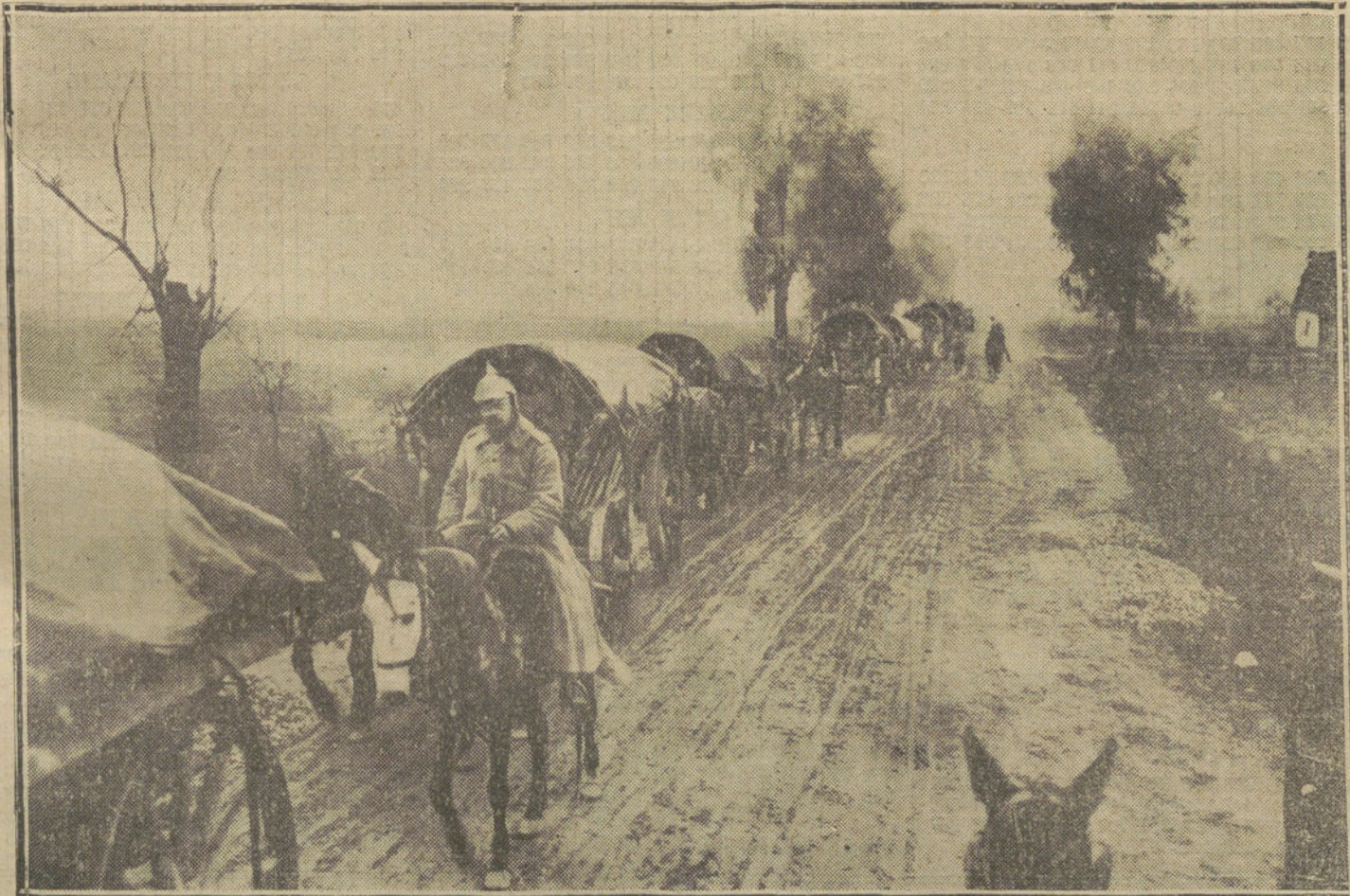
LA GUERRA EN ORIENTE.—Una columna alemana regresando de la línea de fuego por una carretera de la Polonia rusa.

La velocidad inicial, en plena carga del de 28, es de 355 metros por segundo, mientras que un cañón moderno de este calibre pesaría cuatro toneladas y desarrollaría una velocidad de 900 metros por segundo.