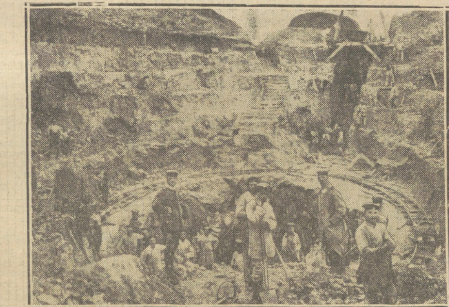
LA BATALLA DEL AISNE.—Tropas alemanas construyendo defensas en la línea de fuego.

El cura se encontró a Don Quijote bajado del lecho, pero sin salir de su alcoba, y se encontró con que ante la tamaña aventura que el hidalgo veía, agitaba y vibraba su espíritu entero; y entonces habló él, como persona que era de más calidad que el barbero que le acompañaba, aunque de bonísima gana hubiera intervenido el rapabarras, ya que es sabido cuán aficionados a rajar fueron los de su oficio, en todos los tiempos. Y habló el cura, repetimos, quien, en este caso, habló en mentiroso y en hipócrita, pues en lugar de decir «atienda vuestra merced a su salud» lisa y llanamente, añadió un «por ahora», y dijo esto tras