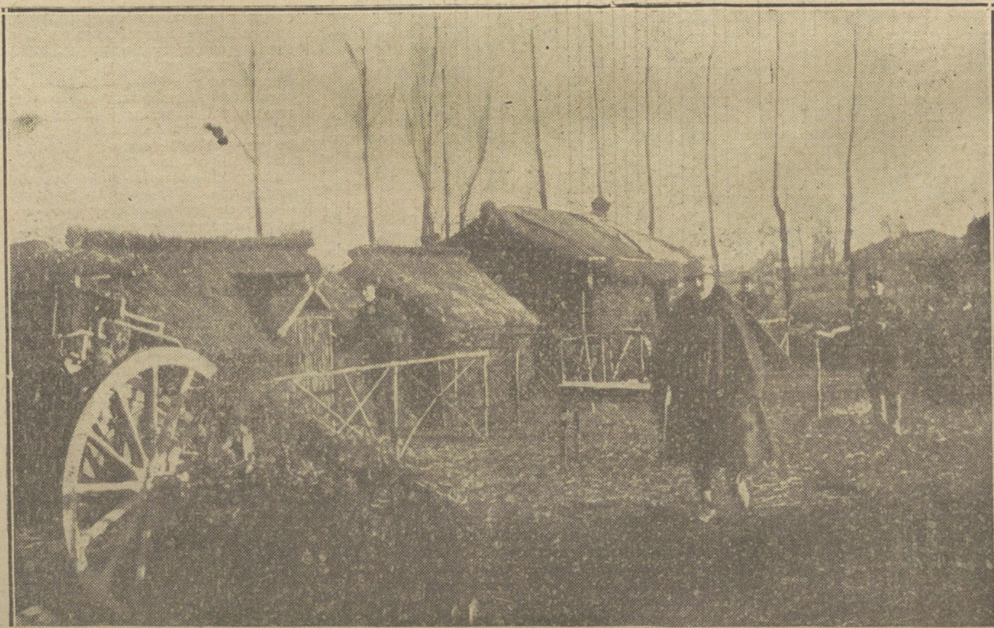
LA GUERRA EN FRANCIA.—Habitaciones construidas por los soldados franceses en un campamento de la línea del Aisne.

4.ª El Gobierno francés, por decreto del 13 Agosto 1914, ha embargado mercancías alemanas que, como productos de entrada y de paso por el país no habían entrado todavía en el libre tráfico, para venderlos a favor del Tesoro del Estado. La misma medida, según comunicación de casas alemanas, ha sido adoptada por la Aduana inglesa. Como contramedida, el Consejo Federal ha publicado un decreto, según el cual las mercancías francesas a