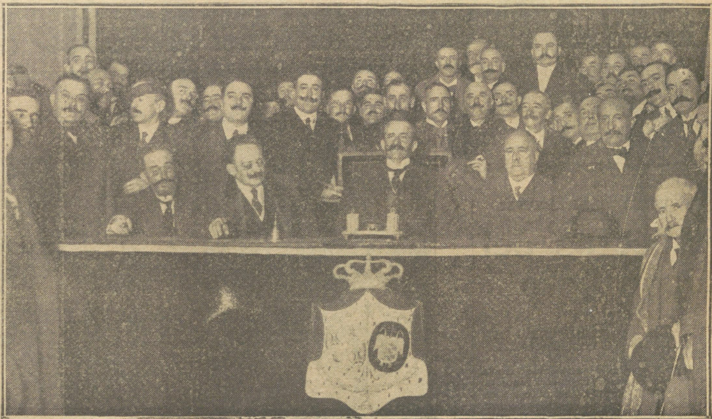
EL II CONGRESO DE SANIDAD CIVIL.—Sesión de clausura, verificada ayer tarde bajo la presidencia del conde de Romanones.

Barcelona se despuebla; la epidemia, en vez de ceder, aumenta, y el vecindario esperando medidas prácticas y eficaces de