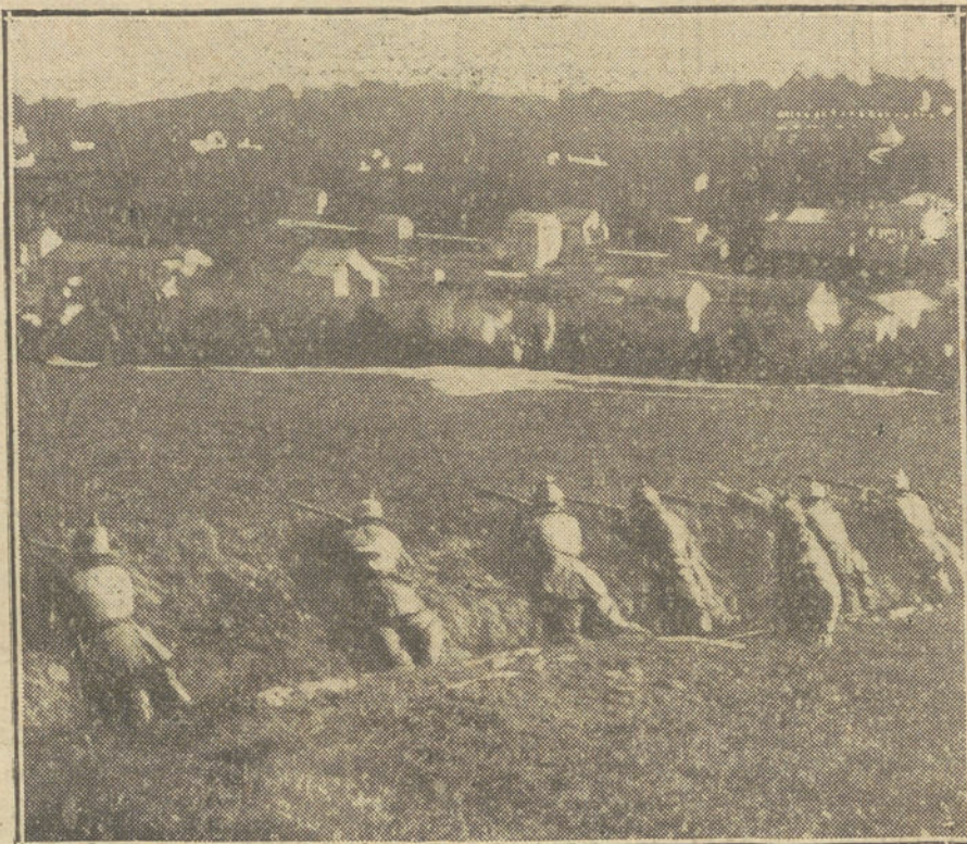
LA GUERRA EN BELGICA.—Soldados alemanes haciendo fuego desde una trinchera, en las cercanías de un poblado.

Este pueblo, que diariamente lee en los periódicos comunicados oficiales, lacónicos, vagos, incomprensibles, que dicen siempre lo mismo, en términos más ó menos técnicos, se entrega al escepticismo, a la indiferencia y no llega a realizar nunca la gravedad del momento. El censor está haciendo imposible la labor del periodista leal y patriota, que con su esfuerzo personal trata de cooperar al éxito de la guerra, que no duda en señalar los errores para que los corrijan