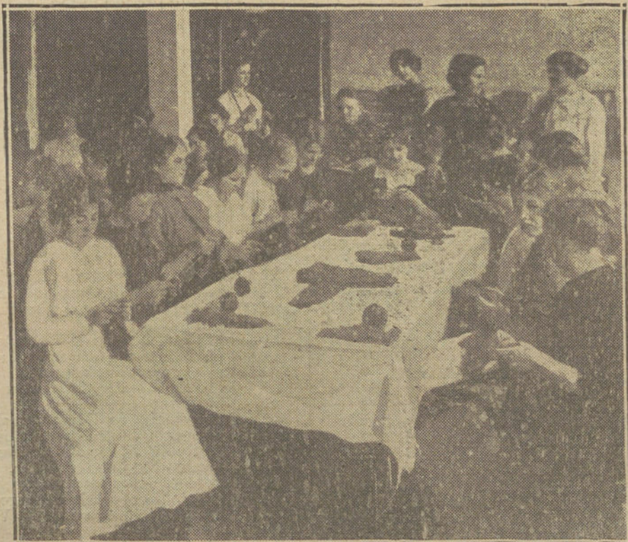
LA GUERRA EUROPEA.—Mujeres hamburguesas haciendo calcetines con destino a los soldados alemanes que hay en la guerra.

Nosotros tendríamos que ser ciegos para no comprender que seríamos los primeros en sufrir las consecuencias, porque no somos tampoco tan tontos para creer que los rusos pasarían por Viena para ir a Constantinopla.»