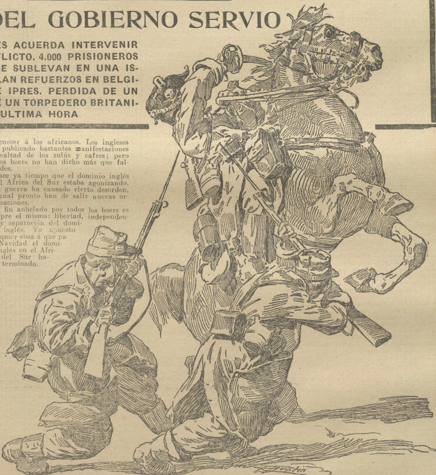
CUERPO A CUERPO

El fin anhelado por todos los boers es siempre el mismo: libertad, independencia y separación del dominio inglés. Yo apuesto cualquier cosa a que para Navidad el dominio inglés en el África del Sur habrá terminado.