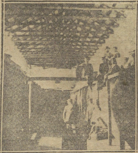
Bodega de D. BENIGNO ESCRIBANO, en Camuñas.

En esta bodega de Camuñas han implantado varias reformas, á título de ensayo, para nuevas edificaciones que llevarán á cabo en plazo breve, por no ser suficientes las quinientas mil arrobas de vino que elaboran á servir su mercado; nos referimos á la construcción de pozos de fermentación y á la sustitución de las antiguas tinajas de barro por los modernos conos de cemento armado.