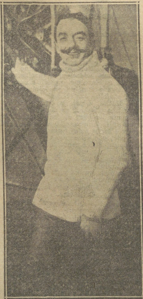
El famoso aviador francés PEGOUD, que está prestando grandes servicios en campaña.

ROMA. De Amsterdam escriben que algunos oficiales alemanes que, bajo palabra de honor, estaban prisioneros en