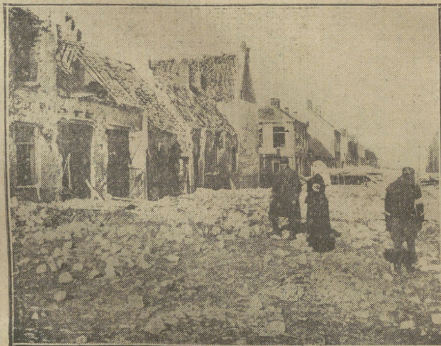
DESPUES DEL COMBATE.—Sanitarios franceses recorriendo una aldea de Nieuport, después de un violento combate.

Tampoco el té ha escapado al genio del gran economista. El té tiene más consumo que la cerveza y es otro de los vicios que se han impuesto al pueblo británico, y que a fuer de uso se ha constituido en fantasía nacional. El té no es sino una fantasía, es una forma muy elegante de entretener la amistad y el hambre de un pueblo; el té es hoy una lección más con que debe complementar su educación la mujer inglesa, aristocrática ó plebeya, educada ó analfabeta. El té, sus preparativos, las sensaciones que