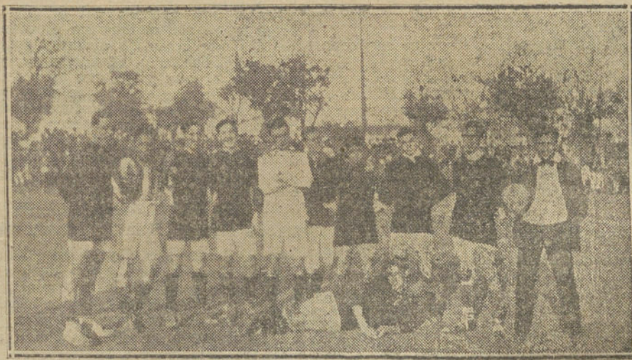
EL FOOT-BALL EN SEVILLA.—El primer equipo del «Balompié», que el pasado venció al «Español», por seis «goals» contra cero.

El señor AZCARATE interviene, combatiendo el que los créditos destinados a pago de obligaciones de ejercicios de-