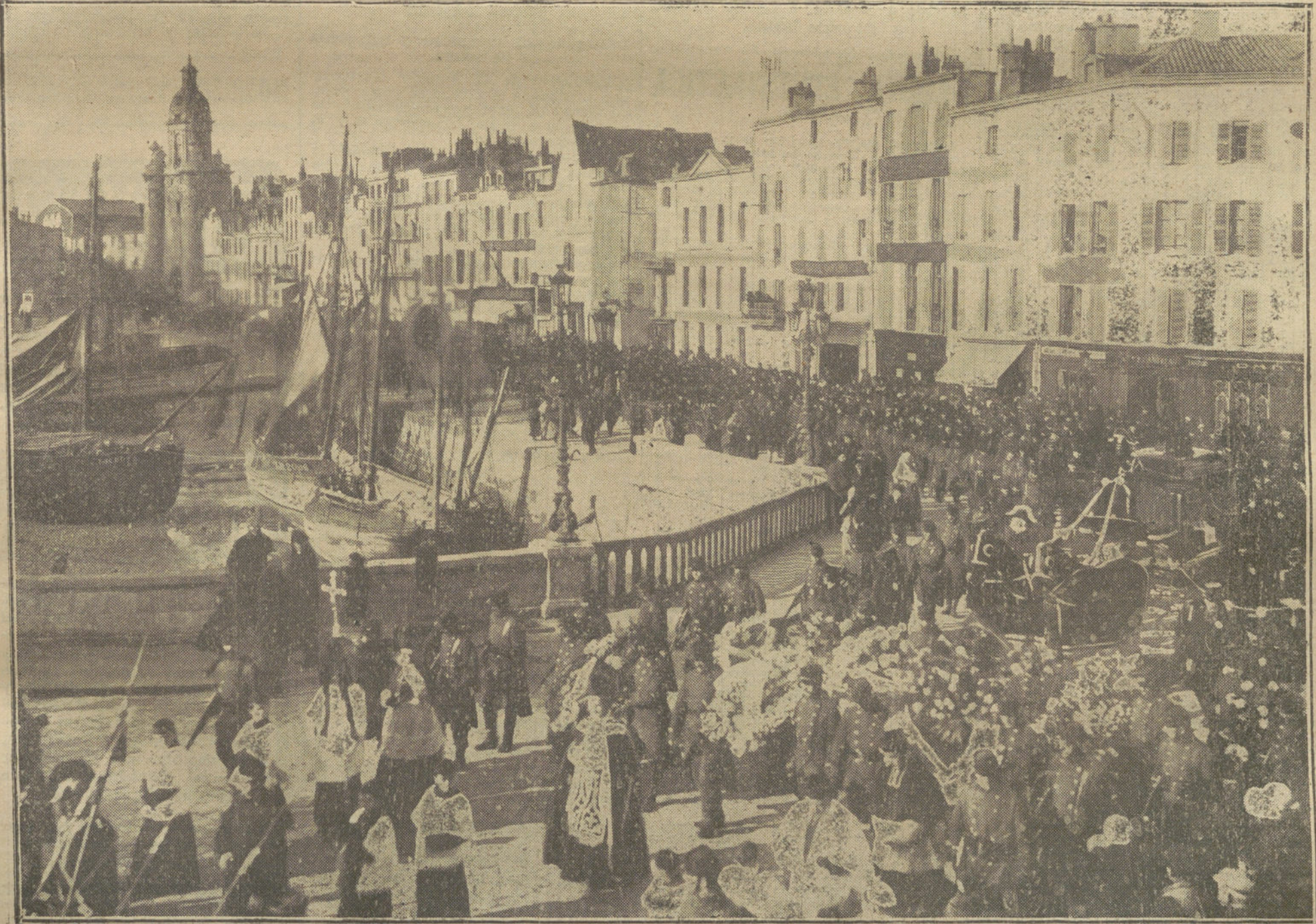
LA GUERRA DESDE BURDEOS.—El solemne entierro del general Durant, muerto á consecuencia de las heridas recibidas en el campo de batalla.

A pesar de que Persia no dispone de grandes fuerzas militares, no se debe olvidar que allí viven ocho tribus muy bien armadas y disciplinadas.