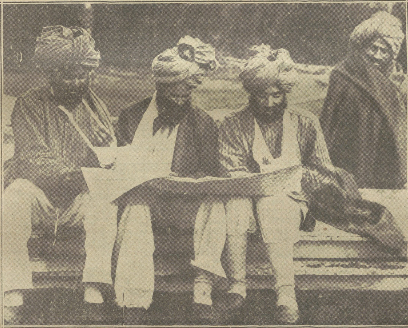
Heridos indios en un hospital provisional de New Forest (Inglaterra) leyendo las últimas noticias de la campaña.

Hasta ahora la industria inglesa ha producido, en total: dos millones de calcetines, un millón de pares de botas, un millón de camisas, 500.000 gorras, y de pantalones y guerreras mucho menos aún.