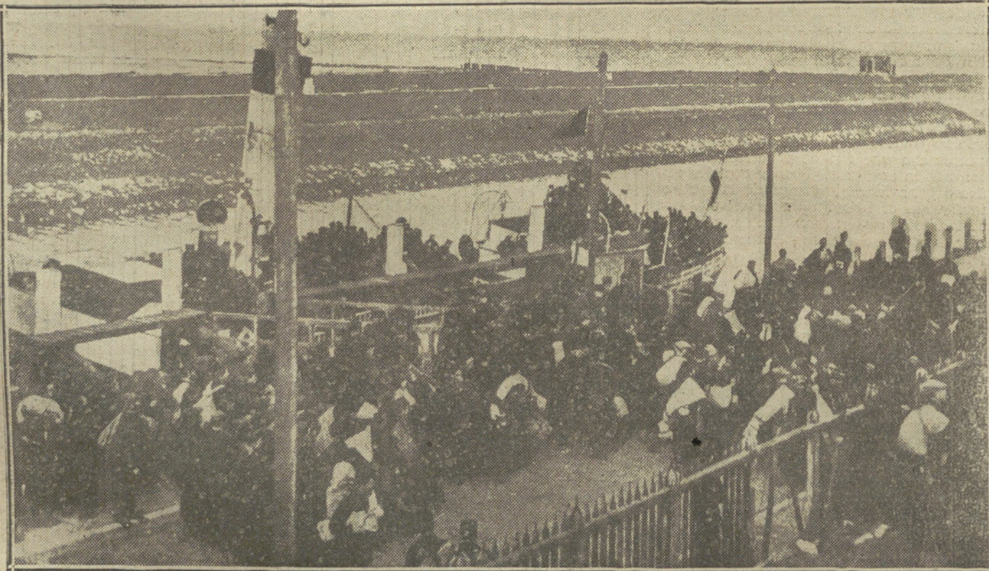
Fugitivos belgas embarcando en el puerto holandés de Flassinga, para trasladarse á Londres.