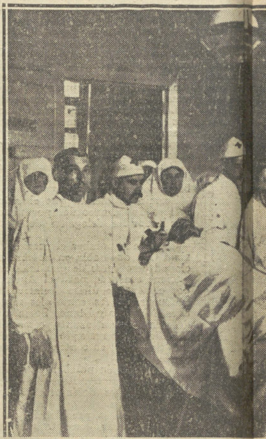
LA CARIDAD Y LA GUERRA.—La Zarina (1) y su quesa Tatiana (3), en un hospital ruso, asistiendo á.

NUMERO DEL TELEFONO DE LA REDACCION, ADMINISTRACION Y TALLERES DE «LA TRIBUNA»: 4.444.