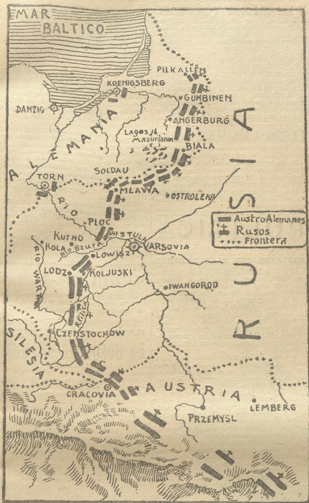
Situación de los Ejércitos en Oriente.