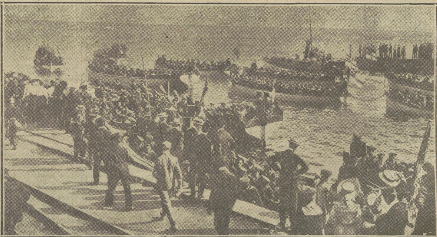
Marinos alemanes embarcando en el puerto de Kiel, para completar las dotaciones de la escuadra que hay en dicho canal.

Termina diciendo que todas las ofertas de mediación, todas las tentativas que se hagan para poner fin a las hostilidades, serán vanas e inútiles, mientras no esté vencido el Imperio germanico.