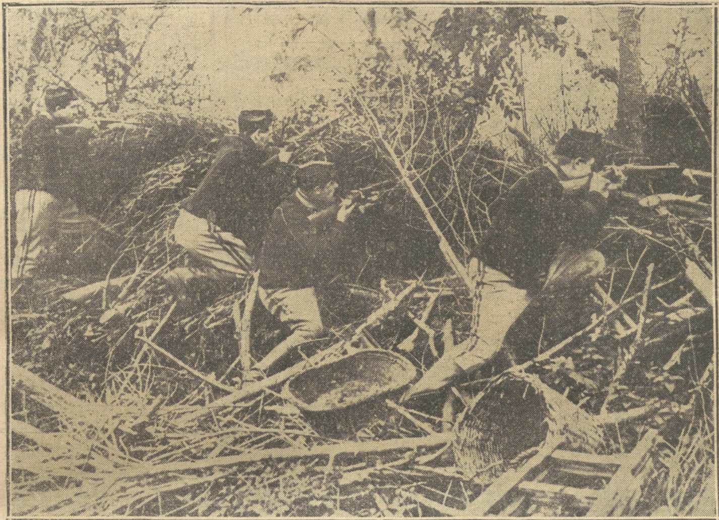
LA GUERRA EN BELGICA.—Soldados belgas defendiendo una trinchera en la región de las dunas.

—¡Ah!—decimos los de mi tren.—Esos deben ser los cañones de 52 centímetros. También nos pasó un tren muy largo, transportando piezas sueltas de los «zepelines» y de los hangares que se van a construir en Lieja, Amberes y Maubeuge.