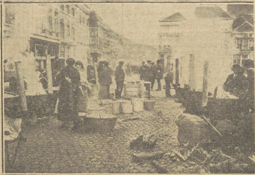
LOS FUGITIVOS DE BELGICA.—Cocinas públicas establecidas por la Cruz Roja en las calles de Flessinga, para socorrer a los fugitivos de Bélgica.

En este último caso, el Estado Mayor alemán pondría en ejecución el plan ob-