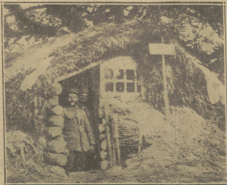
LA GUERRA EN FRANCIA.—Casa construida con troncos y sarmientos en un campamento alemán de la Argona.

Los socialistas belgas han comunicado esta noticia a los socialistas de otras naciones.