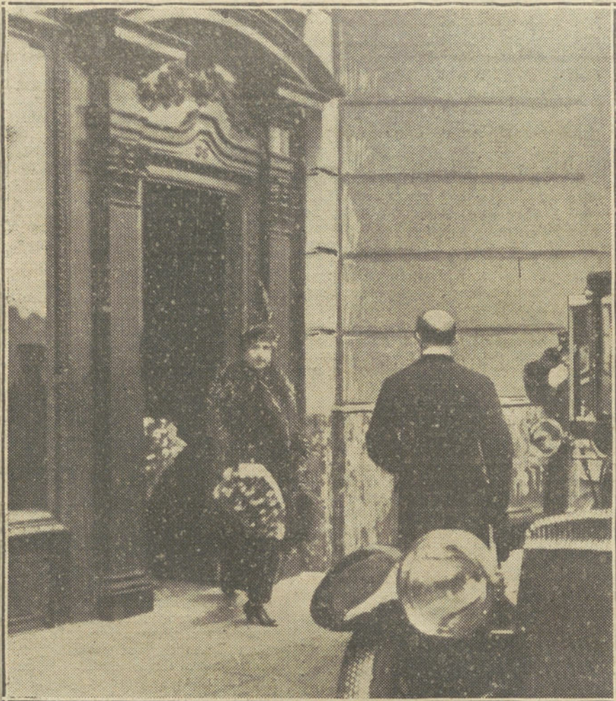
S. M. la Reina saliendo de inaugurar una Exposición de muebles en la Carrera de San Jerónimo.