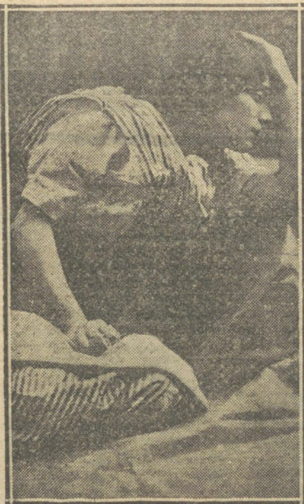
RAQUEL MELLER, que debutó anoche con gran éxito en el teatro Romea.