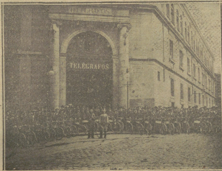
La nueva sección destinada al reparto de correspondencia telegráfica, compuesta de 25 ciclistas, perfectamente equipados.

El actual jefe del Centro de Madrid reorganizó el servicio telegráfico de Barcelona en forma tal, que la comunicación de Madrid con aquella capital es la suma perfección. Poco tiempo hace que dicho jefe se encargó de reorganizar desde Madrid el servicio de toda España, poniendo en práctica los mismos procedimientos que en Barcelona han dado el resultado excelente de que también Madrid disfrutará en breve, y que el público observará en su propio beneficio.