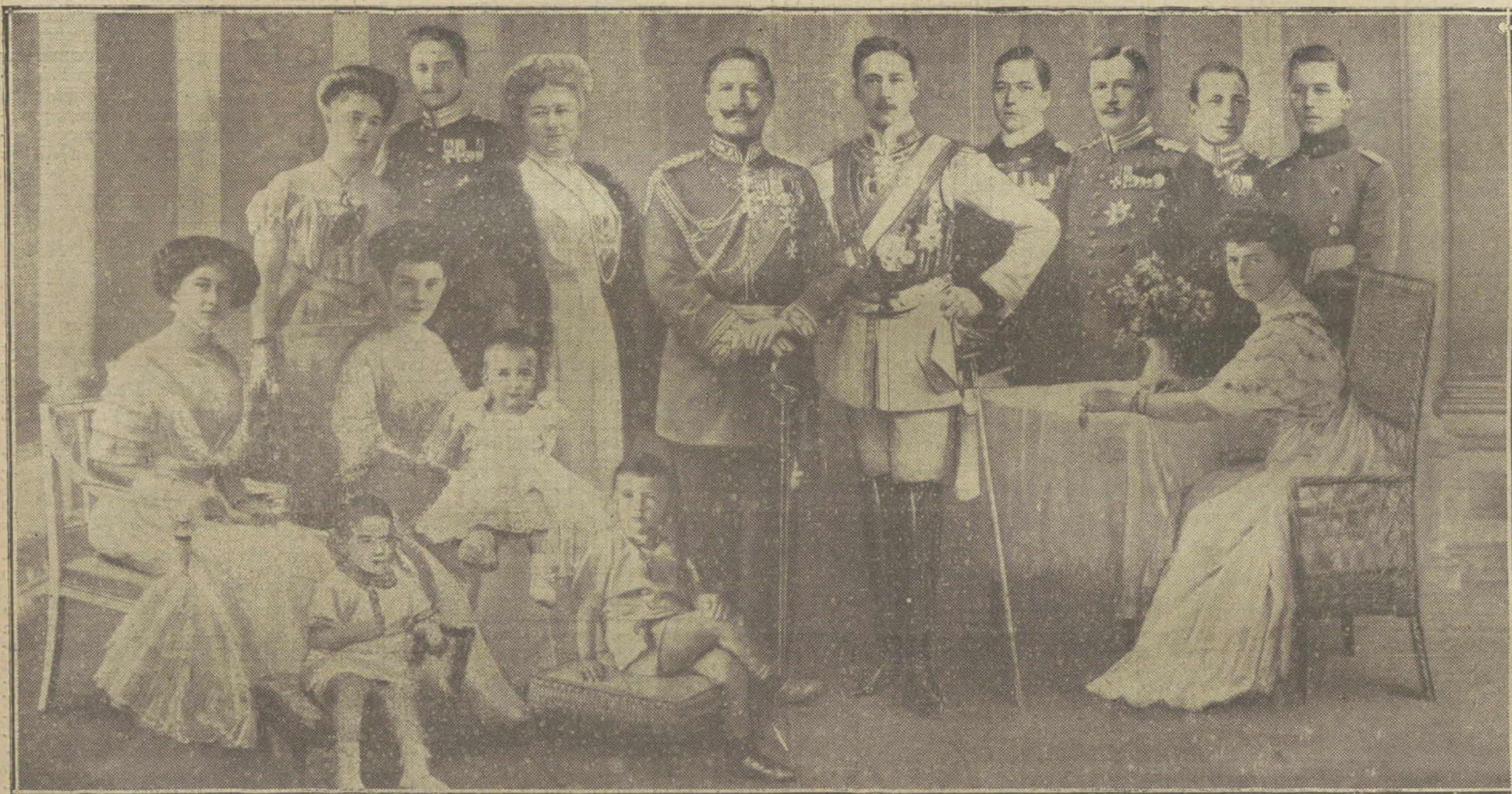
El Emperador de Alemania con toda su familia.

VARIOS FUSILAMIENTOS.—LOS SOLDADOS INGLESSES.—LA ACTITUD DE GRECIA.—LA SITUACION EN BELGICA.—LOS RUSOS ELOGIAN EL VALOR DE LAS TROPAS ALEMANAS.—LOS AUSTRIACOS EN LA GUERRA