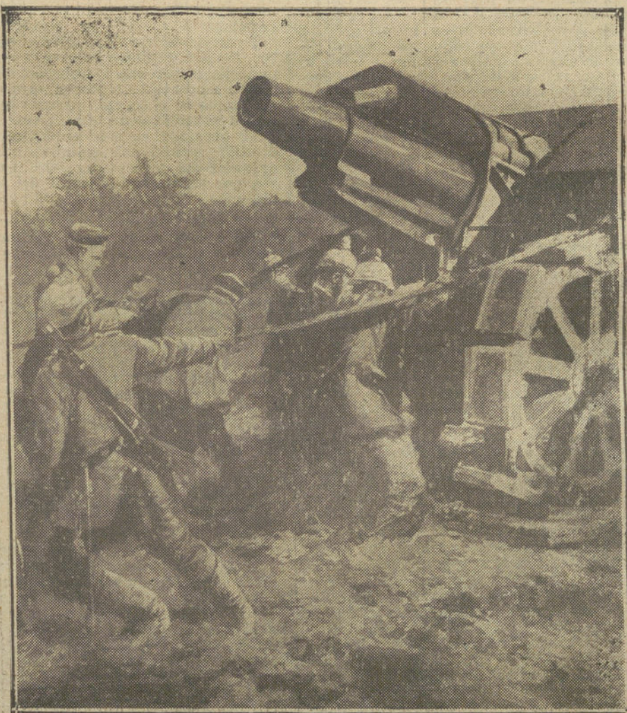
LA GUERRA EN BELGICA. —Soldados alemanes trasladando uno de los famosos morteros austriacos de 21 centímetros.

NUMERO DEL TELEFONO DE LA REDACCION, ADMINISTRACION Y TALLERES DE «LA TRIBUNA»: 4.444.