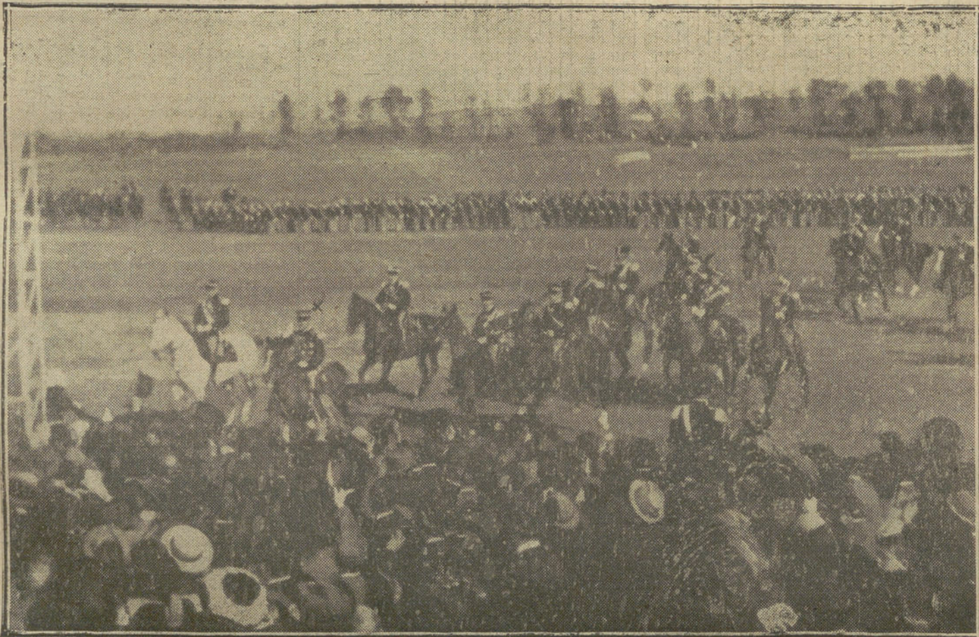
LA MOVILIZACION ITALIANA.—S. M. el Rey de Italia (X) revistando en el campo militar de Roma las tropas que han marchado a la frontera austriaca.

ro si supiese la verdad, sería inútil que tratase de disuadirme: la mujer francesa ha despedido a su marido, diciéndole: «Si los alemanes entran en París, no me encontrarás a tu regreso: procura que no entren.» Y yo, española de nacimiento, más romántica o más apasionada, despedí a mi marido, diciéndole: «Hasta la vista», y a eso voy, a verlo.