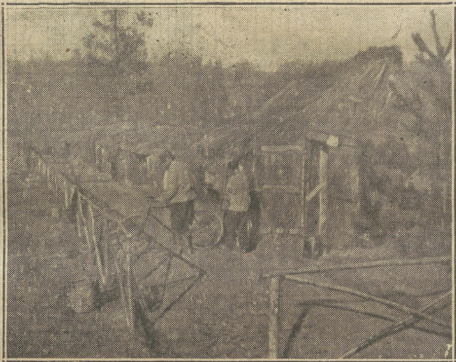
LA VIDA EN CAMPAÑA.—Una calle en un campamento francés. Dicho campamento, situado en la línea del Aisne, es conocido con el nombre de «Villa de Bon Espoir», y está formado por casas construidas con sarmientos, perfectamente alineadas.

—Todo lo que sabe es que regreso a España en el expreso de esta noche; pe-