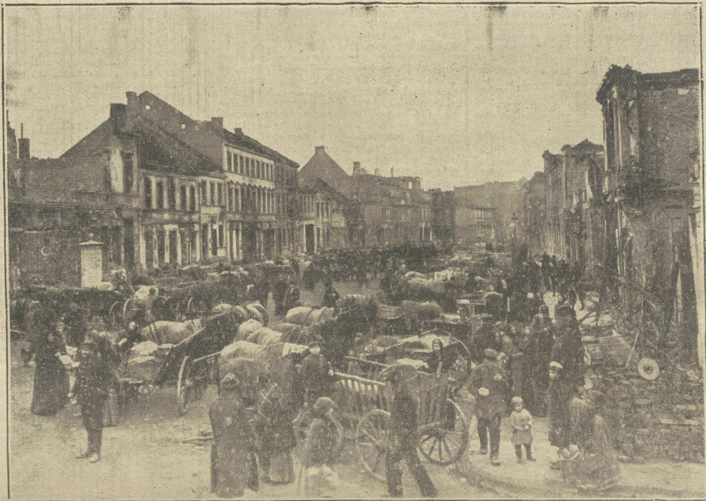
EN LA PRUSIA ORIENTAL.—Los fugitivos de Ortelsburg a su regreso a dicha ciudad, después de ser bombardeada por los rusos.

En el curso de la campaña, Alemania, luchando contra enemigos muchas veces