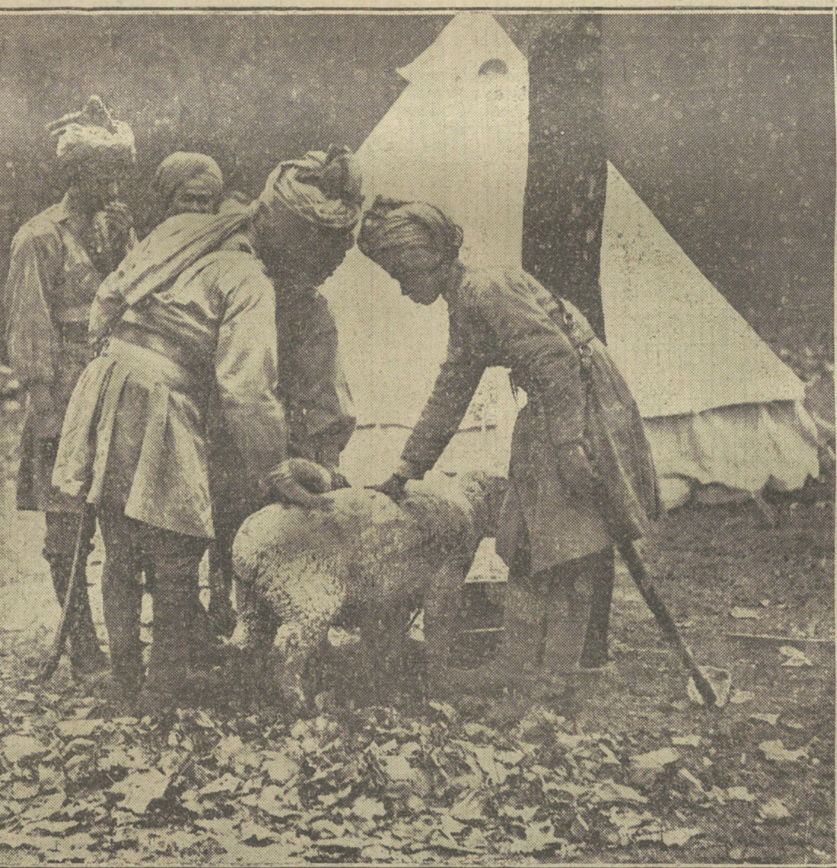
Soldados indios en un campamento.

«En la población de Breda fueron ayer internados siete oficiales belgas, desertores, que el día 5 de Noviembre habían sido condecorados por el Rey Alberto con la cruz de Leopoldo; ellos pertenecían al segundo regimiento de Infantería. Interrogados por compatriotas suyos por