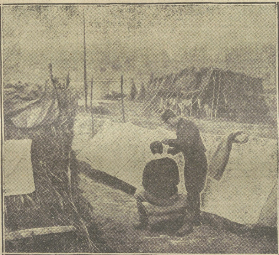
LA VIDA EN CAMPAÑA.—Un «salón de peluquería» en un campamento francés de la línea del Aisne.

de la dicha ciudad de Gibraltar, se ha convenido y concordado por este Tratado que se dará a la Corona de España la primera acción antes que a otros para redimirla.