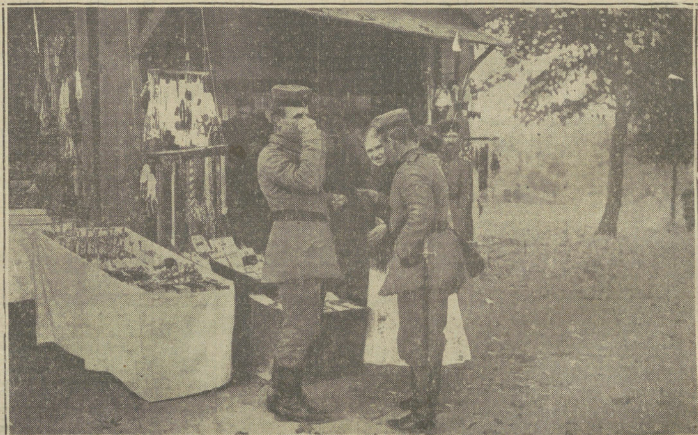
EN LA POLONIA RUSA.—Soldados alemanes en un pueblo de la Polonia rusa, comprando amuletos á la puerta de una li-brería religiosa.