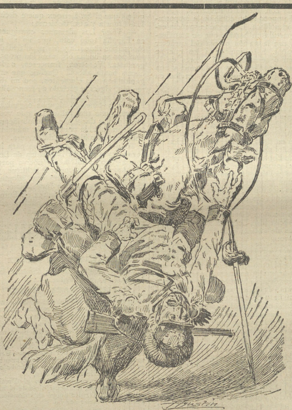
EFEITOS DE UNA GRANADA

Su actuación como diputado representante del pueblo del Transvaal ante un Gobierno responsable le ha granjeado la consideración y hasta la inclinación personal de sus adversarios políticos. A su lado está, indudablemente, en el Oeste del Transvaal, el general Kemp, que es conocido por todo el Sur de Africa como un hombre valeroso y un hábil director de hombres valientes. La influencia personal está bastante extendida en Sud Africa. Por eso no cabe duda alguna que hombres como De Wet, Beyers y Kemp