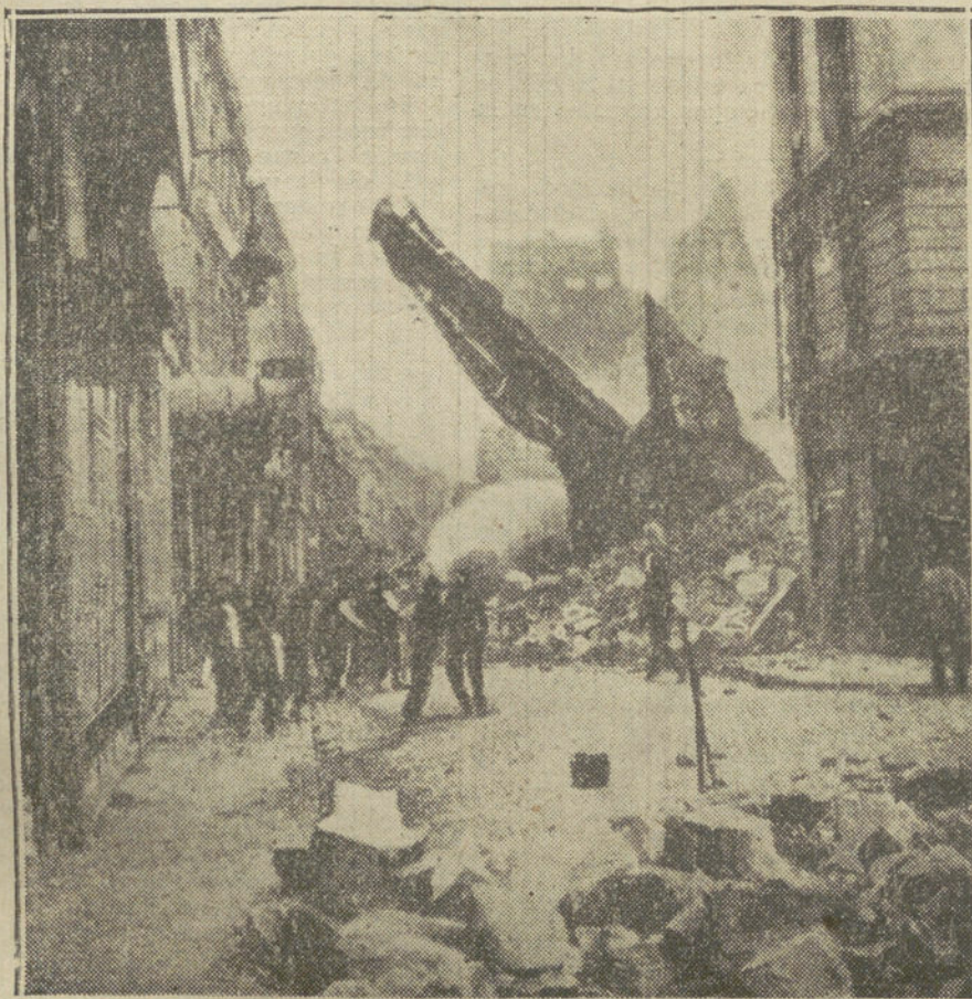
LAS CIUDADES DE LA GUERRA.—Momento de derrumbar los muros de una casa de Lille, destruida por el último bombardeo.

Los peor considerados son los españoles, a los que, como dice el citado corresponsal, Diego Angeli, «les costará caro algún día».