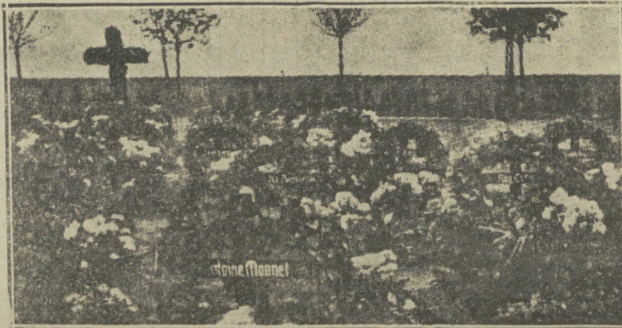
LAS VICTIMAS DE LA GUERRA. —Tumbas de soldados franceses enterrados por los alemanes en el cementerio de Karlsruhe. Los soldados germanos rinden a los cadáveres de sus enemigos los mismos honores que a los muertos alemanes, como puede apreciarse en la fotografía.

Estos últimos piden con insistencia ser alistados entre las tropas del califa, y muestran tanto entusiasmo religioso, que quisieran iniciar la guerra santa en el mismo campamento de Alemania.