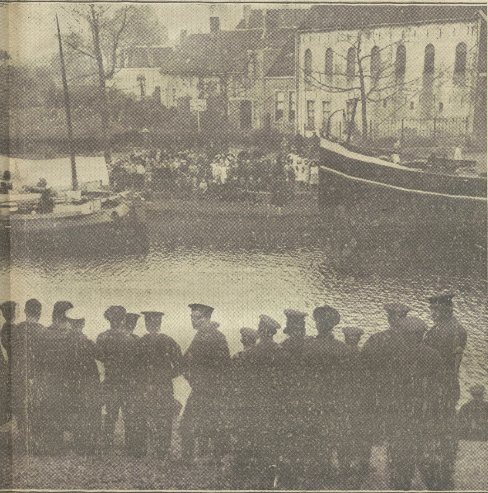
Alfios de las Escuelas del internado naval despidiendo á los marinos movilizados como consecuencia de la guerra.