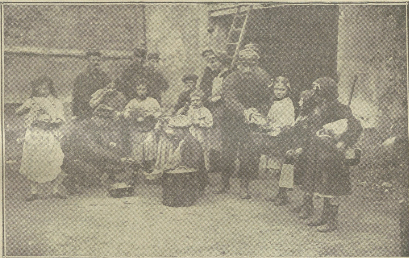
Soldados franceses en una localidad del Norte de Francia repartiendo el rancho a los niños fugitivos de Bélgica.

Después de haber dicho el artículo que Francia, con el odio de Inglaterra sobre