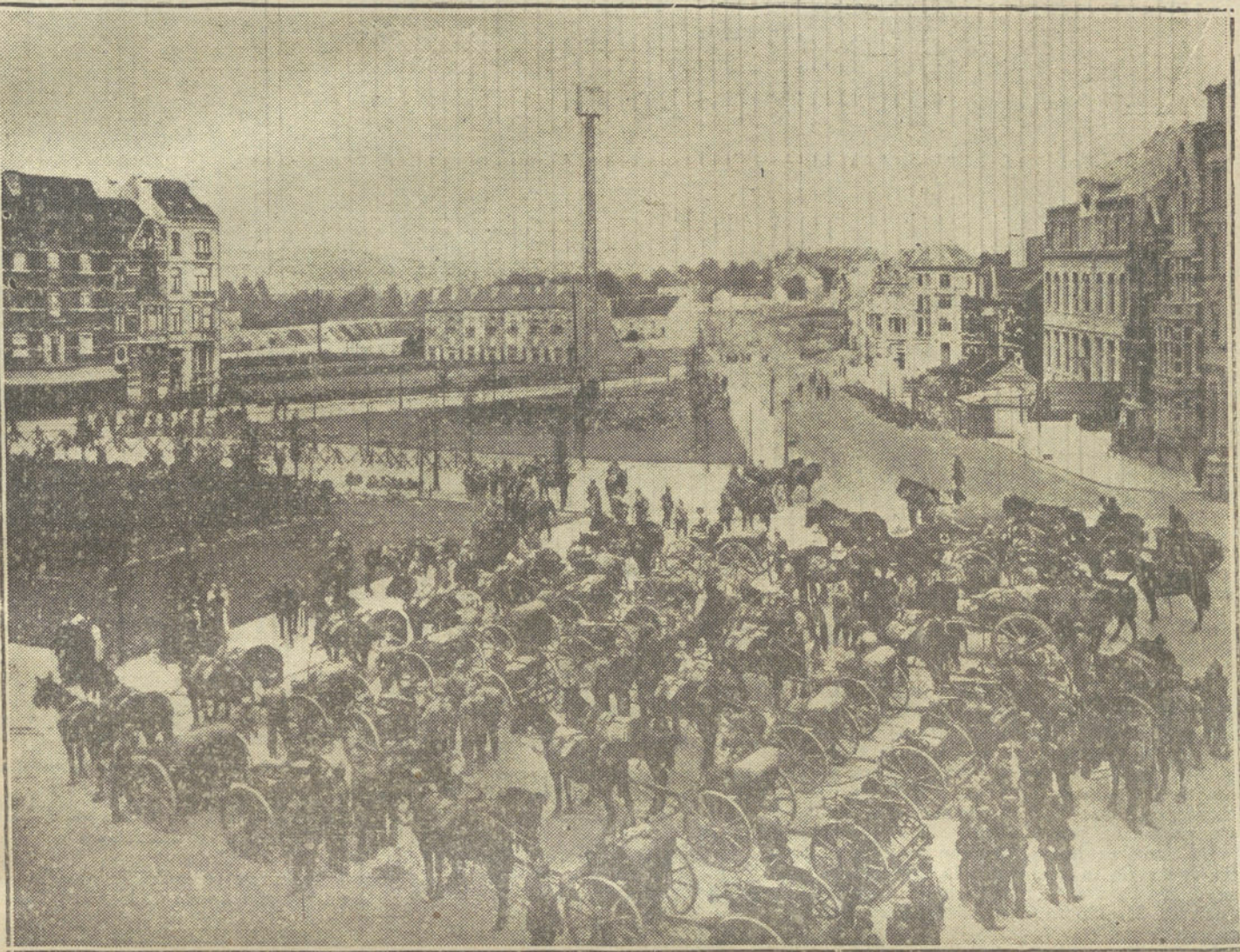
LA GUERRA EN BELGICA.—Cañones alemanes preparados en una plaza de Bruselas para marchar á la línea de fuego.

Varios otros prisioneros me habían contado que, antes de ingresar en el campamento de concentración, habían pasado diez días en la cárcel, entre ladrones y asesinos, y que mujeres alemanas habían tenido que estar en el mismo cuarto de la cárcel con prostitutas, sin tener ni tabladitos ni mantas, estando obligadas á dormir en el suelo de la celda.