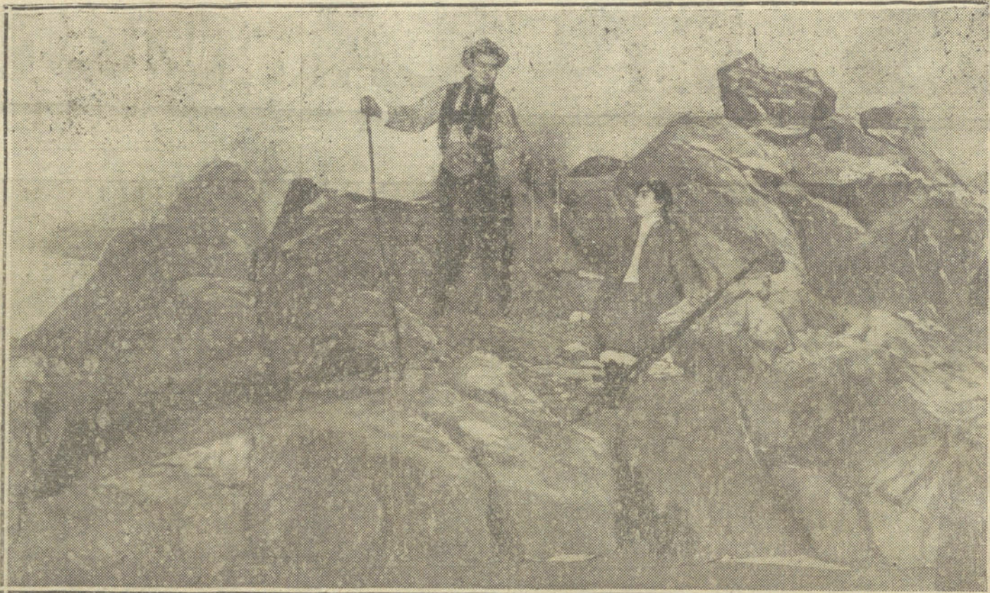
Una escena de la opereta «¡Al fin, solos!», estrenada anoche en el teatro de la Zarzuela.