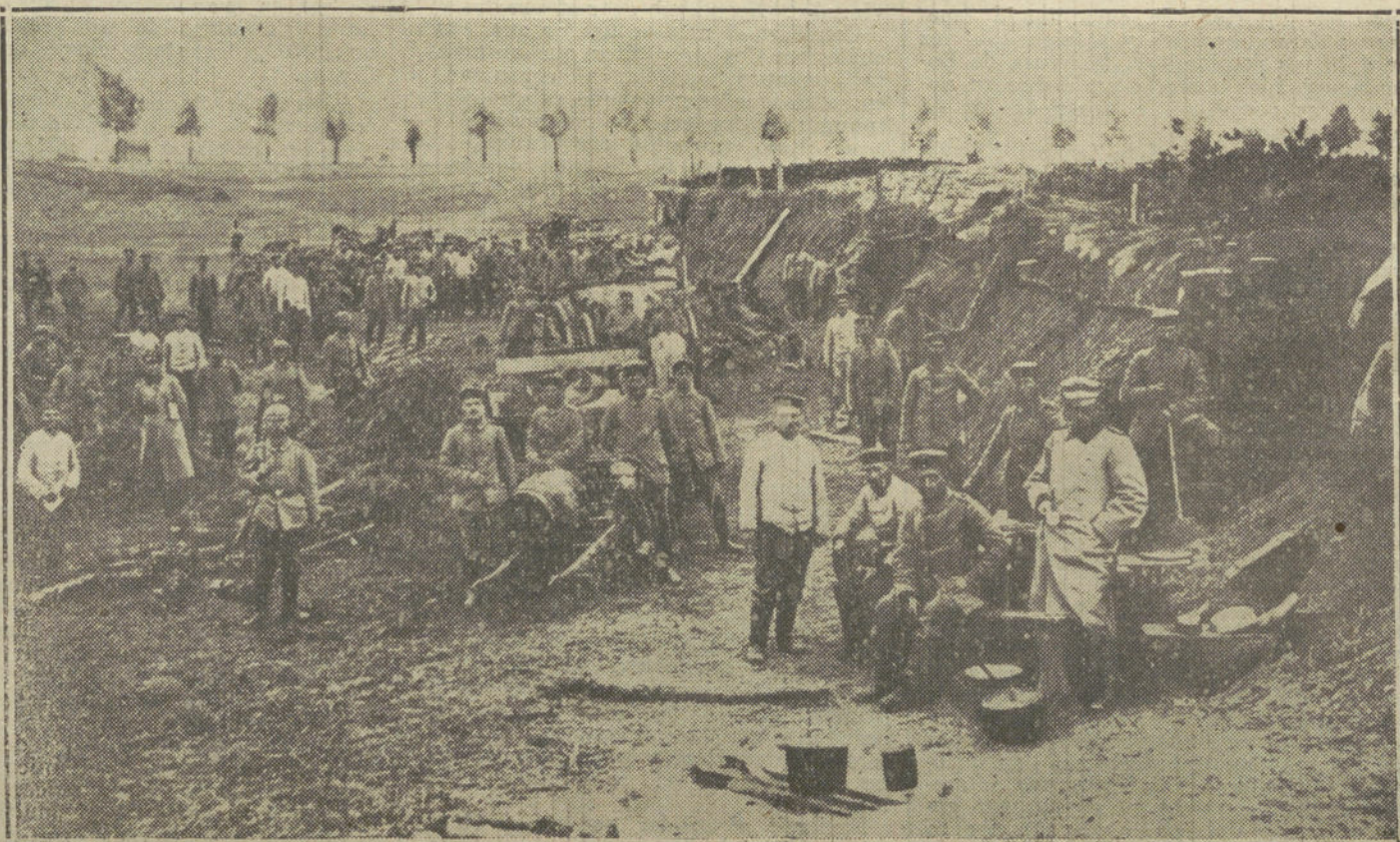
LA GUERRA EN FRANCIA.—Vista parcial de un campamento de soldados alemanes en la línea del Aisne. (Fot. A. GUS-VIDAL)

—En un combate librado en los alrededores de Troyon. Fué a los pocos días de llegar al frente, y apenas si puedo decir que yo he disparado. Era a la madrugada: mi sección estaba encargada de la custodia de cinco prisioneros alemanes, que habían llegado la noche anterior a Revigny. Todos los soldados estábamos muy alegres, divirtiéndonos con los «boches». Había uno que pedía un cigarrillo.