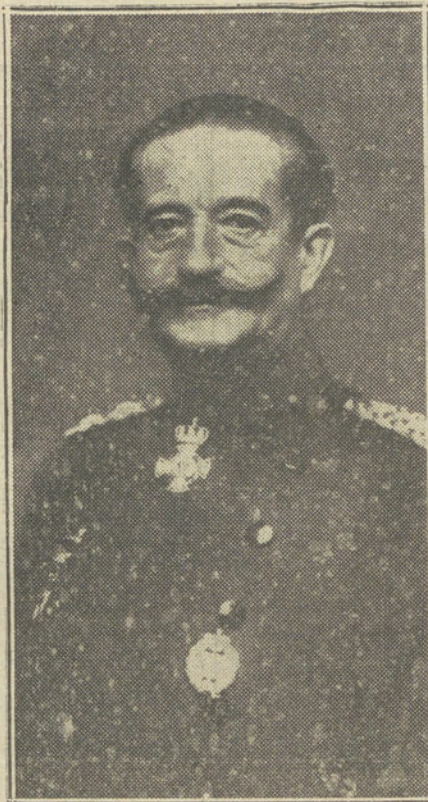
El general von BISSING, nuevo gobernador militar de Bruselas, nombrado en sustitución de von Der Goltz.