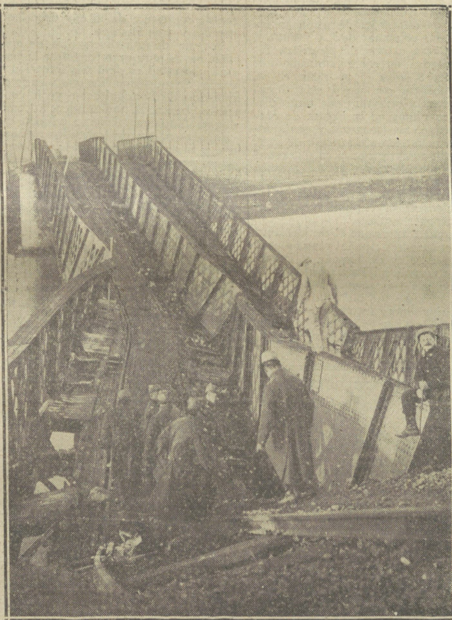
Puente volado por los franceses, para impedir el avance de los alemanes en la línea de Iprés.

«La Perseveranza» califica de brillantes los planes del cuartel general alemán en Oriente. Está completamente compro-