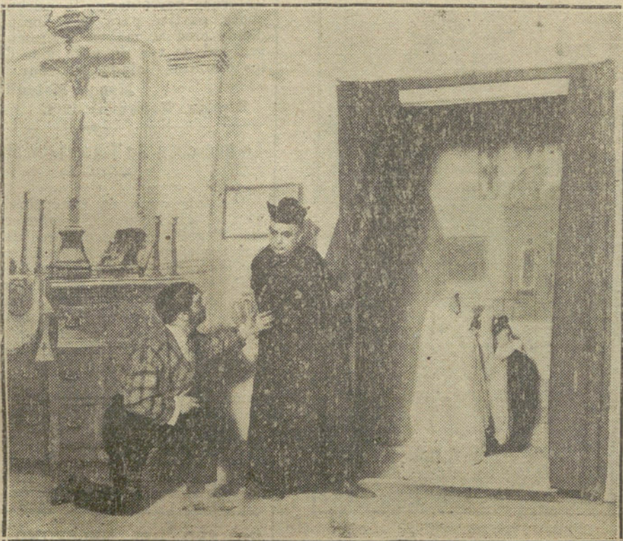
Una escena del melodrama «La sobrina del cura», estrenado con gran éxito en el teatro Cómico.