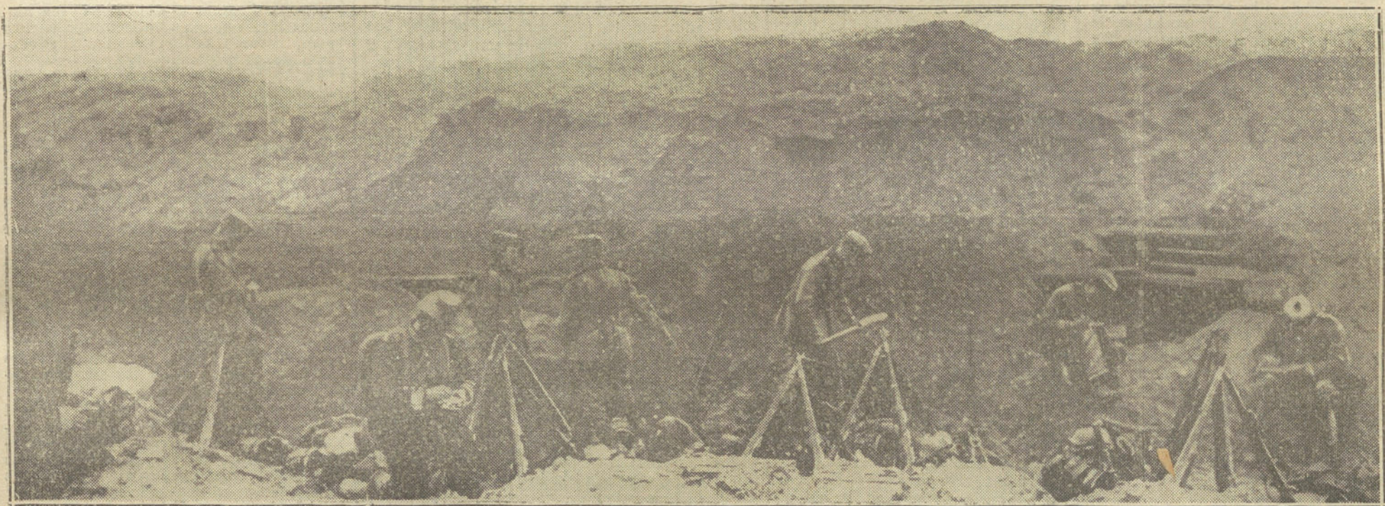
LA VIDA EN CAMPAÑA.—Soldados alemanes en una trinchera de la línea de fuego escribiendo á sus familias las impresiones de la jornada.