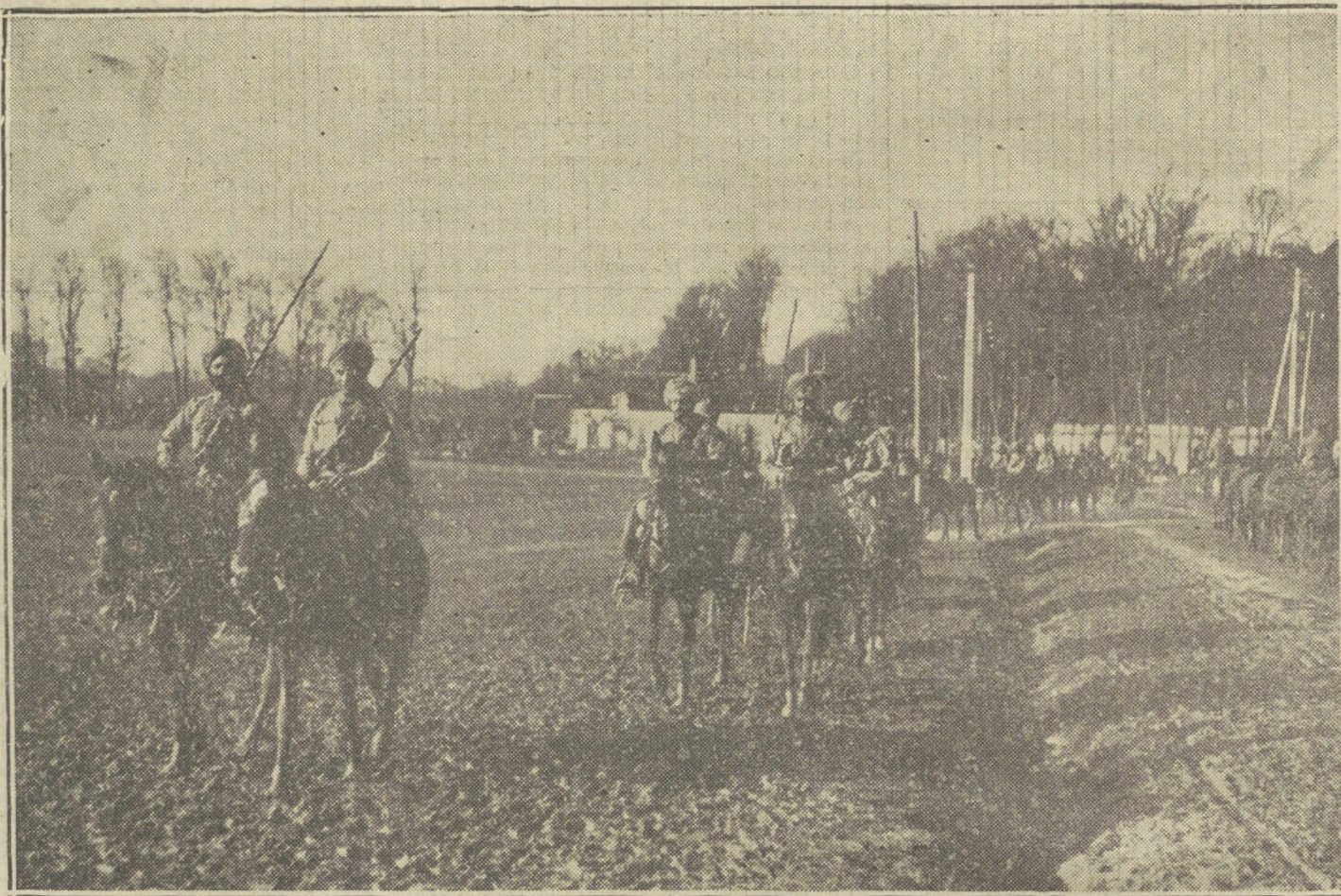
LA GUERRA EN FRANCIA.—Patrulla de Caballería india durante un reconocimiento por las cercanías de Arras.

ras. En Furnes se goza de una cierta tranquilidad, porque se sabe que los alemanes no atacarán por ahora; las aguas les cierran el paso. Desde Dixmude no han podido avanzar, y buscando tierra firme, han bajado hasta Iprés.