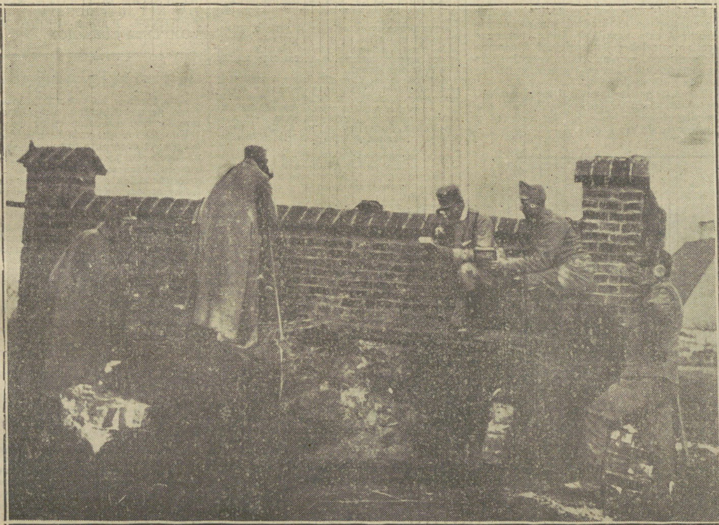
LA GUERRA EN GALITZIA.—Puesto de observación y teléfono de una batería austriaca en la línea de fuego.

NUMERO DEL TELEFONO DE LA REDACCION, ADMINISTRACION Y TALLERES DE «LA TRIBUNA»: 4.446