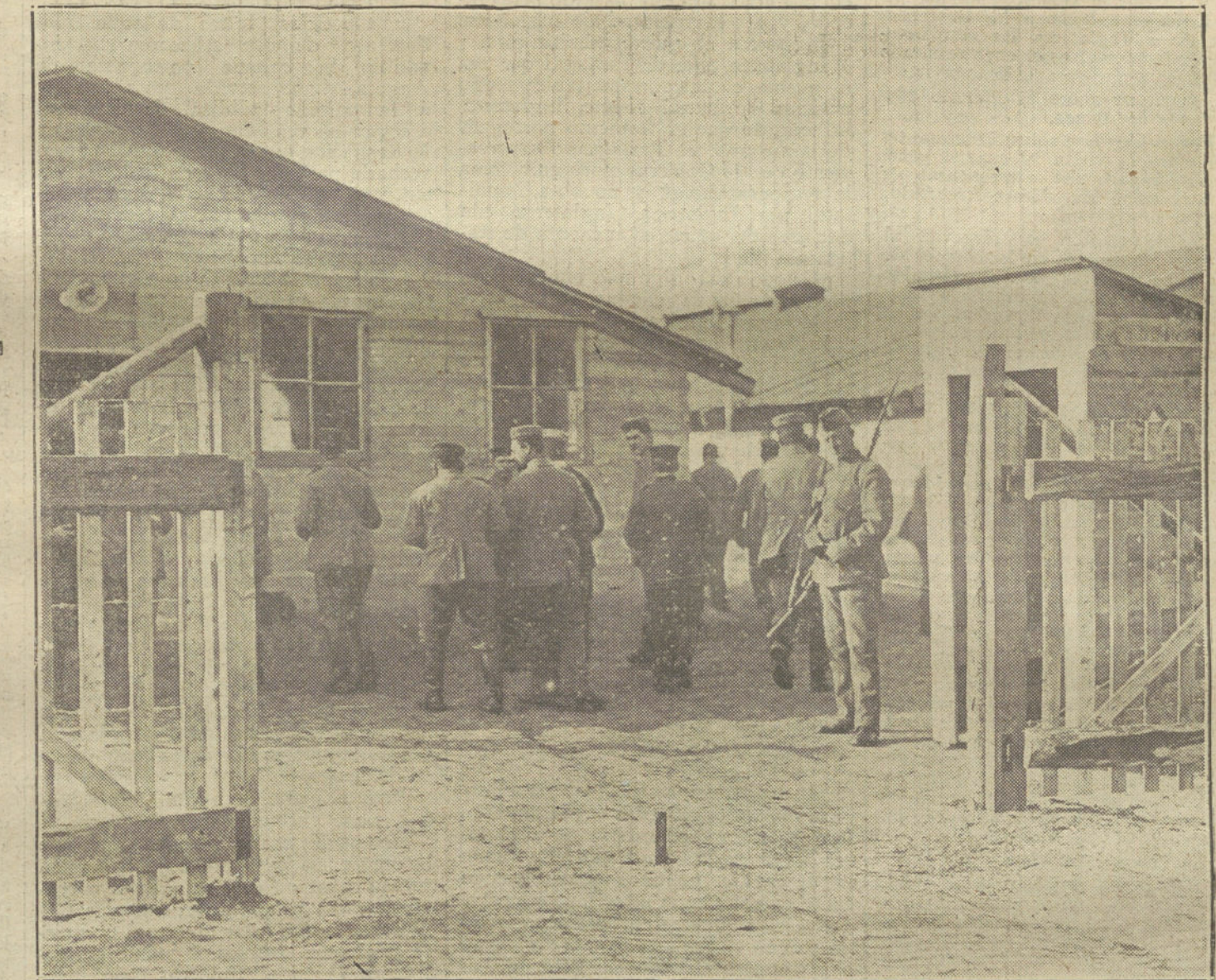
Soldados alemanes heridos en las batallas de Bélgica y recogidos por la Cruz Roja holandesa, curándose en un hospital provisional de Maestricht.

El «Courant» de Rotterdam publica una información de Estocolmo, según la cual en Finlandia se ha publicado un ukase imperial que contiene un programa completo para la incorporación de-