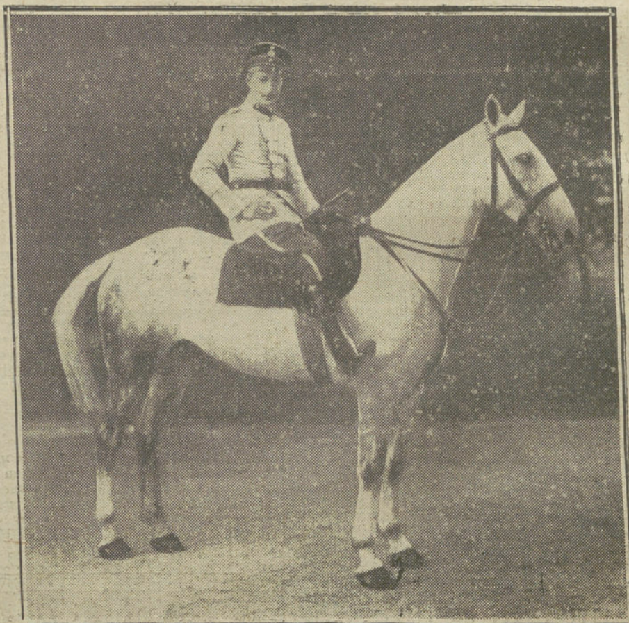
LA GUERRA EN ORIENTE.—El Kronprinz a caballo, disponiéndose para girar una inspección a las avanzadas de la Polonia rusa.