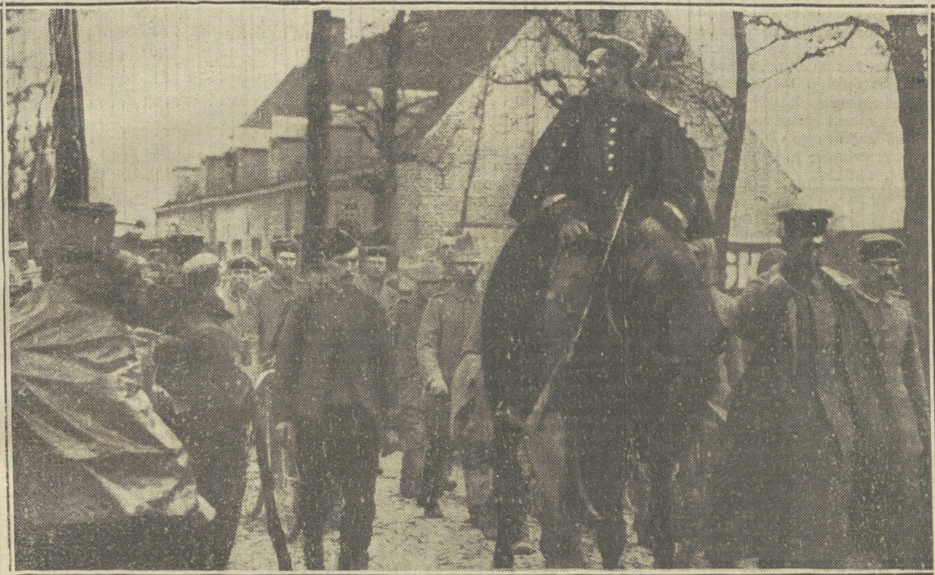
EL RESPETO AL ENEMIGO.—Un oficial alemán prisionero saludando la bandera belga.