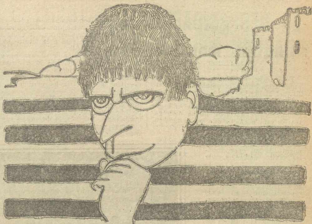
El próximo viernes, gran debat en el TEATRO PRICE de la compañía de dramas policíacos, que dirige el notable actor CARALT

Después de leída la declaración ministerial en el Congreso y en el Senado, manifestaron la mayor parte de los jefes de los partidos políticos su oposición al Gabinete