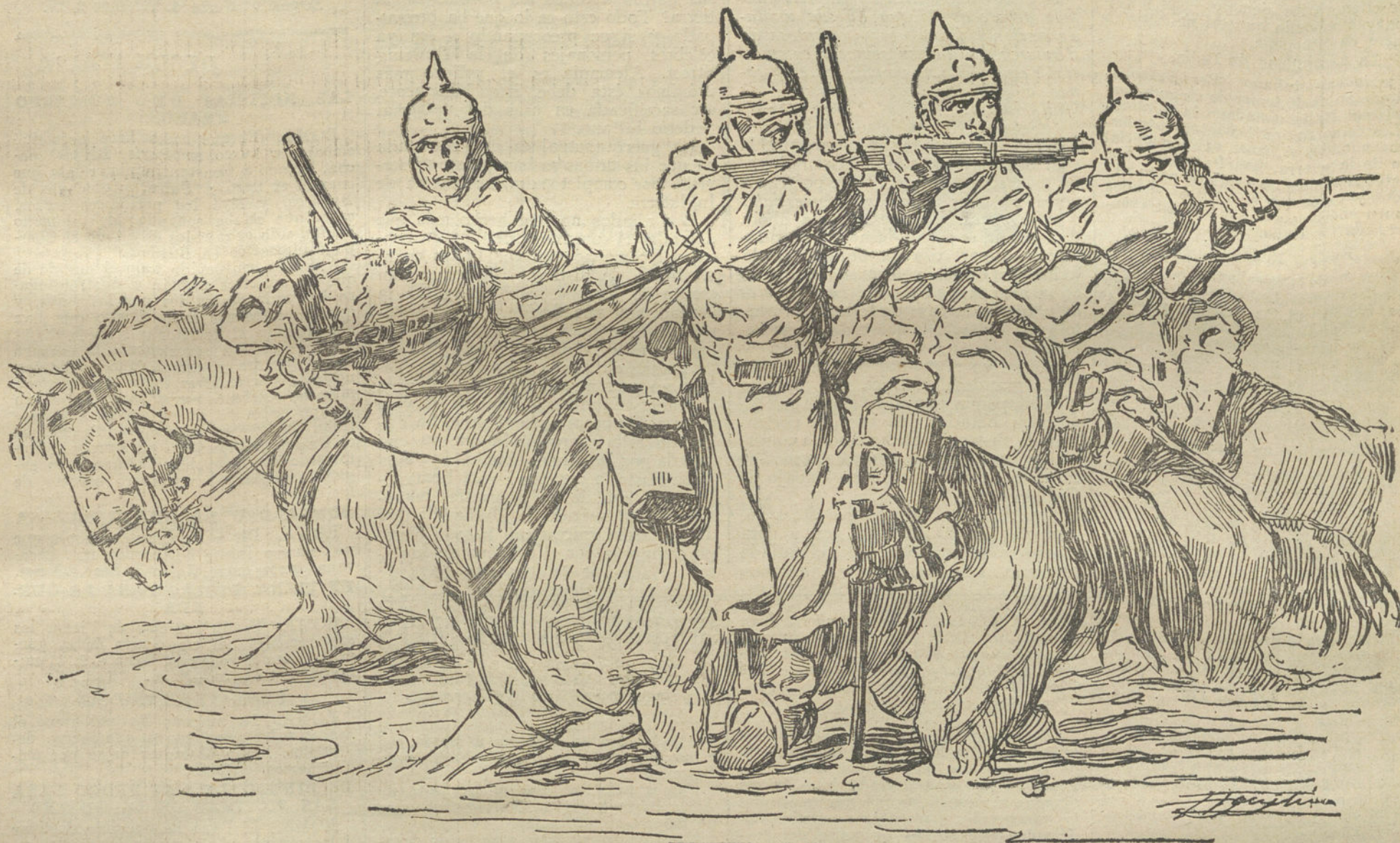
PATRULLA DE CABALLERIA ALEMANA