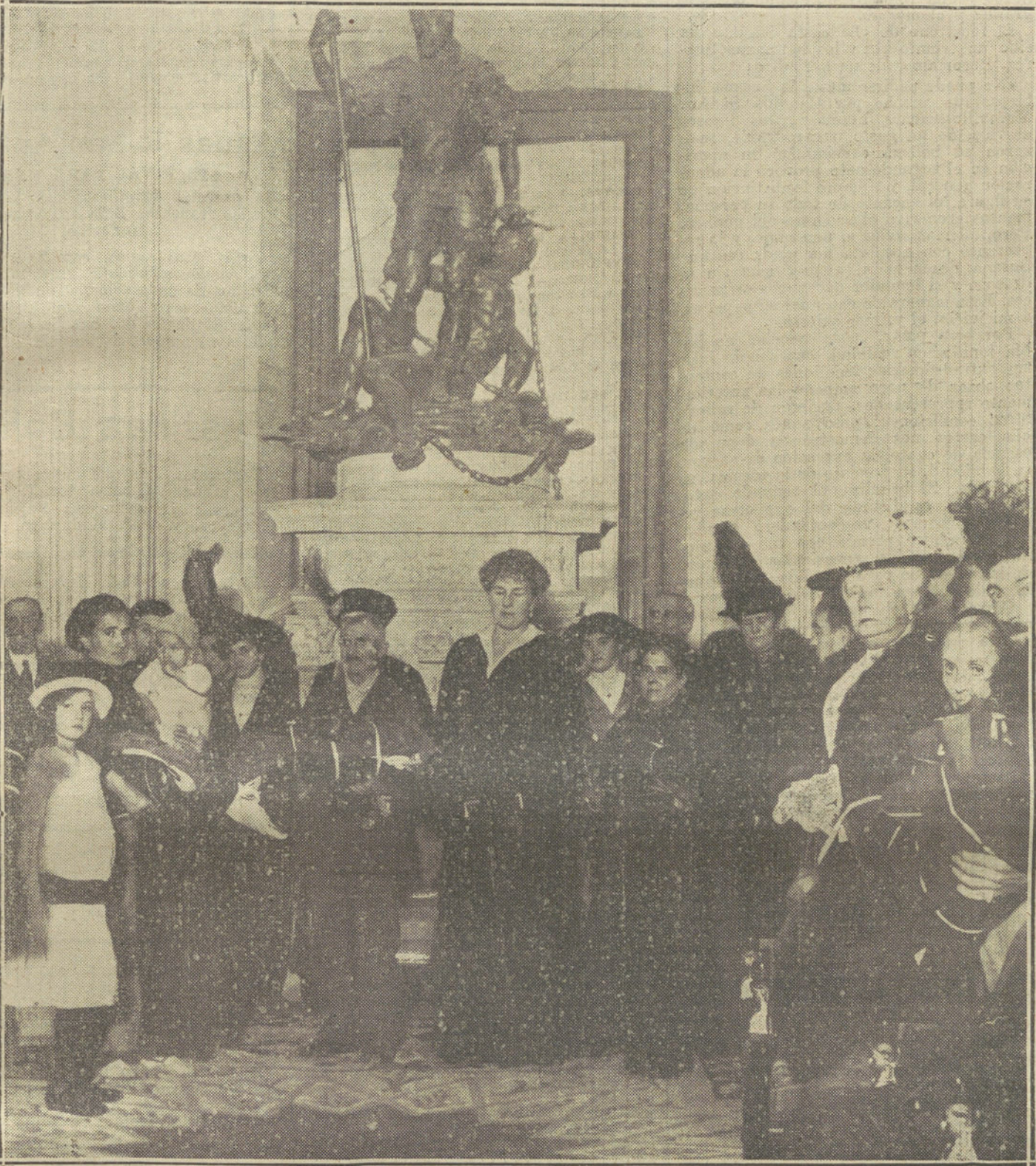
CEREMONIA EN PALACIO.—S. M. la Reina Victoria y S. A. la Infanta Isabel durante el reparto de ropas á los pobres verificado ayer en Palacio.

Las de los soldados no es sino el salario ó parte del salario que el Estado paga por los servicios de sus maridos, que son los que han de decir si la mujer debe ser vigilada ó no ha de recibir dicha pensión. Cuando un patrón paga á un empleado, no le paga para que haga buen uso de su dinero, ni esto le debe importar; le paga los servicios prestados, le reembolsa en metal los esfuerzos y energías gastados en su favor.