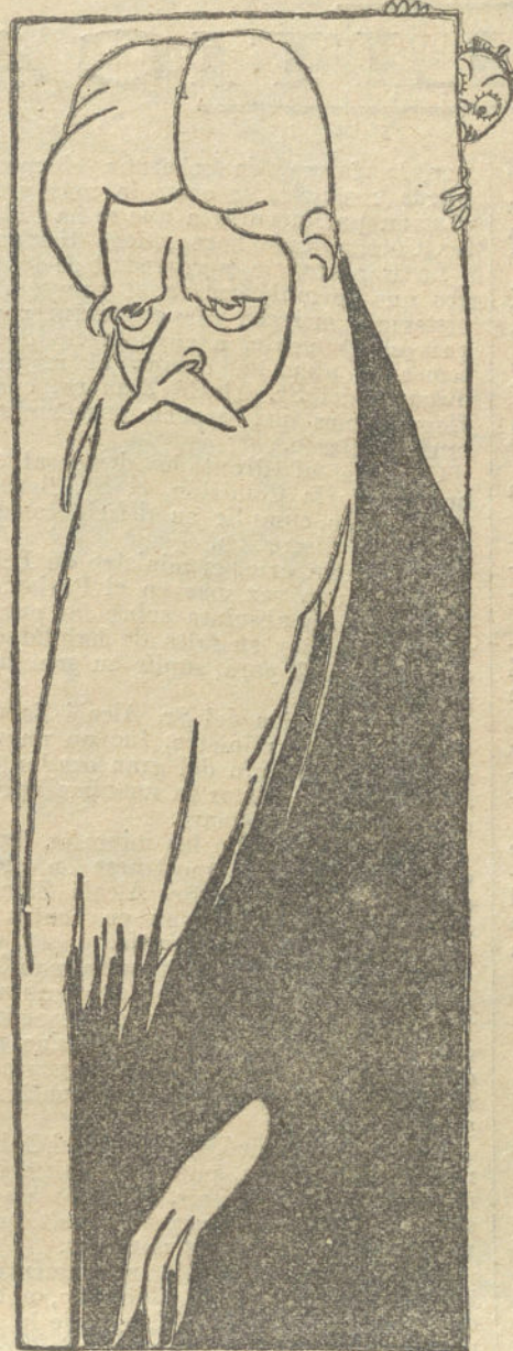
El distinguido actor señor CARALT, director de la compañía de dramas policíacos, que debuta esta noche en el teatro de Price con la obra «El espía».

Termina diciendo que los valores ó depósitos de nuestros nacionales no pueden ser afectados por ninguna contingencia de la guerra en Bélgica.