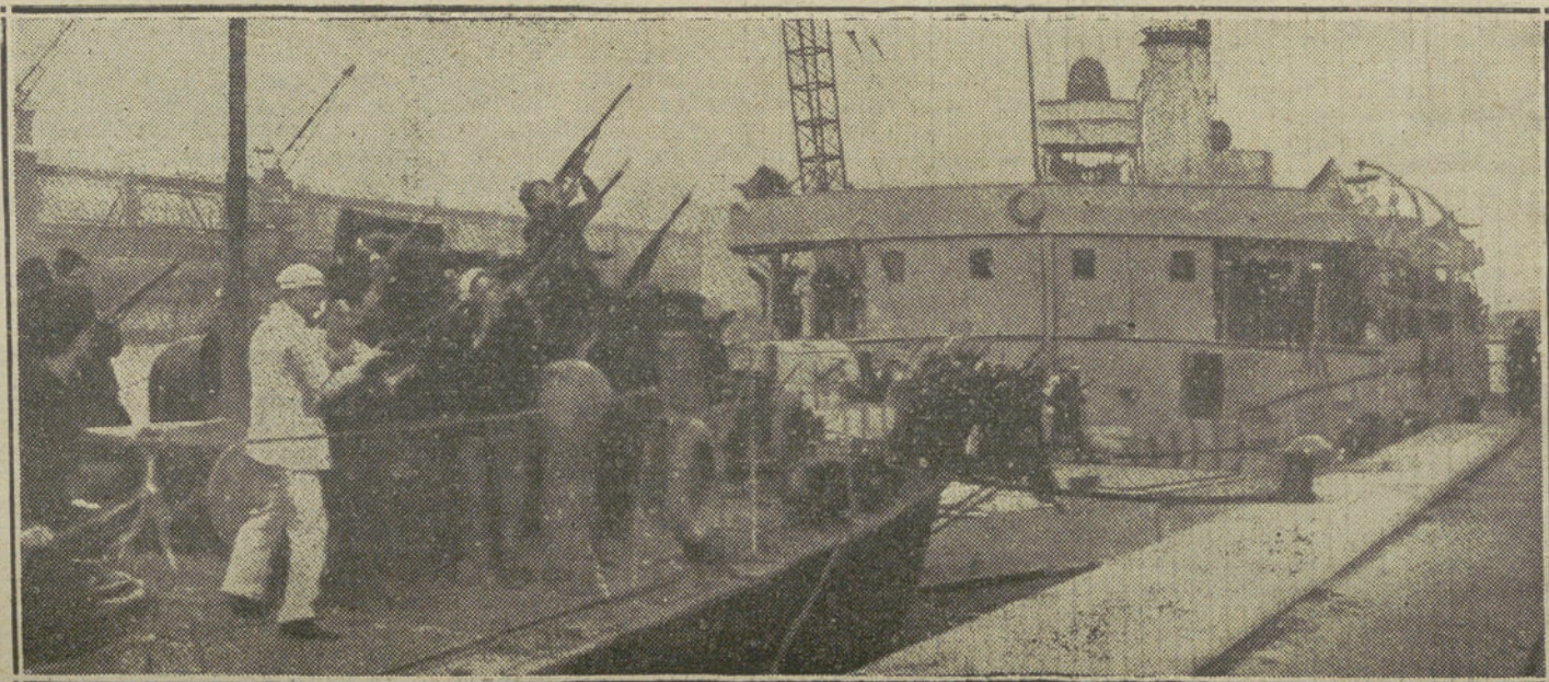
LA GUERRA EN EL MAR Y EN EL AIRE.—Marinos ingleses en un monfroy, disparando contra los aeroplanos alemanes.

NUMERO DEL TELEFONO DE «LA TRIBUNA»: 4.444