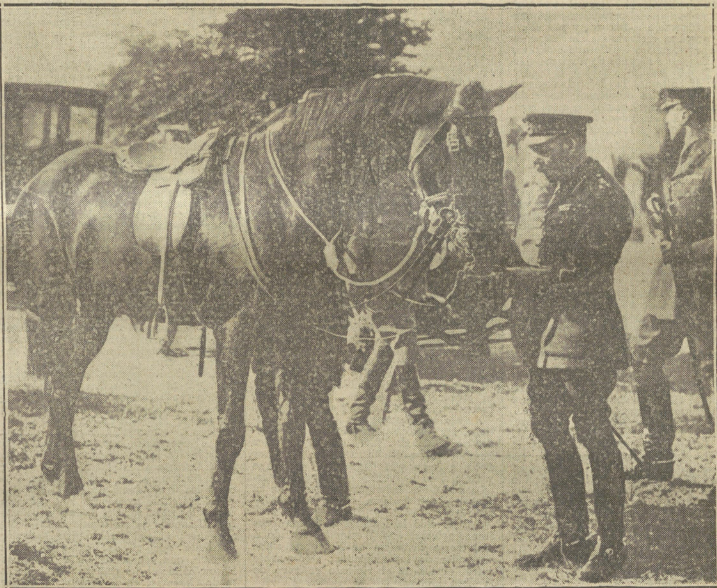
EL REY DE INGLATERRA EN EL CAMPO DE BATALLA.—Jorge V dando azúcar a su caballo durante su visita a los campamentos ingleses.

BOMBAS FRANCESAS SOBRE GANTE. — UN EMPRESTITO ITALIANO. — LOS SUBMARINOS ALEMANES EN CONSTANTINOPLA. — LAS CONFERENCIAS DE MALMOE. — DOS AVIADORES CARBONIZADOS. — FRANCIA EN MARRUECOS. — DIPUTADOS QUE SE RETIRAN. — ULTIMOS TELEGRAMAS Y RADIOGRAMAS