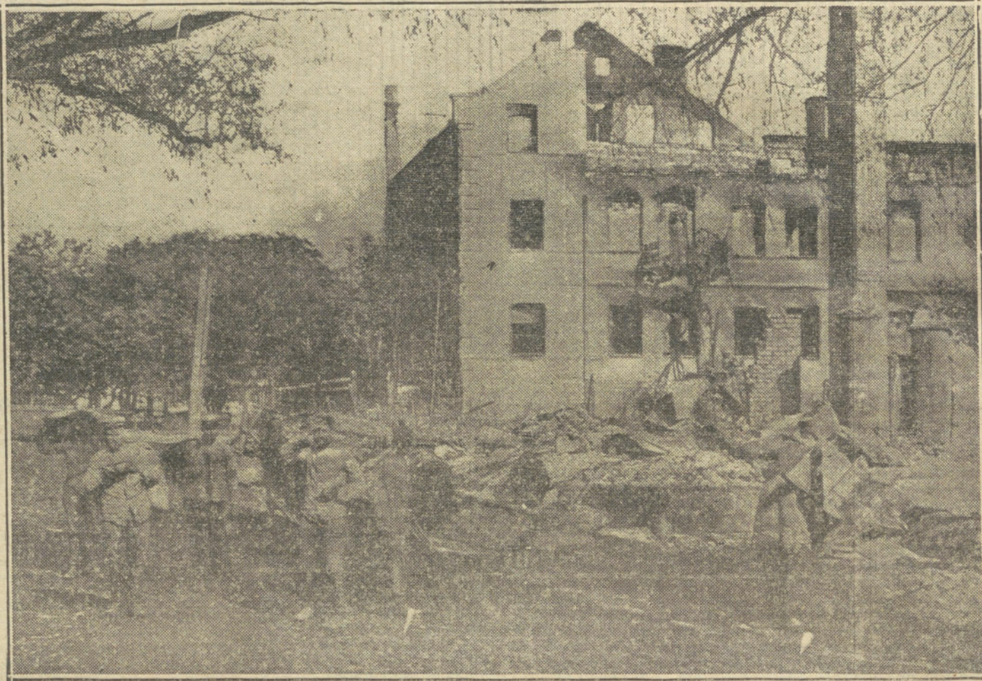
LA GUERRA EN ORIENTE.—Aspecto de una villa de la frontera ruso-prusiana, recuperada por los alemanes después de bombardearla la Artillería rusa.

Pero el Destino no lo quiso así. La escuadra aliada, sin hacer otra cosa que una vana demostración frente a las costas de la Gran Bretaña, regresó a Brest tan quebrantada por las averías como por las disensiones de los almirantes, y los ingleses se aprovecharon de esta favorable circunstancia para, enviar en auxilio de Gibraltar una escuadra de 22