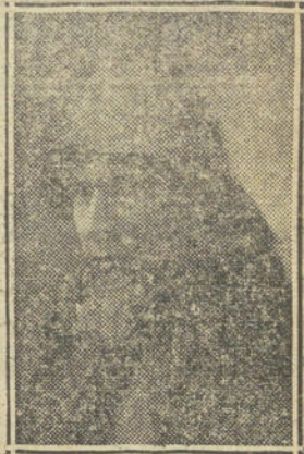
El distinguido actor Sr. Caralt, que actúa con gran éxito en el teatro Price, donde diariamente se representa el sensacional drama policiaco «El Espía».

cosas que los pueblos nunca perdonan á sus Gobiernos: el egoísmo ó la indiferencia.