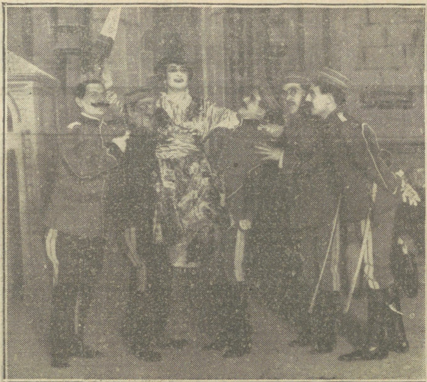
Una escena de la obra «El soldado de cuota», de González de Lara y Casado, estrenada con gran éxito en el teatro Martín.

Y seguidme a lo largo del litoral que baña el espléndido mar latino. Contemplad a Valencia, ebria de arte y magnífica de color, y olvidad ante sus maravillas naturales cómo se pudren las na-