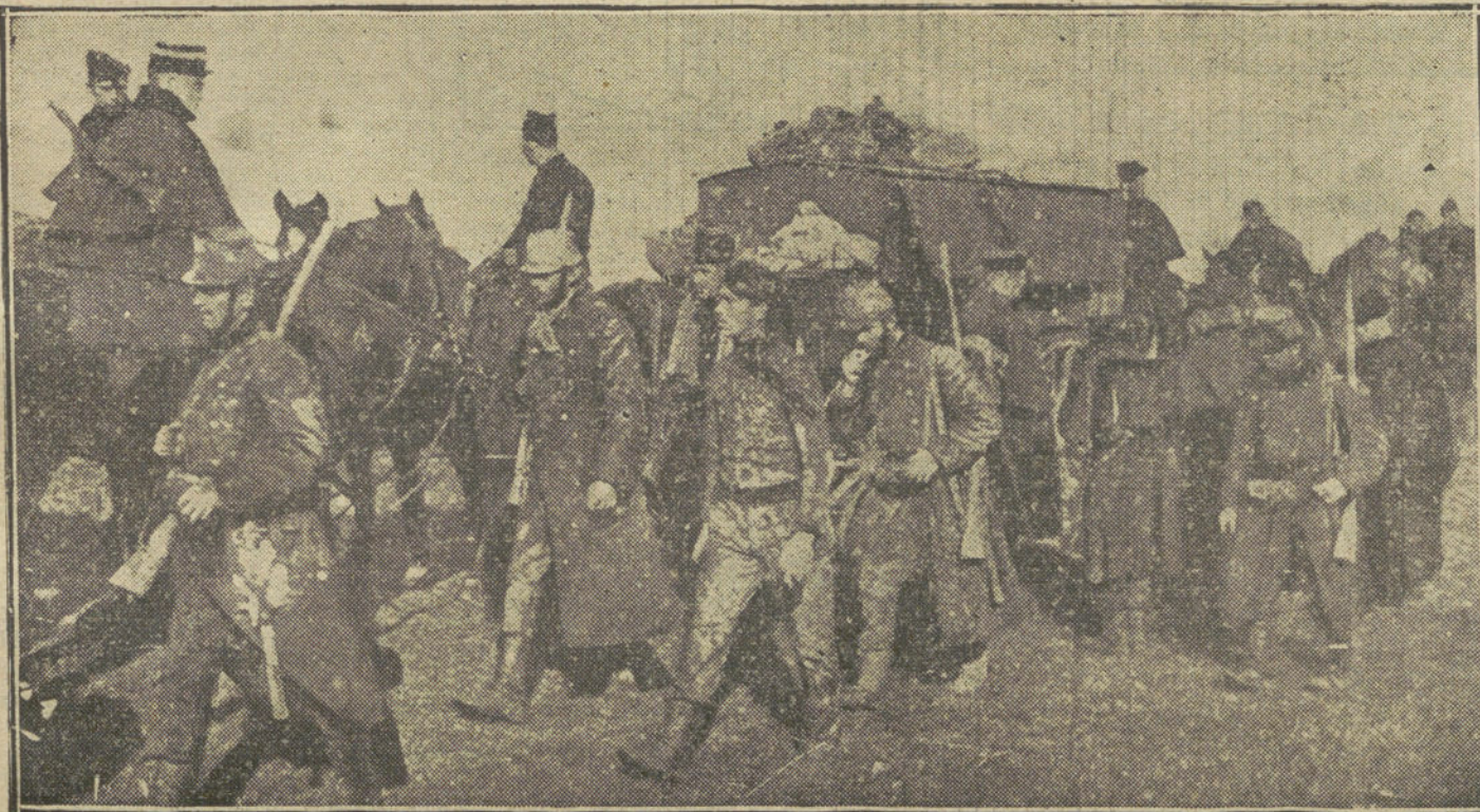
LA GUERRA EN BELGICA.—Tropas belgas regresando a su campamento después de un combate.

Los que critiquen a Dormay serán unos fariseos. La unión de los franceses debe ser contra los enemigos de fuera, y la comunión del país. Lo mismo contra las faltas que aniquilan Francia que contra los que intentan destruirla.