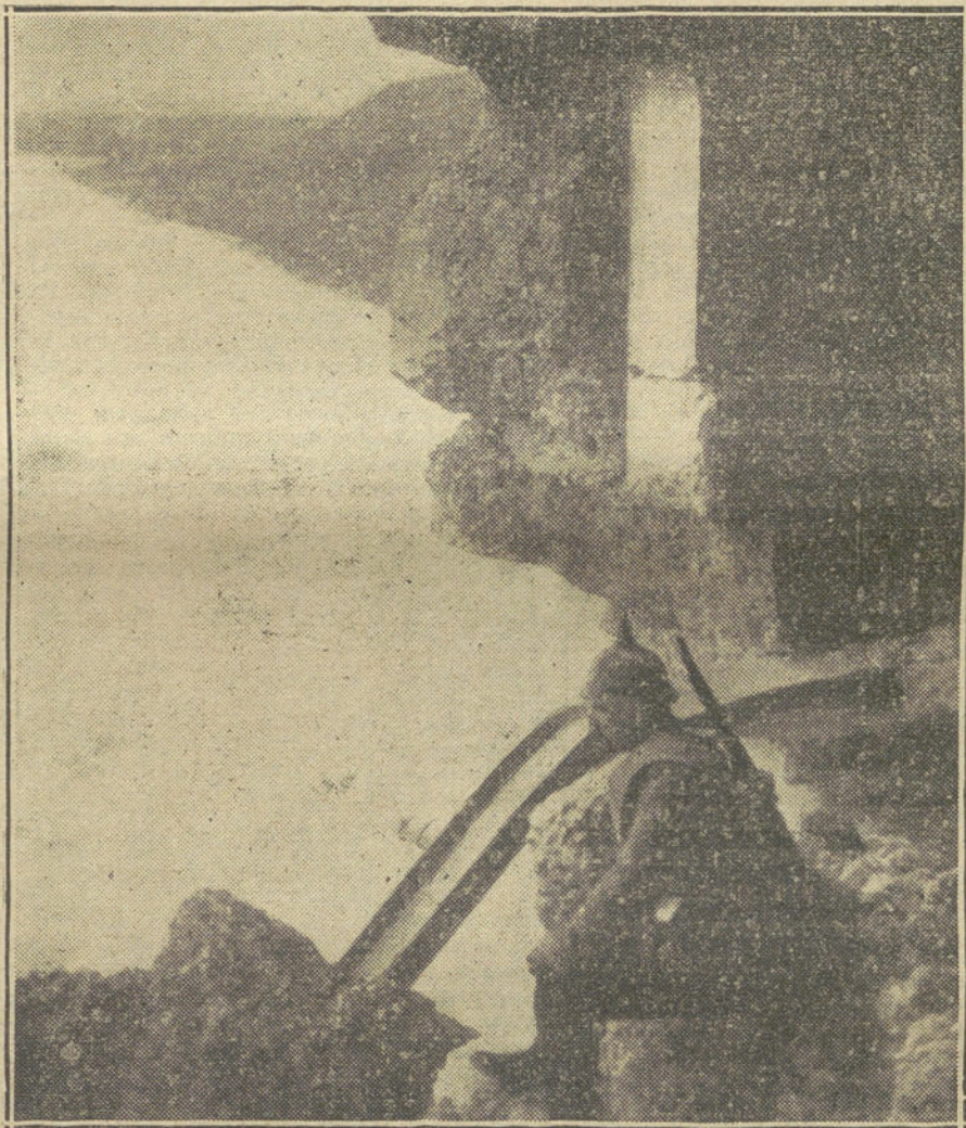
LOS ALEMANES EN BELGICA.—Centinela alemán en las ruinas de un fuerte de Amberes destruido por los cañones de 42.

Desde el principio de la guerra un ejér-