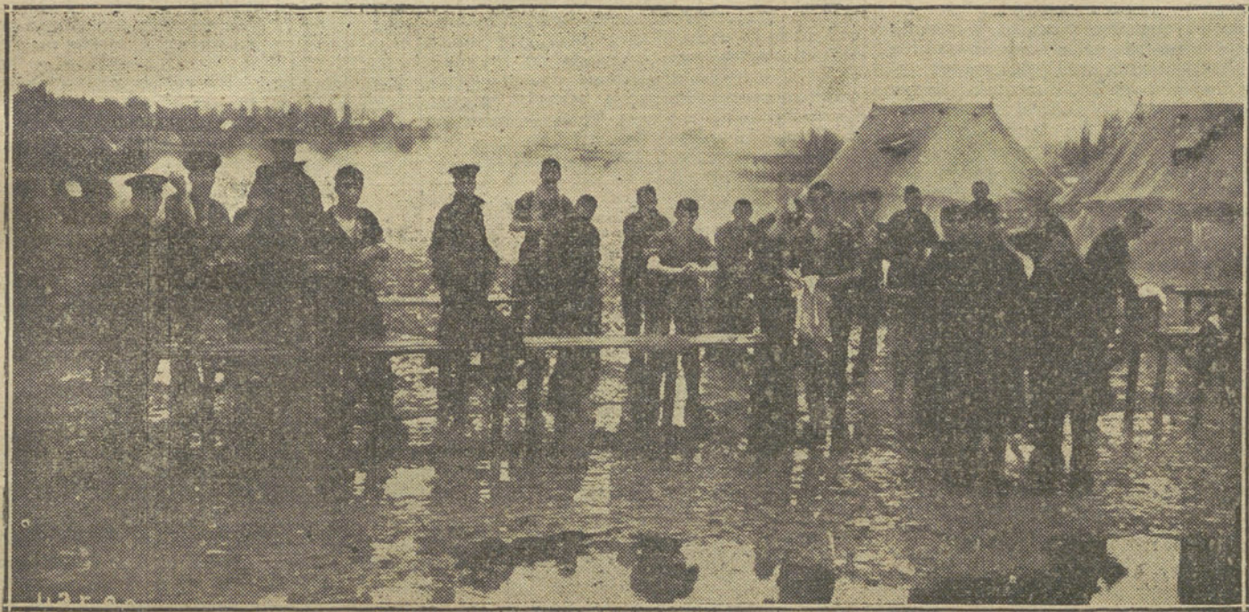
LA VIDA EN CAMPAÑA.—Aspecto de un campamento inglés al amanecer.

cito estaba concentrado en los altos del Meuse y en Woëvre, al Oeste de Verdun, quiso atravesar la línea alemana, cosa que es fuerza confesar no consiguió, y desde entonces ha quedado inmovilizado por orden del generalísimo, teniendo después que retroceder.»