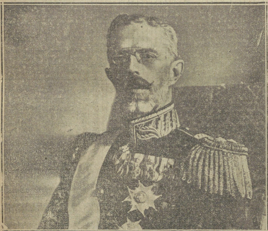
El Rey GUSTAVO V de Suecia.

ROMA. Dicen de Berlín que la afirmación hecha en los informes rusos diciendo que en Tschenstochau había fracasado un ataque alemán con graves pérdidas, es falsa. Lo contrario es verdad. Un ataque del Cuerpo de ejército ruso XVII, que avanzó hasta 60 metros de los alemanes; fué repelido con gravísimas pérdidas para los rusos, dejando atrás