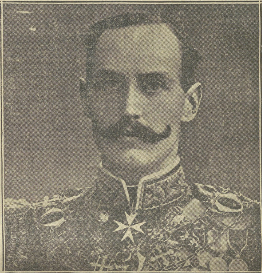
El Rey HAAKON VII de Noruega.

PARIS. «Le Temps» protesta, porque el crucero alemán «Dresden», que escapó del combate junto á las islas Malvinas, haya sido autorizado por los representantes del Gobierno chileno para aprovisionarse en Punta Arenas.