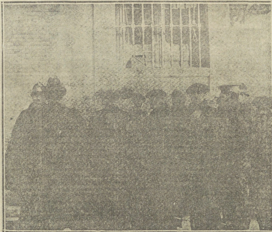
EN LA CASA DE LA MONEDA.—El buzón por donde los reporters que hacen la información del sorteo entregan a los «corredores» las cuartillas.

Como los premios mayores se han hecho mucho esperar, ha reinado en la asamblea gran animación hasta entrada la tarde.