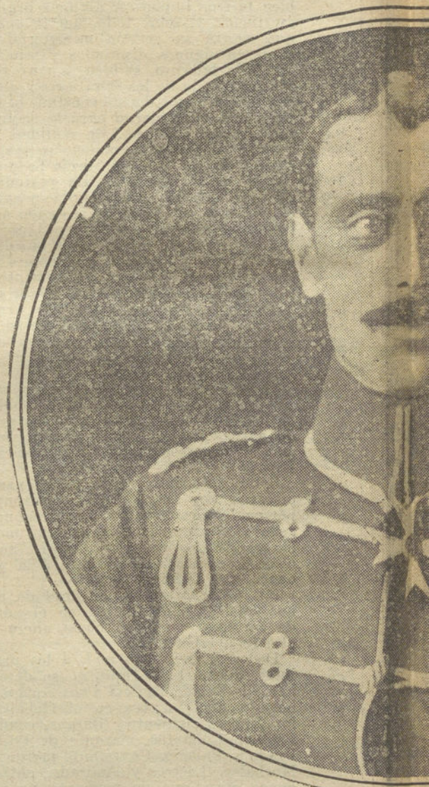
El Rey CRISTIAN X de Dinamarca, qu ha celebrado otros Monarcas esc...

Hemos atacado en el Sudoeste de Puisseine y al Sur de Noyon, apoderándo-