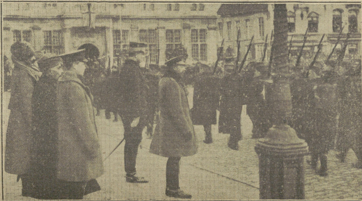
LOS SOBERANOS EN LA GUERRA.—Los Reyes de Bélgica é Inglaterra, con el Príncipe de Gales, presenciando un desfile de tropas en el Havre.

Estos fondos ingresaron entonces de nuevo en la caja del Banco Imperial y fueron agregados á las sumas muy im-