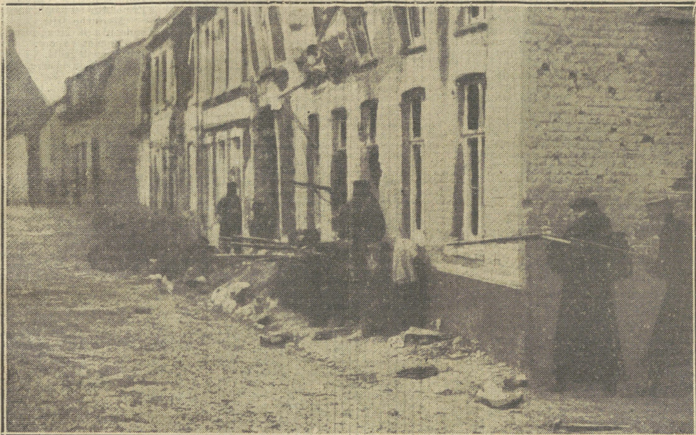
LA GUERRA EN BELGICA.—Destacamento belga defendiendo la villa de Lombaertzyde.

portantes de los haberes que los varios Bancos dejaron acumular en el Banco Imperial. Esta manera tan elocuente de entregar los pagos ha traído otro éxito, poniendo en primer lugar al Imperio en condiciones de emplear una buena parte del producto del empréstito de guerra en reembolsar al Banco Imperial los créditos tomados durante las primeras semanas de la guerra y depositar además en el Banco Imperial una suma muy importante a disposición del Imperio.