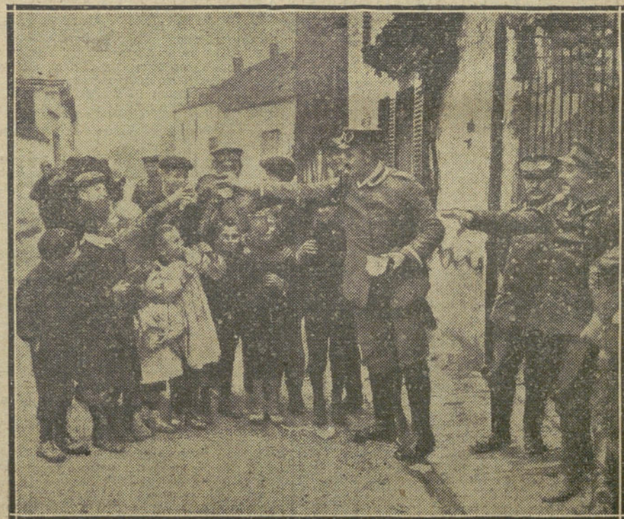
LA GUERRA EN BELGICA.—Suboficiales ciclistas alemanes repartiendo pan a los niños en una localidad belga.

El Archiduque Eugenio, igual que su hermano Federico, el comandante en jefe del Ejército austro-húngaro, ha manifestado muy a menudo sus vivas simpatías hacia España.»