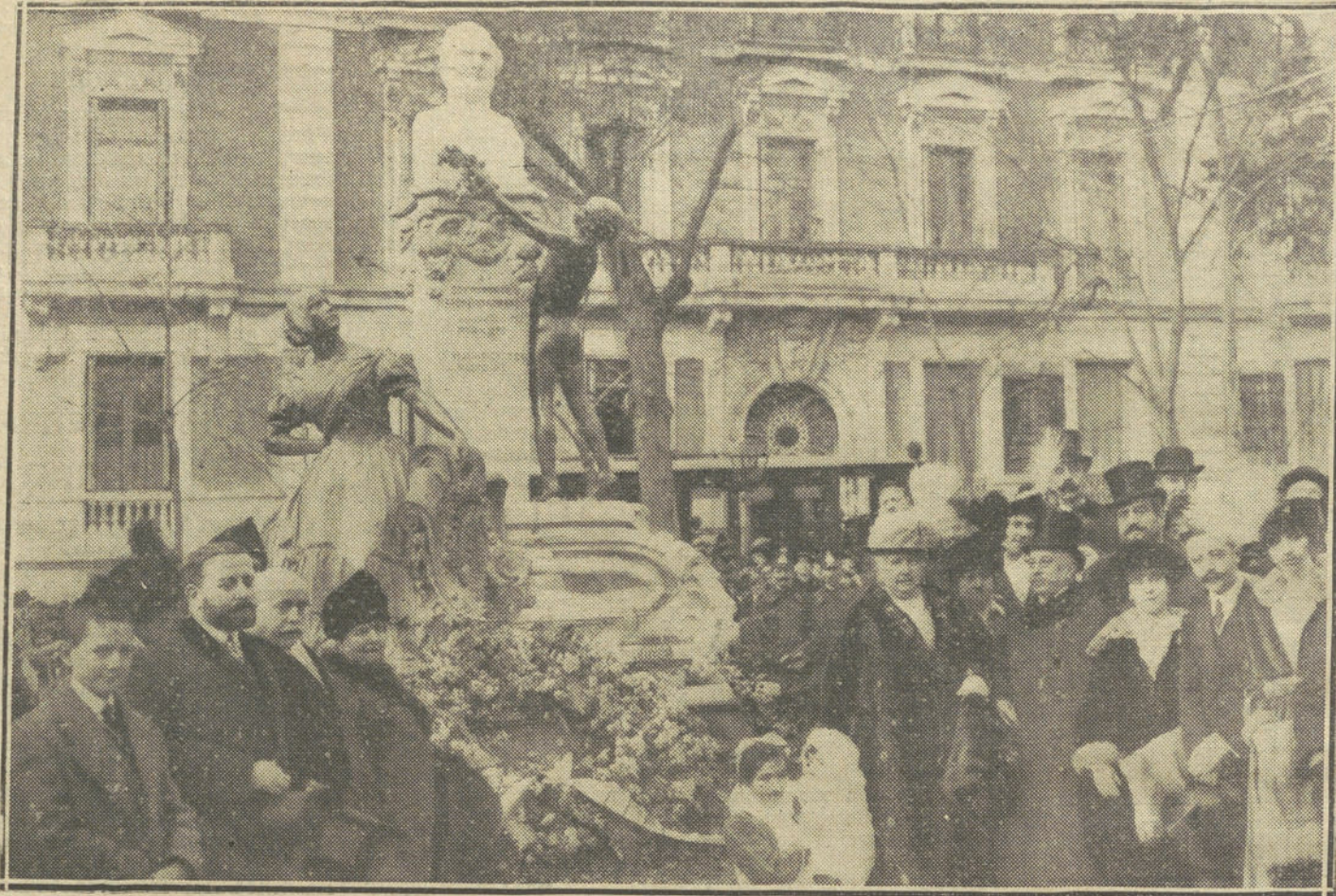
EL MONUMENTO A DON RAMON DE MESONERO ROMANOS.—La Infanta Isabel y la familia de Mesonero Romanos durante la inauguración del monumento erigido por el Municipio madrileño en el paseo de Recoletos.