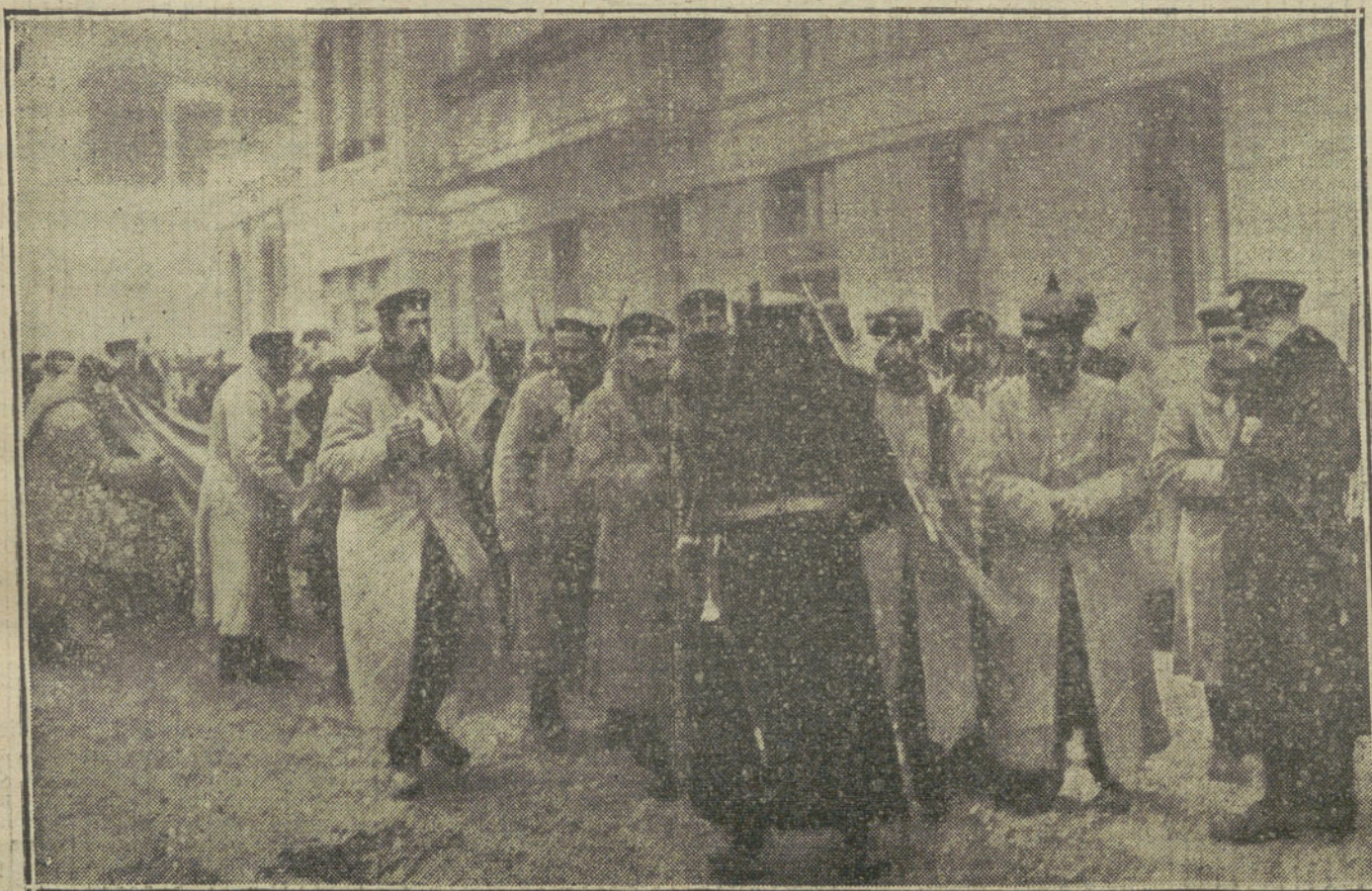
LA GUERRA EN ORIENTE.—Desfilando una columna de soldados alemanes heridos, a su paso por la ciudad rusa de Mlawa.