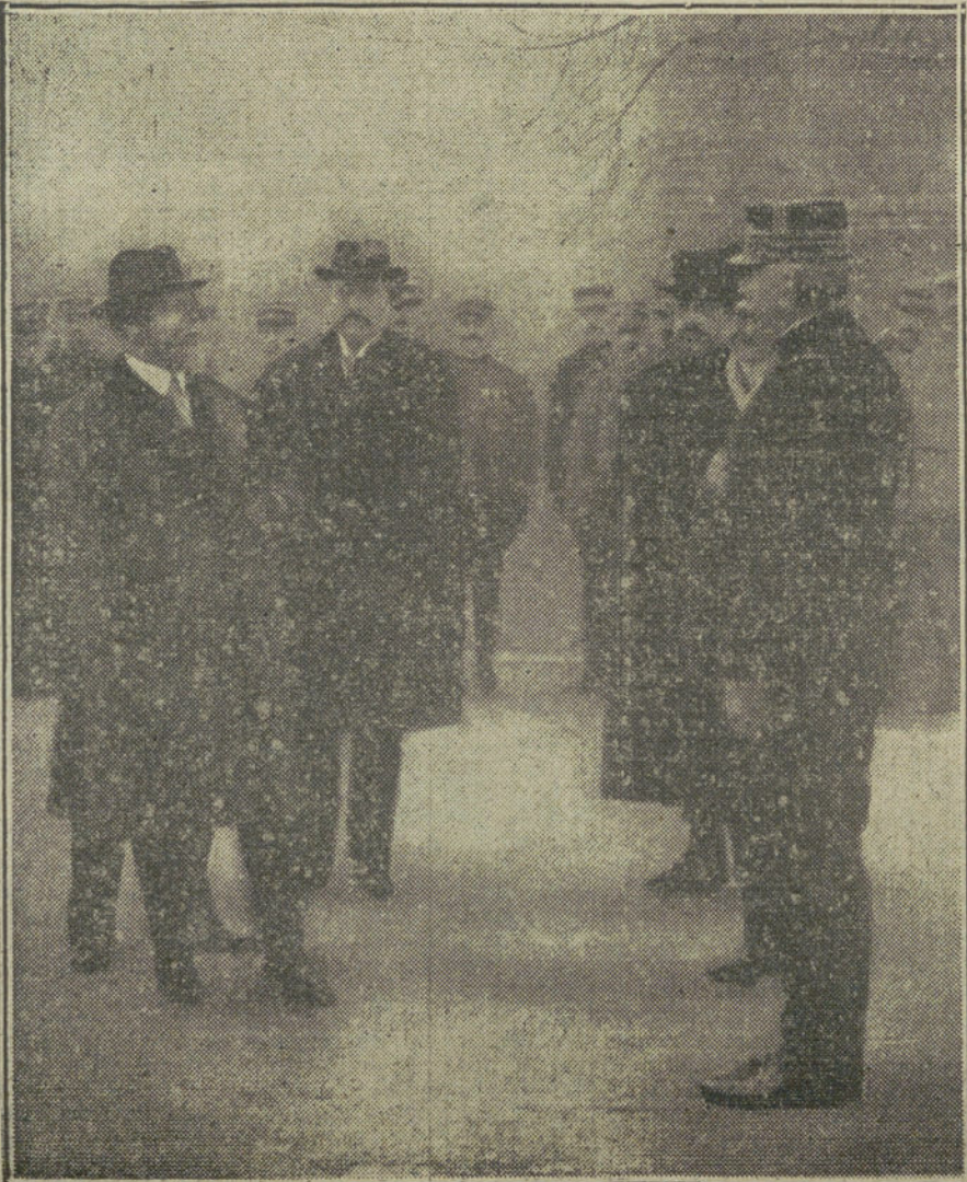
LA GUERRA EN FRANCIA.—El Presidente de la República francesa solicitando al general Joffre.