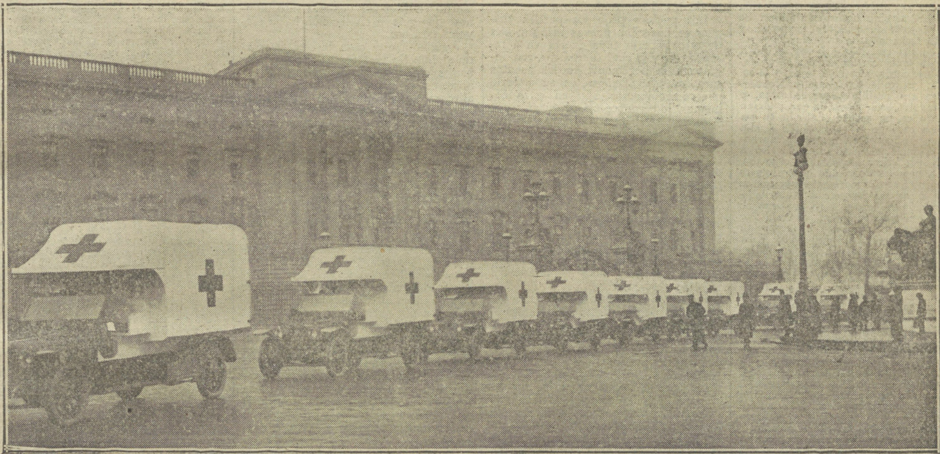
Automóviles para las ambulancias de la Cruz Roja, regalados a Inglaterra por el rajá de Gwalior.

DETALLES DE LA TOMA DE LODZ.—PANICO EN LA CAPITAL DE POLONIA.—PRECAUCIONES DE LAS AUTORIDADES RUSAS.—EL GENERAL HINDENBURG A FRANCIA.—OTRO LIBRO BLANCO DE ALEMANIA.—LA GUERRA EN EL MAR.—UN CONTRATORPEDERO INGLES ENCALLADO.—LOS ITALIANOS EN VALONA.—LA BOLSA DE BRUSELAS EN PARIS.—LOS SPAHIS Y EL SERVICIO DE TRINCHERAS.— OTROS TELEGRAMAS Y RADIOGRAMAS