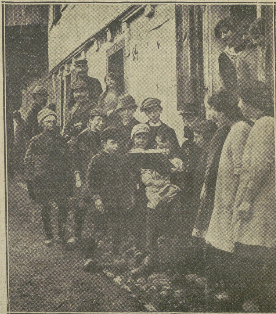
EN LA FRONTERA FRANCOALEMANA.—Un soldado dando lecciones de francés a los niños de una localidad alsaciana.

cañones de 30 centímetros, cuatro de 19, 50 de 15 y 52 de 10. Los alemanes podían oponer solamente 16 cañones de 21 centímetros, 12 de 15 y 30 de 10. De estas indicaciones se desprende el orgullo con que Inglaterra puede celebrar esta gran victoria.» (De El Mercurio, de Suavia.)