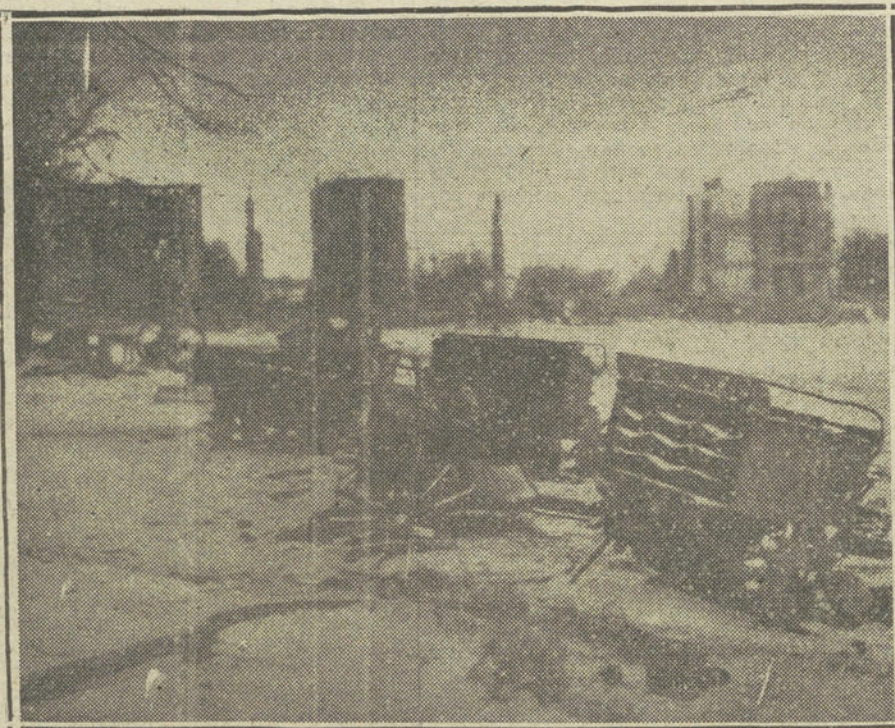
LA GUERRA EN ORIENTE.—Carros de municiones rusos destruidos por la Artillería alemana en la batalla de Soldau.

El general Joffre declara que el ejército alemán que opera en el teatro occidental de la guerra es inferior, numéricamente y en material, al suyo, al de los aliados. He aquí la confirmación del anuncio hecho por mí en estas columnas de la salida del ejército de París a las órdenes del general Gallieni para la región de Arras y Bethune. Y cuando el generalísimo asegura que el enemigo es menos fuerte que su ejército, es porque, mediante los elementos de información de que dispone un Estado Mayor, lo sabe de una manera cierta. No hay duda acerca de que el momento escogido por el general Joffre sea propicio para el ataque, aunque hasta ahora los resultados de la ofensiva no respondan al esfuerzo que representa. Ciertamente que el avance no puede ser rápido; las condiciones en que se desarrolla la lucha no permiten grandes saltos hacia la frontera alemana, porque cada paso cuesta mucha sangre y muchas municiones. Cada trinchera alemana tomada representa muchos hombres muertos, y cada casa de los pueblos disputados tiene un precio de vidas humanas aterrador. De otra parte, los alemanes no se limitan a la ofensiva, sino que también atacan vio-