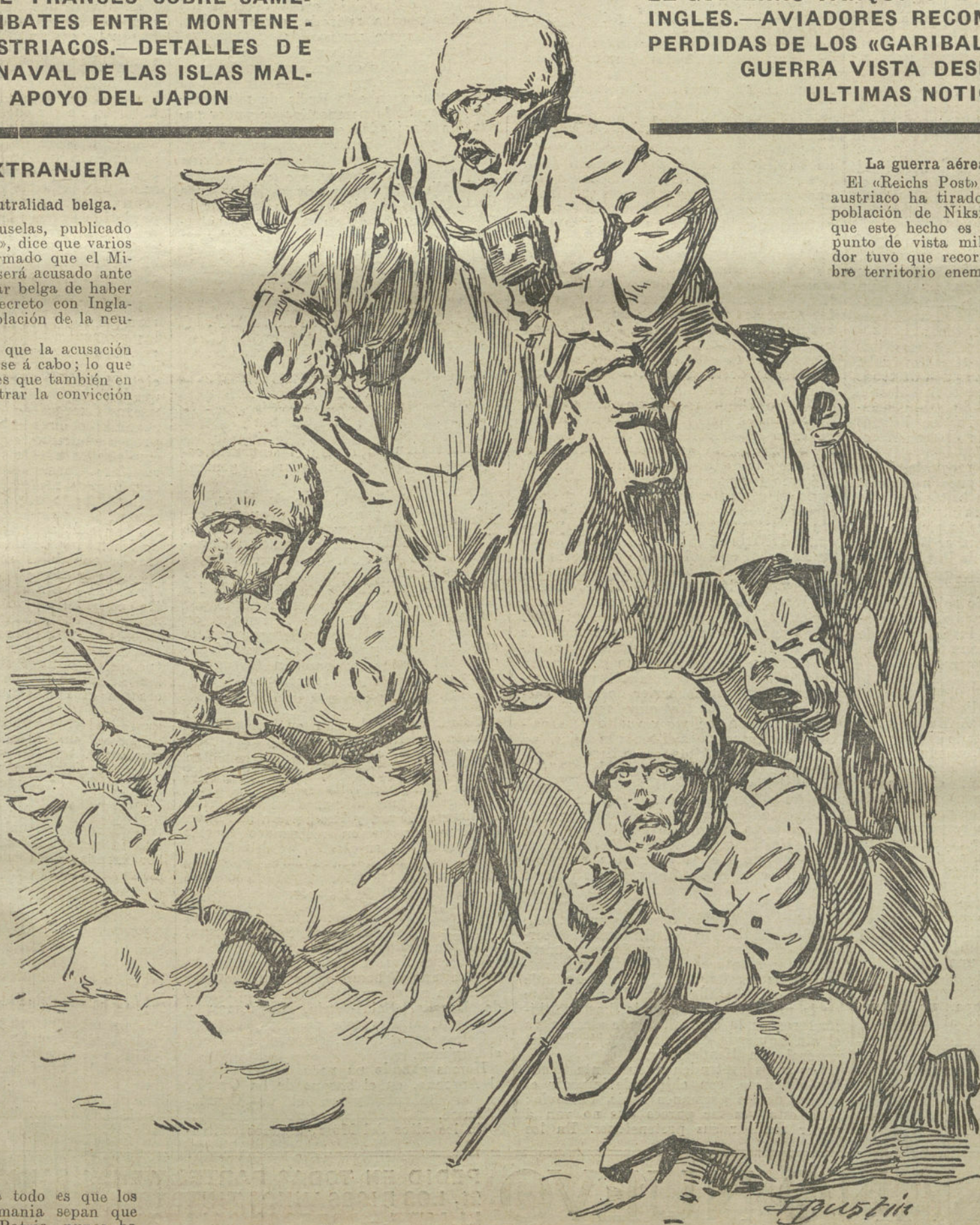
LOS PRIMEROS DISPAROS

Todos los oficiales del Ejército, la mayoría de los católicos y del clero, así como todas las personas cultas, están de acuerdo sobre el peligro ruso. Como oficial afirmo que todo lo que digo es la pura verdad, y autorizo a la Prensa para publicar mi nombre. Lo que me importa sobre todo es que los hijos heroicos de Alemania sepan que Rumania, mi querida Patria, nunca ha sido ni será enemiga de Alemania.»