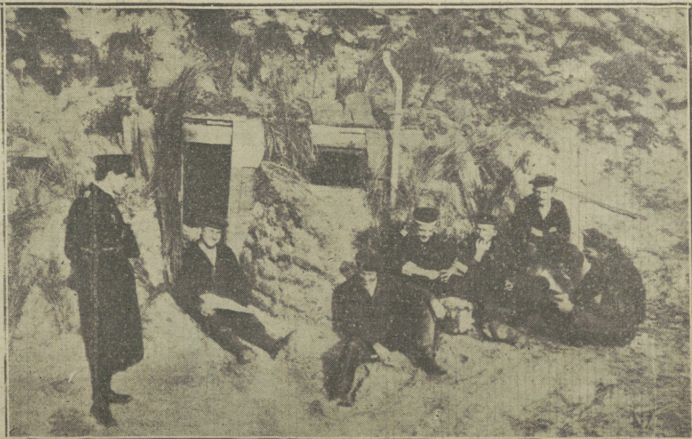
LA GUERRA EN BELGICA.—Marinos alemanes delante de una de sus viviendas de invierno en las Dunas, cerca de Ostende.

Es indudable que el poco éxito del pavo se debe a la guerra. Para los ingleses el pavo es un animal turco, como lo demuestra que en inglés pavo se dice «turkey». Entre el censor y Alemania, que ha logrado captarse las simpatías de los turcos, Londres, Inglaterra, parece que ha declarado la guerra a los animales turcos.