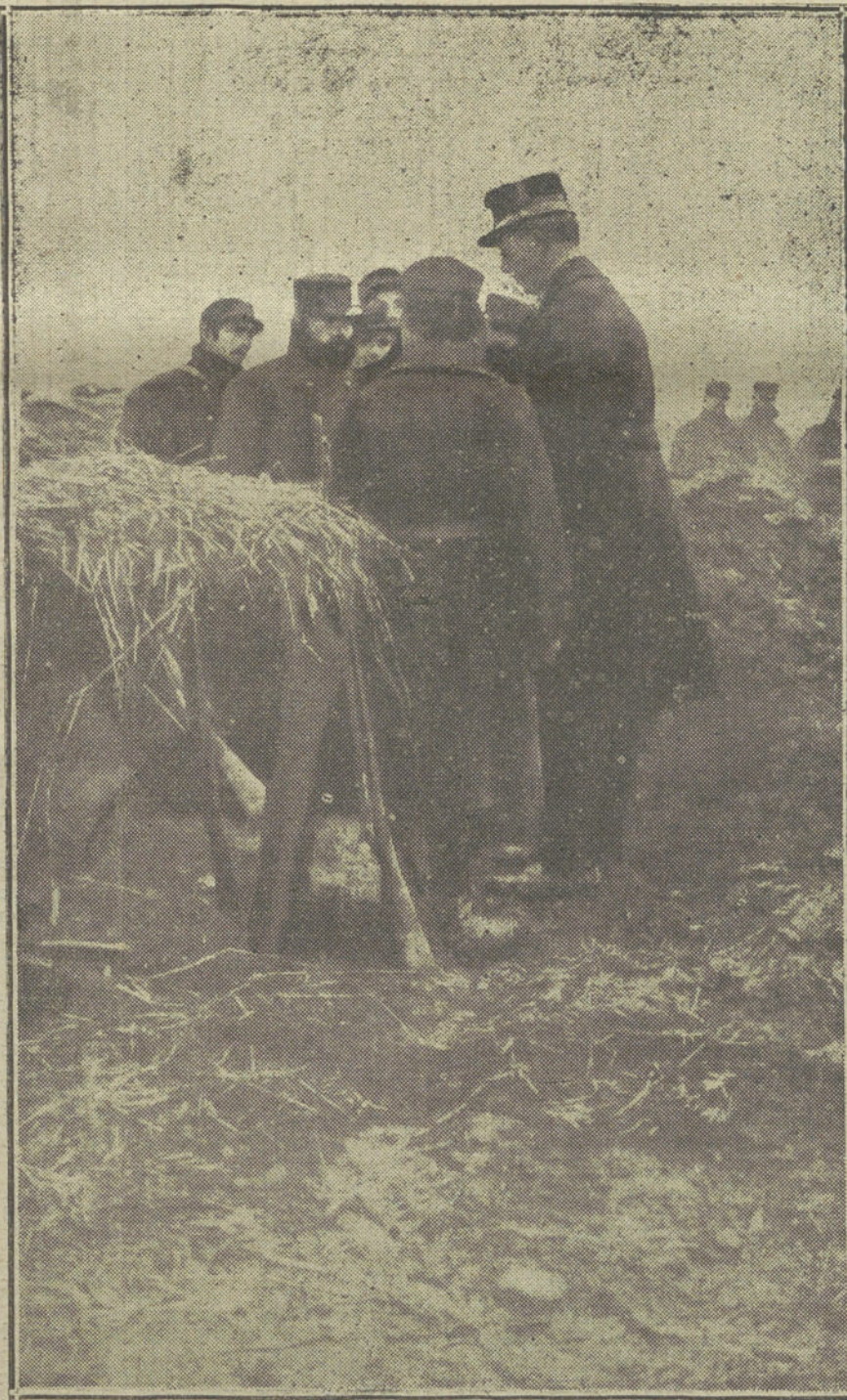
El Rey de Bélgica visitando las trincheras belgas de la línea de Nieuport.

En Eu hablé con un coronel francés que había combatido en Quesnay; lo que él me dijo sobre el general Joffre no lo puedo repetir, pero de sus indicaciones se desprende que los generales franceses Castelnau y Sarraill son competidores del