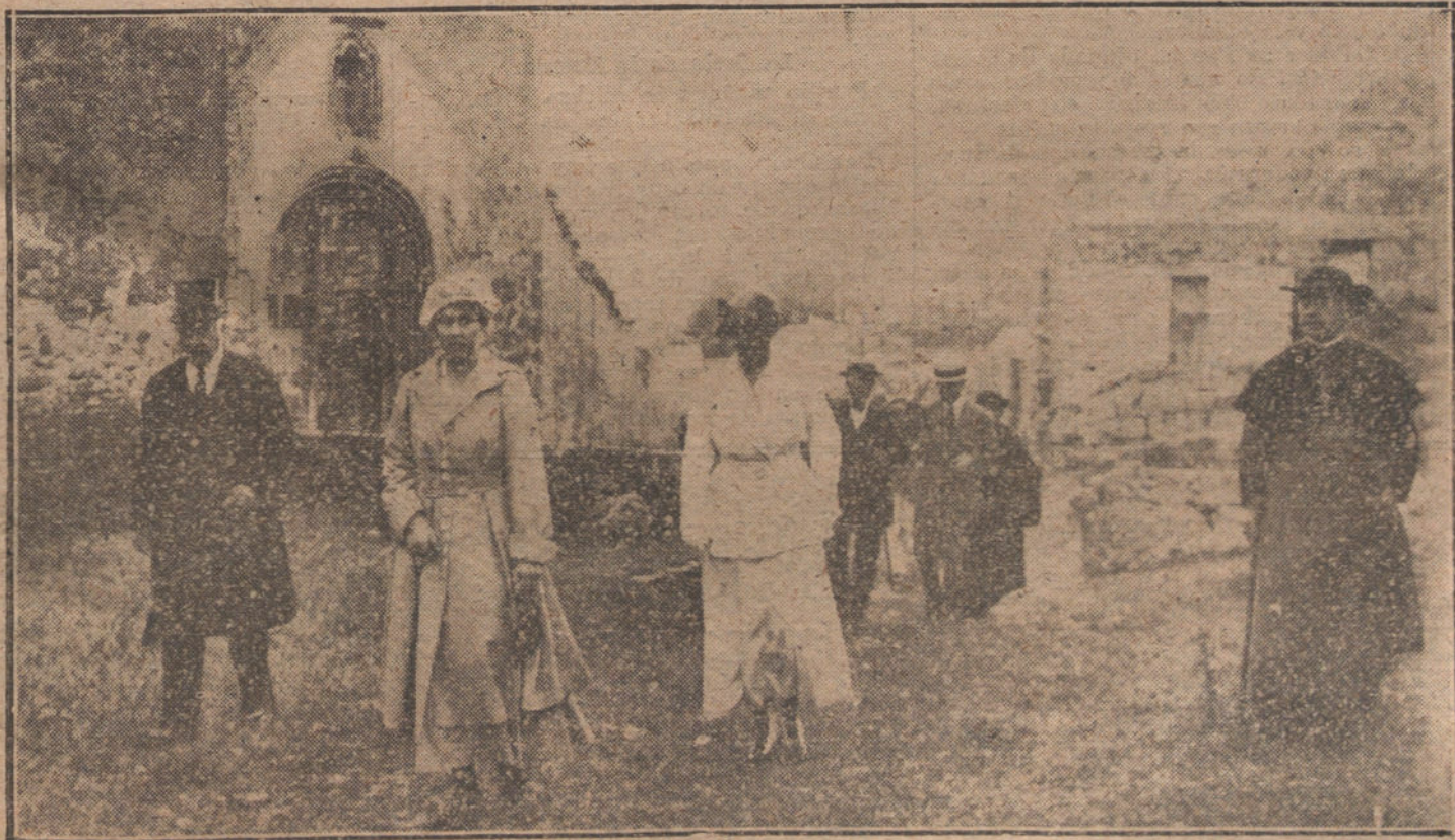
LA REINA VICTORIA EN LA GRANJA.—S. M. acompañada del obispo y el gobernador de Segovia, saliendo de visitar el Parral.

El discurso de ayer, no es el de un hombre público que aspira al Gobierno, que quiere disponer de la «Gaceta» para usufructuarla en beneficio de sus amigos. Como político gobernante, el Sr. Maura ha terminado; bien claro lo demostró al fulminar sus ataques contra todos; huye de ser un político ambicioso que aspira a gobernar por el gusto de gobernar; de ese puesto de gobernante al uso español ha desertado para siempre.