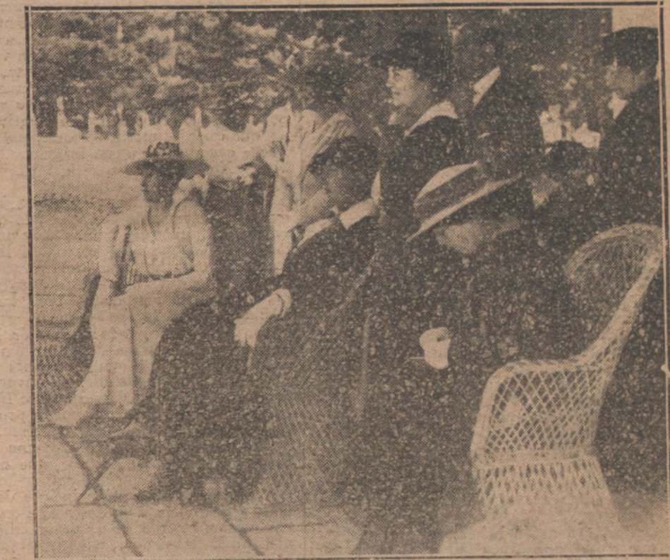
LA REINA VICTORIA EN LA GRANJA.—S. M. presenciando las pruebas del Tiro de Pichón.

reducido espacio los aspectos que el Sr. Maura ve a los males de la Patria; sólo oímos de hacer constar que su discurso estuvo lleno de notas pesimistas, que recordaron al ilustre Silvela en las postrimerías de su vida, cuando lanzaba sus terribles frases sobre la suerte de España, frases que continúan grabadas en la mente de todo español.