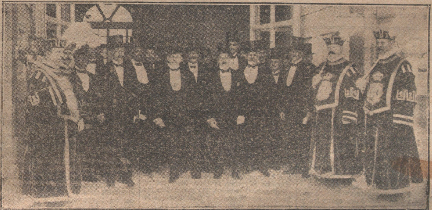
La Comisión del Congreso saliendo de Palacio de entregar a S. M. la contestación al Mensaje.