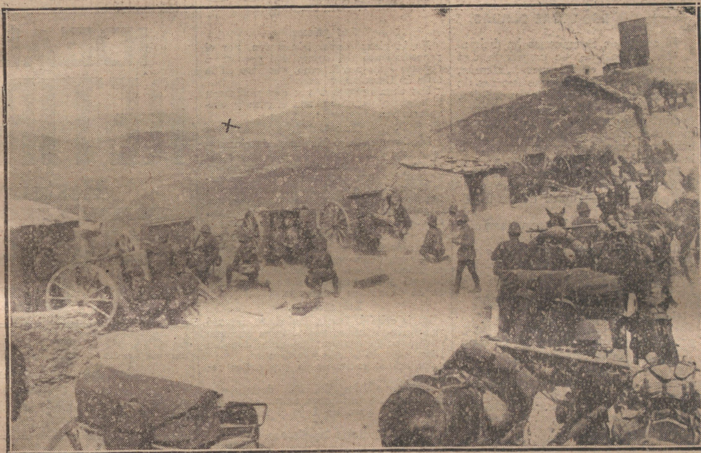
EL COMBATE DE BIUT.—La Artillería española cañoneando una posición mora (X) en las estribaciones del Biut.