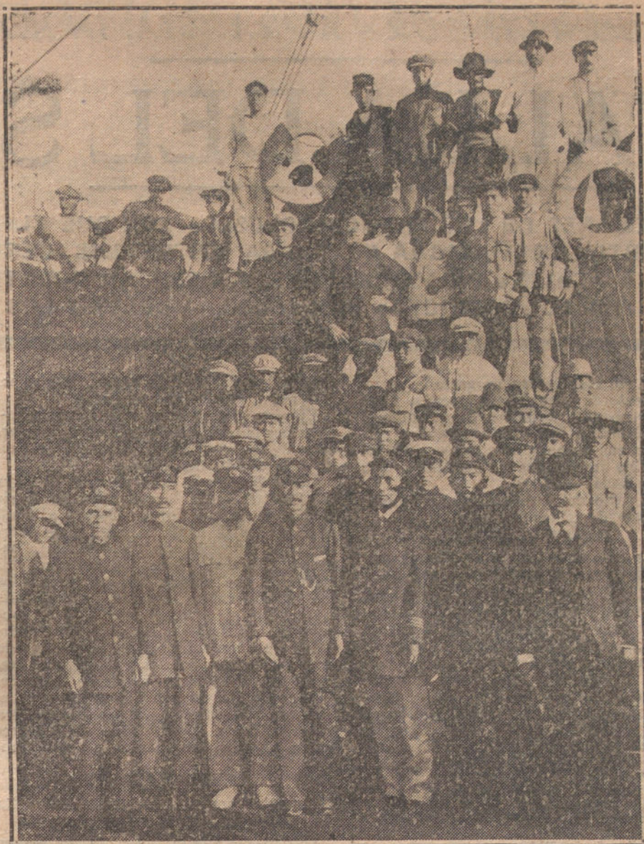
LA GUERRA SUBMARINA.—Oficiales y marineros del vapor japonés «Daiyet Suman» (torpedeado por un submarino austriaco) a bordo del buque griego «Emmanuela», a su llegada al puerto de Mejilla, donde se han refugiado.

rigió una elocuente y brillante plática alusiva al acto, y después bendijo la unión.