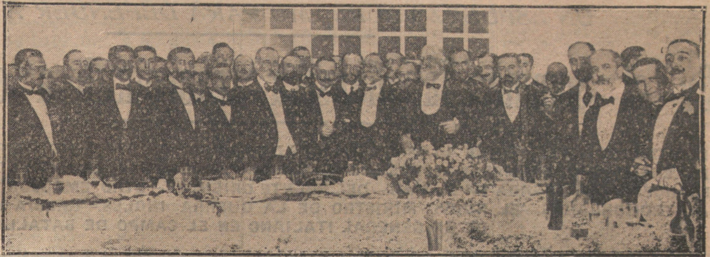
Presidencia del banquete ofrecido anoche al Sr. García Prieto con motivo de haber sido elegido decano del Colegio de Abogados de esta corte.