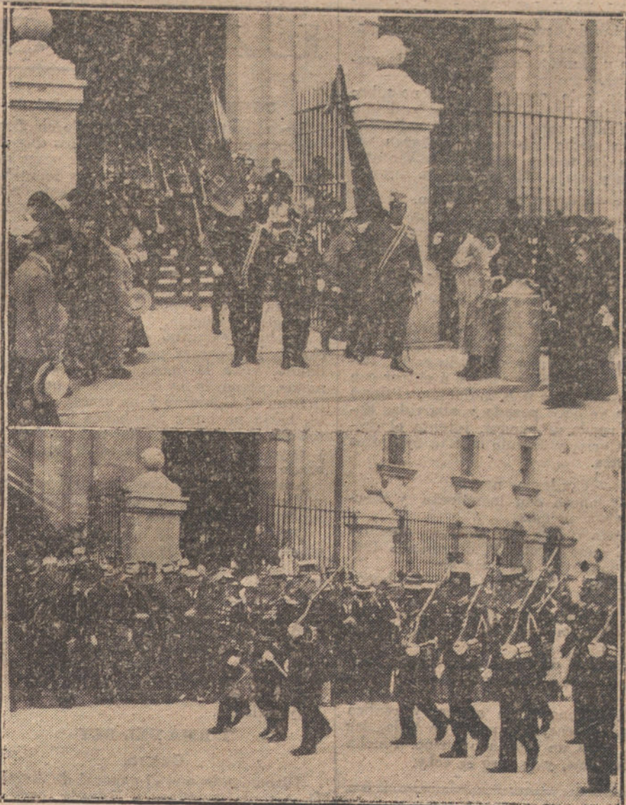
LA FIESTA DEL 7 DE JULIO.—Las banderas de los Milicianos Nacionales y del Rey de León saliendo de San Francisco del Grande después de la fiesta conmemorativa celebrada esta mañana.—Debajo, el batallón de Milicianos Nacionales desfilando ante las autoridades.

HUESCA. Se han adoptado diversas disposiciones para el caso que estalle la huelga de ferroviarios. Los servicios no sufrirán interrupción.