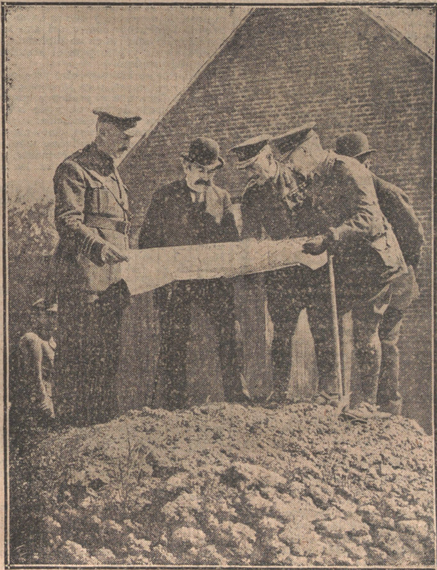
EN EL FRENTÉ INGLÉS. —El presidente del Consejo francés, M. Aristides Briand, examinando los planos del Estado Mayor.

Por buzos alemanes, y ante la autoridad de Marina, han sido extraídos fuera de este puerto los cadáveres de los infelices tripulantes del vapor austriaco «Columbia Berzan y Natali», que perecieron el domingo, cuando paseaban por la bahía. Los peces habían mutilado los cadáveres, apareciendo uno sin cabeza, y otro sin manos ni estómago.