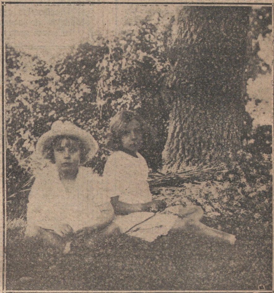
EL VERANEO DE LA FAMILIA REAL.—Las Infantitas Beatriz y Cristina en el Palacio Real de la Granja.

La cuestión submarina es para España de tan capital importancia, que estamos plenamente convencidos que nuestro Gobierno no retrocederá en este asunto ni un solo paso, resistiendo las más energéticas medidas de los aliados. No queremos discutir ahora si Inglaterra y Francia, en su política «griega» contra España, han tenido la osadía de hacernos amenazas en forma de una nota sobre la estancia del «U-35» en Cartagena. En caso afirmativo, estamos seguros de que nuestro Gobierno les habrá demarcado los límites