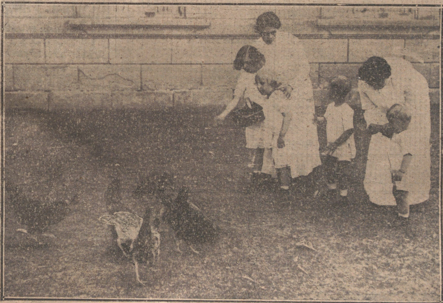
EL VERANEO DE LA FAMILIA REAL.—Los hijos de los Reyes, Infantitas Beatriz, Cristina, Juan y Gonzalo, jugando en los jardines del Palacio Real de Riofrio.

Creyéndola muerta, se suicidó el agresor, arrojándose desde una altura.