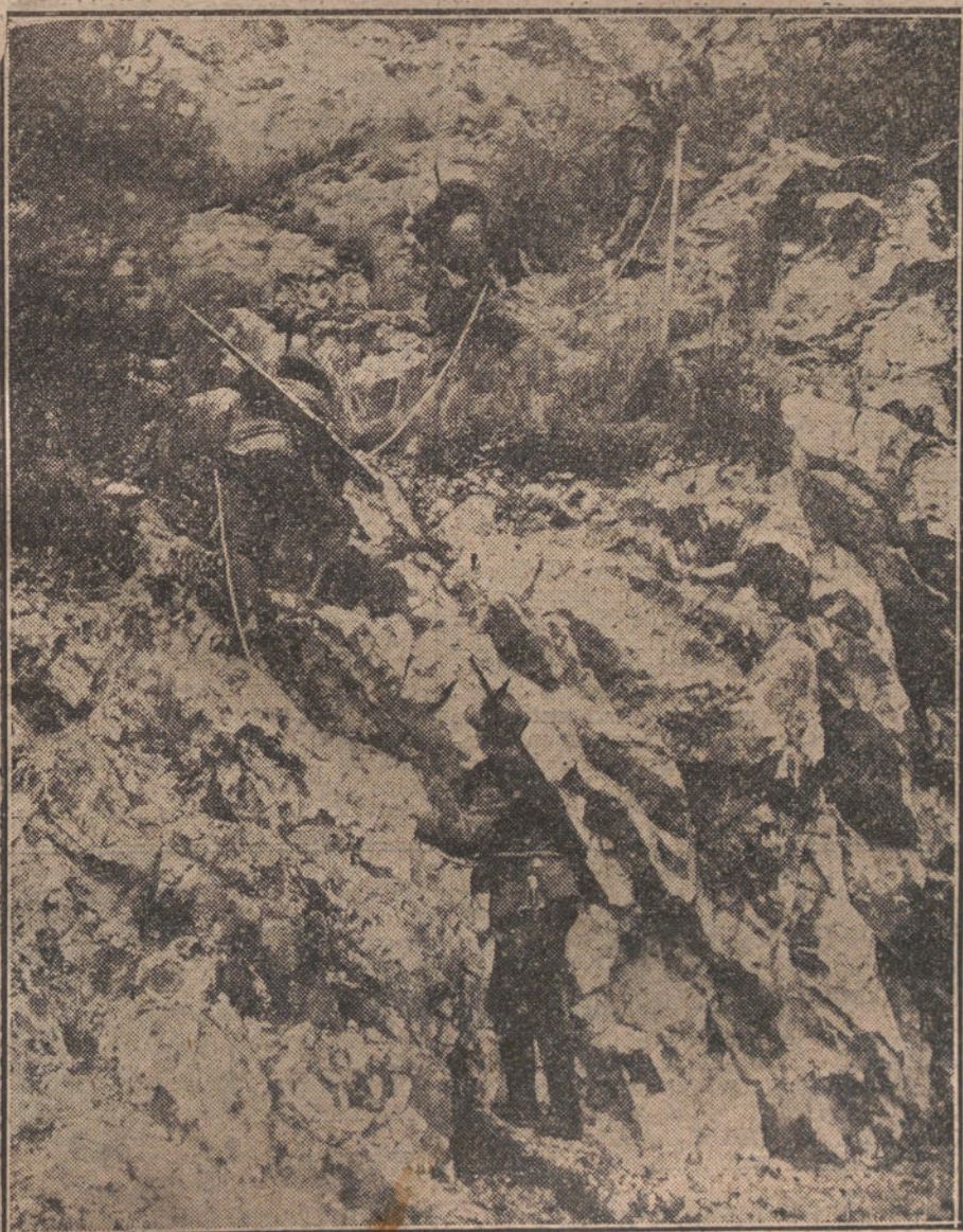
EN EL FRENTE ITALIANO.—Soldados alpinos italianos escalando una elevada posición.

Desgraciadamente, unas y otras han sido, son y serán símbolos ostensibles de la derrota. Los héroes nacen de las circunstancias difíciles, se crían entre sangre desperdiciada sin fines prácticos en la mayoría de los casos, y pasan a la historia, como jirones de una bandera destrozada por ineptitud o torpeza de los altos mandos.