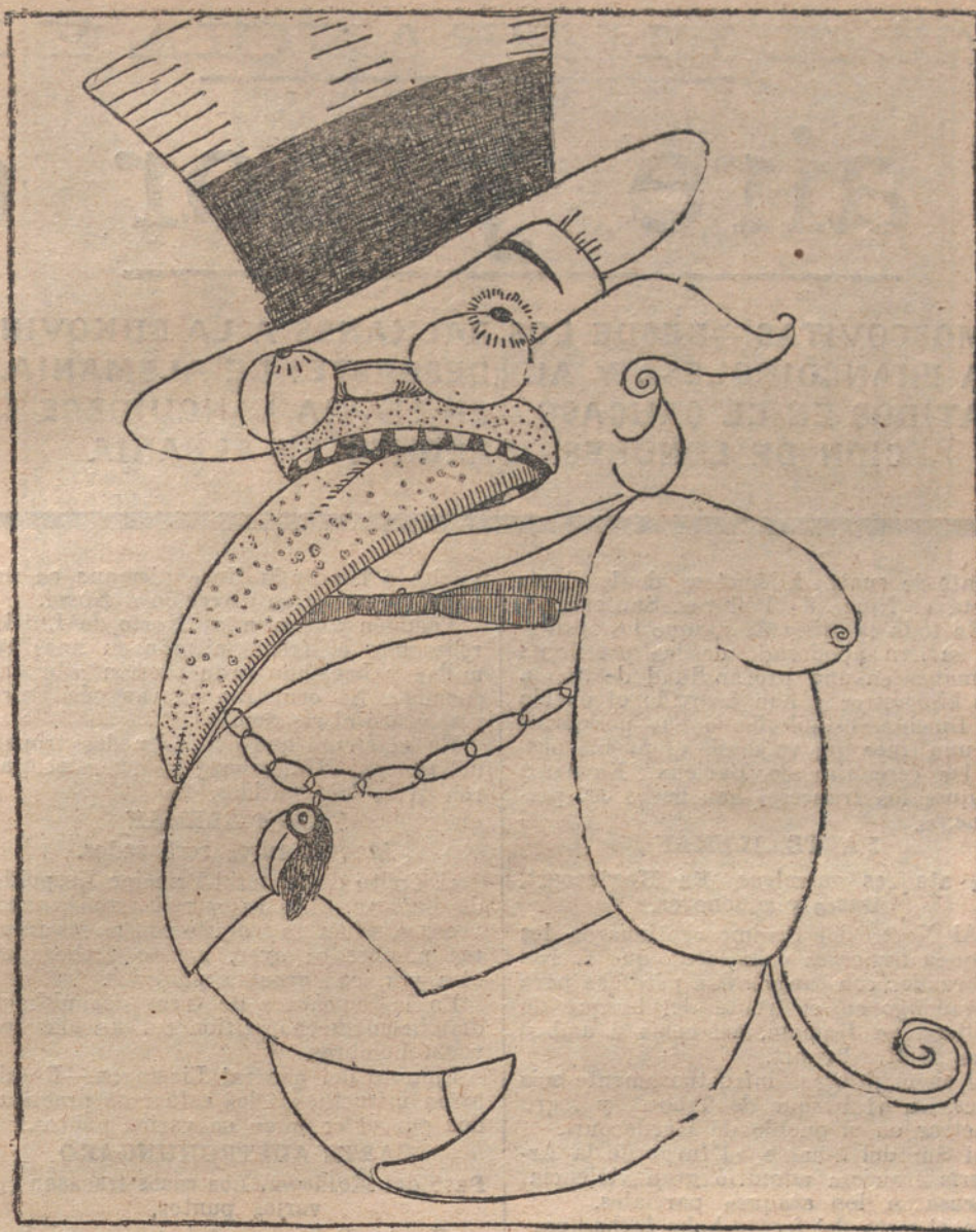
EL HOMBRE TODO LENGUA