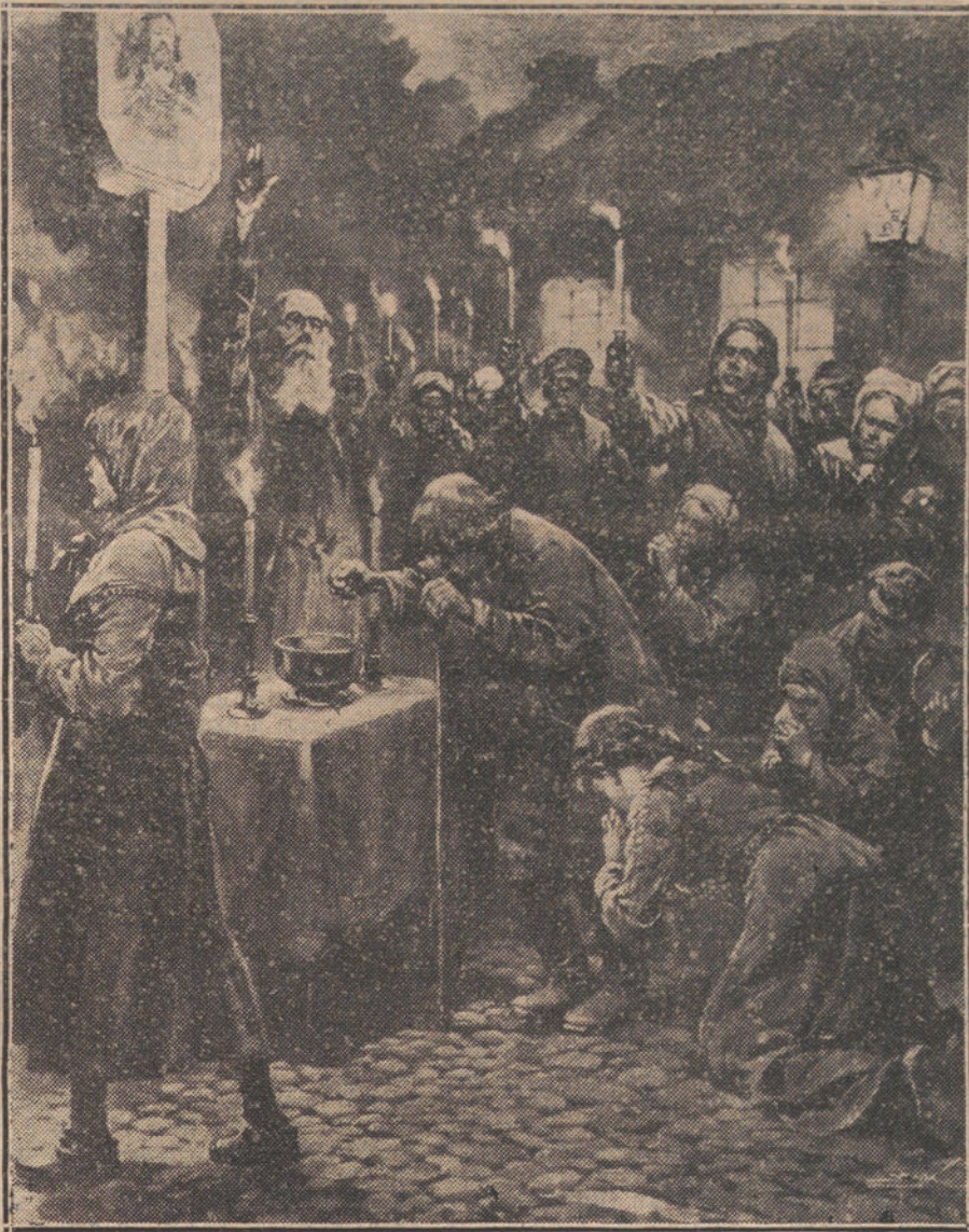
LA GUERRA EN ORIENTE.—Interesante ceremonia religiosa celebrada en Shrine, para conmemorar los triunfos rusos. (Fot. ILLUSTRATION.)

Fuerzas navales alemanas hundieron, entre el 4 y 6 de Julio, cerca de la costa inglesa, los siguientes barcos pesqueros ingleses: «Queen» y «Lindsey».