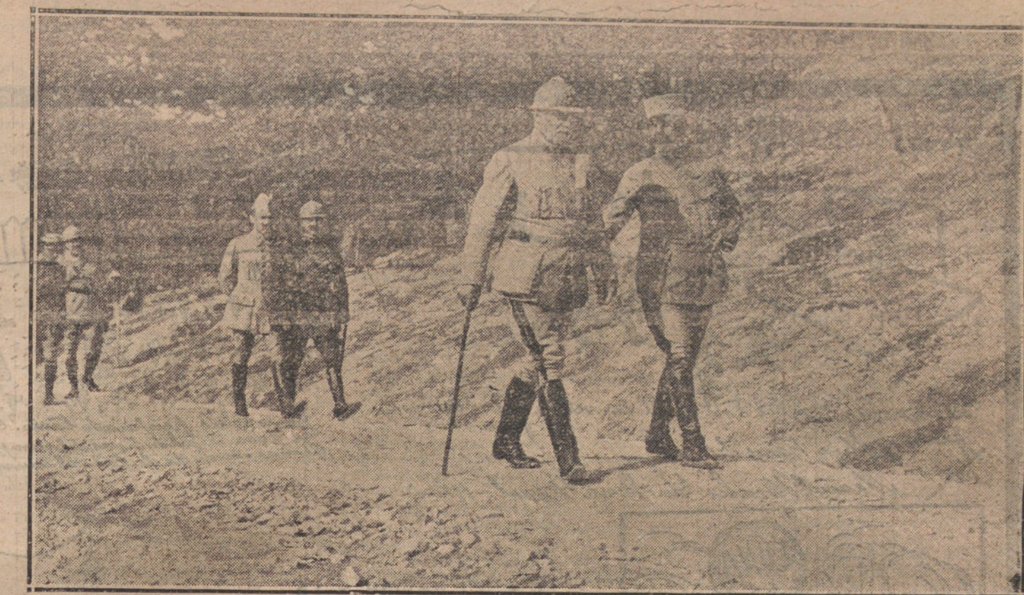
LA OFENSIVA DE LOS ALIADOS.—El general francés Fayolle recorriendo las posiciones de la primera línea de combate, el tercer día de la ofensiva.

Barkers califica esto del ideal perseguido por la Entente; pero en el caso de que entre las potencias de la Entente surgieran diferencias, se haría necesario el