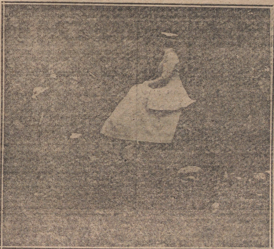
LOS REYES EN LA GRANJA.—S. M. la Reina Doña Victoria montada en el magnífico caballo «Blase», en el que hace las excursiones por los alrededores de La Granja.

Ha quedado destruida también en una extensión de siete kilómetros la línea férrea de Atenas a Larissa, que atraviesa la selva incendiada.—Hallet.