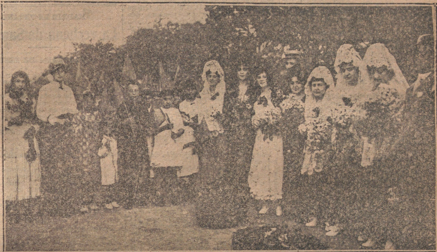
LAS FIESTAS DE CHAMBERI. —Grupo de bellas señoritas y niñas de las escuelas públicas, que tomaron parte en el homenaje a la bandera celebrado ayer tarde en la calle de Abascal.