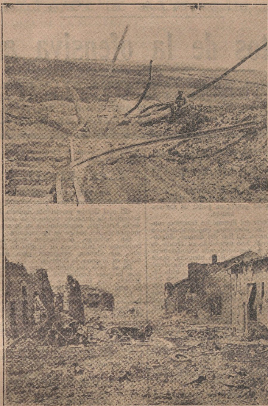
LAS OPERACIONES EN VERDUN. —Aspecto de la línea férrea de Fleudy y una de las principales calles del pueblo después de una batalla.