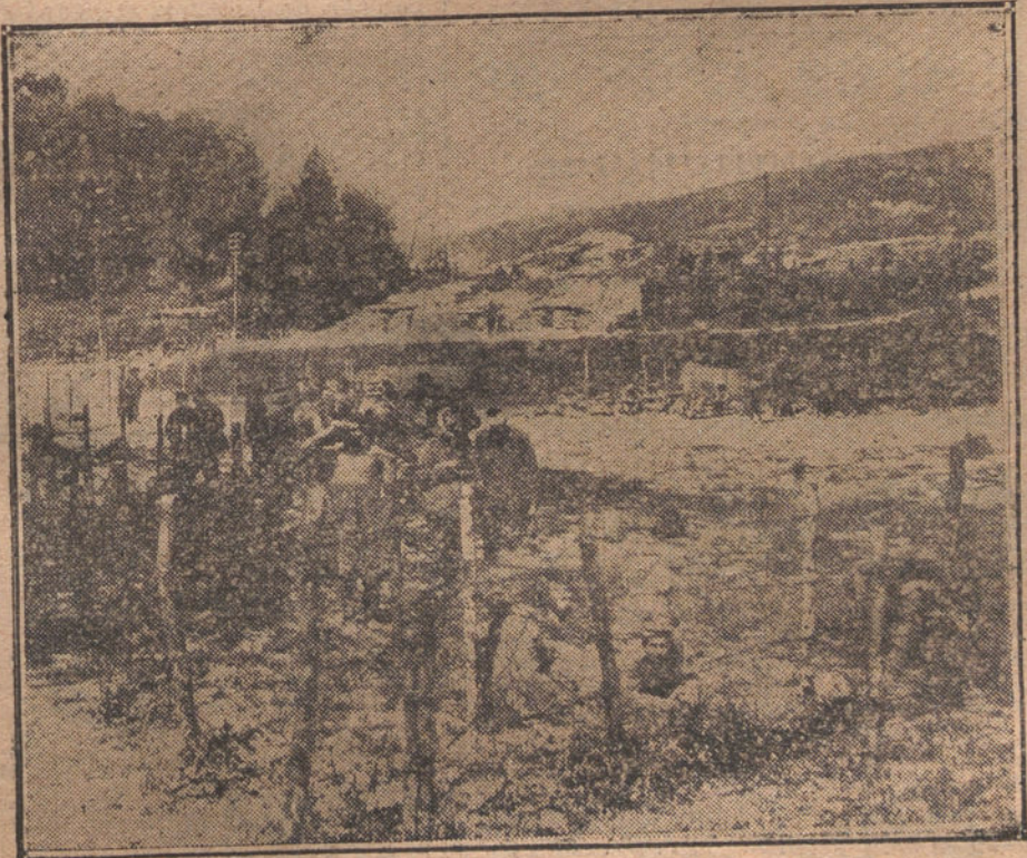
Un campamento de prisioneros en las proximidades del frente inglés.

Entre el Ancre y el Somme aumentó durante el día la actividad de la Artille- ría.