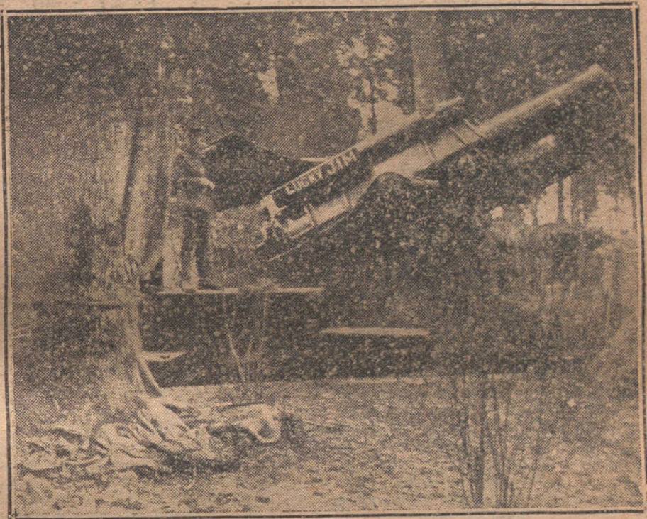
Mortero inglés, que se emplea con éxito en las operaciones de la ofensiva.

Descontando casos excepcionales, que, por lo que se sabe, degeneraron en recla- maciones diplomáticas, no se ha atrevido nunca el Gobierno francés á tocar la propiedad neutral. Menos aún, nunca ningún Estado neutral ha dado á enten- der que tenía la intención de hacer suyo