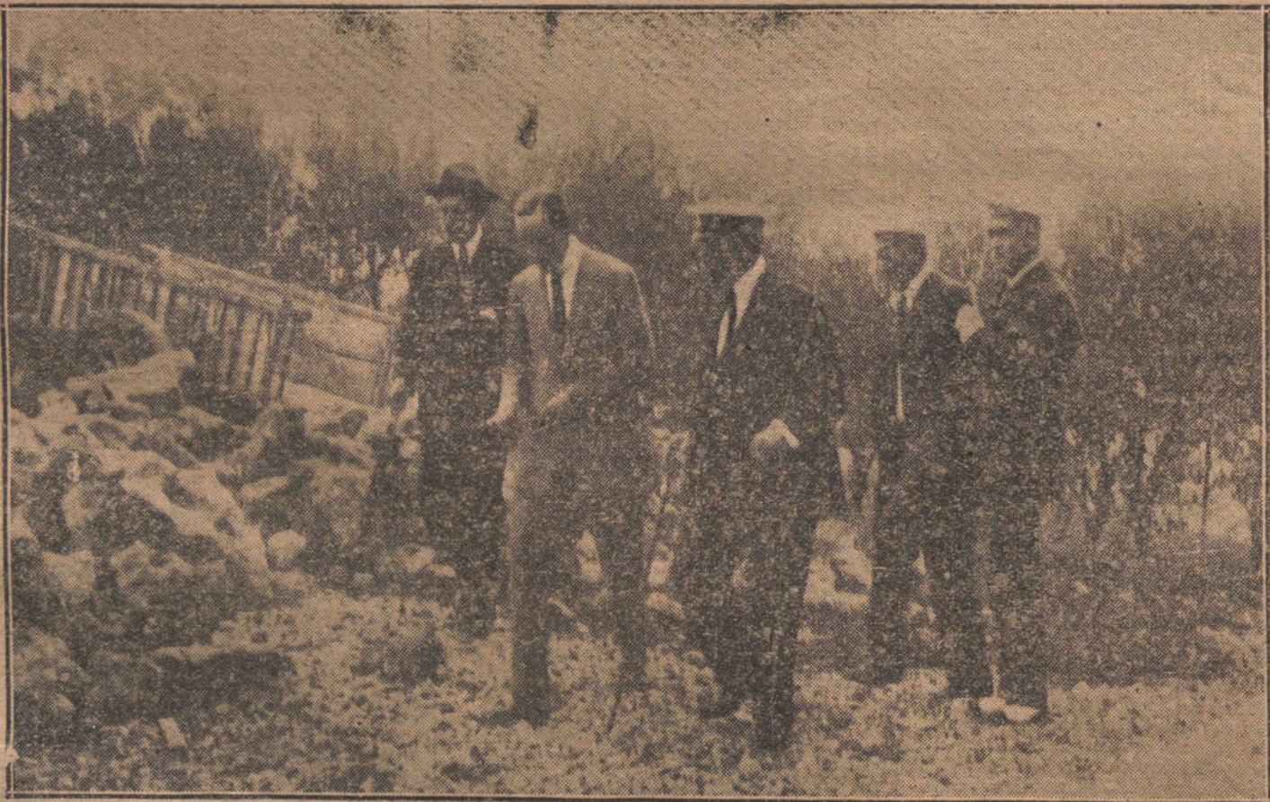
LOS REYES EN SANTANDER.—Su Majestad visitando las obras del Hotel Real del Sardinero.

Los habitantes de la zona damnificada quedan en la miseria, y el alcalde interesa al gobernador que se soliciten recursos del Gobierno.