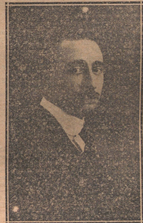
JOAQUIN MARIA DE NADAL, autor de la novela «La agonía del pueblo», que está alcanzando un gran éxito de librería.

Frente ruso.—En el Czarnyceremo superior fracasaron varios ataques rusos. En la región al Norte de Brody prosiguió ayer el enemigo sus ataques; nuestras valientes tropas, que resistieron tenazmente todos los asaltos rusos hasta el anoche, no cedieron ni un palmo de terreno. En un nuevo ataque realizado por importantes masas rusas en las primeras horas de la noche, el enemigo logró penetrar en nuestras posiciones al Este de la carretera de Lesznow á Brody; nues-