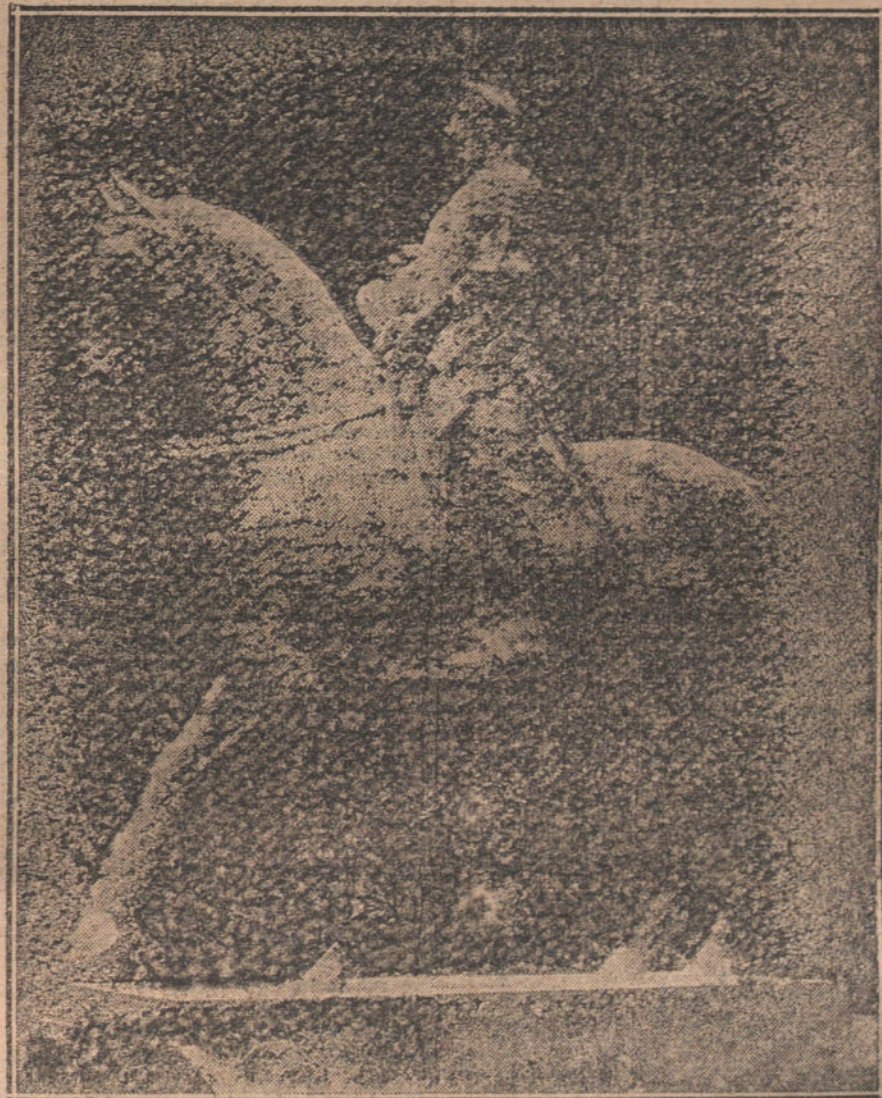
Estatua ecuestre del Gran Capitán, obra de Mateo Inurria.