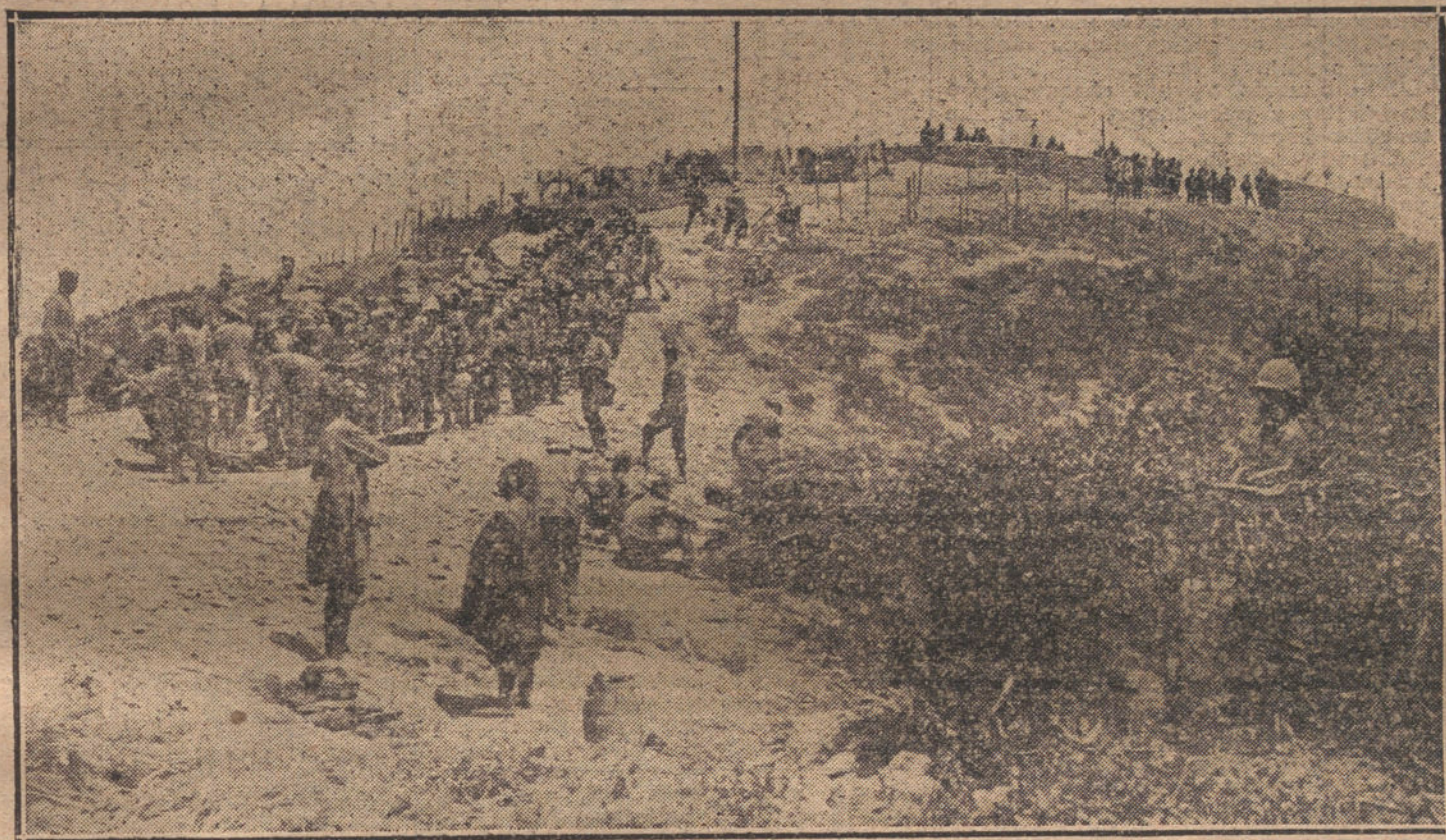
La famosa loma de las trincheras, ocupada por nuestras tropas en el combate del Biutz.

Nosotros hemos dicho en nuestro artículo del día 17: