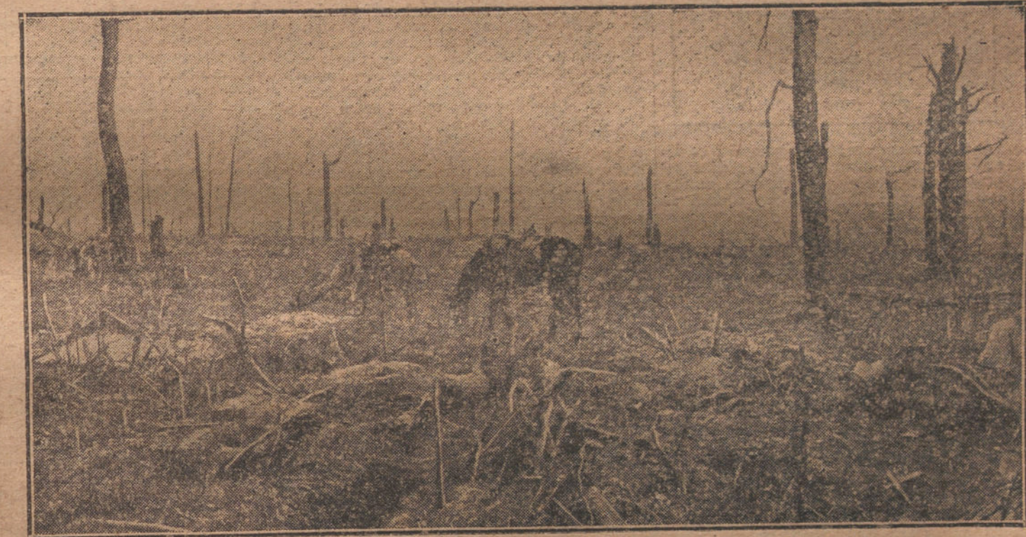
DESPUES DE LA BATALLA.—Caballos abandonados en un campo de Champaña después de un violento combate.

La merma del grano para forraje ha sido aún mayor que la del grano para pan. La cosecha de avena arrojó en 1915 nada más que 5.966.034 toneladas, contra 9 millones, en números redondos, en 1914, y cerca de 10 millones en 1913. En cebada de verano se recogieron 2.483.752 toneladas, es decir, 1,2 millones menos que en 1913. Sumando el trigo, la cebada, el centeno y la avena cosechados en 1915, se obtiene un