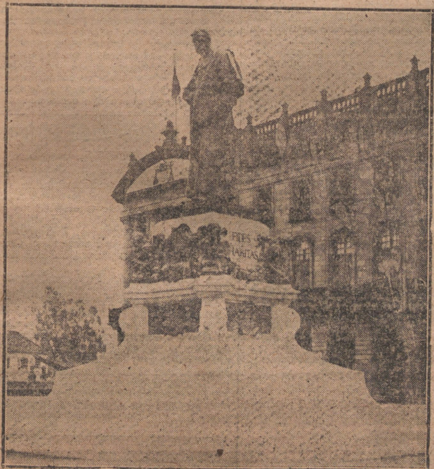
Monumento á Montero Ríos, erigido en Santiago, obra del escultor Mariano Benlliure.