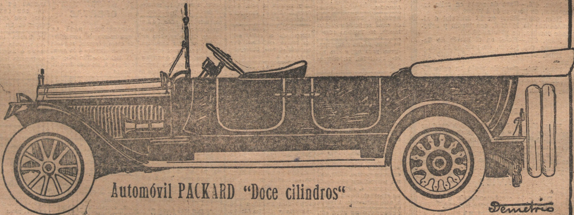
Automóvil PACKARD "Doce cilindros"