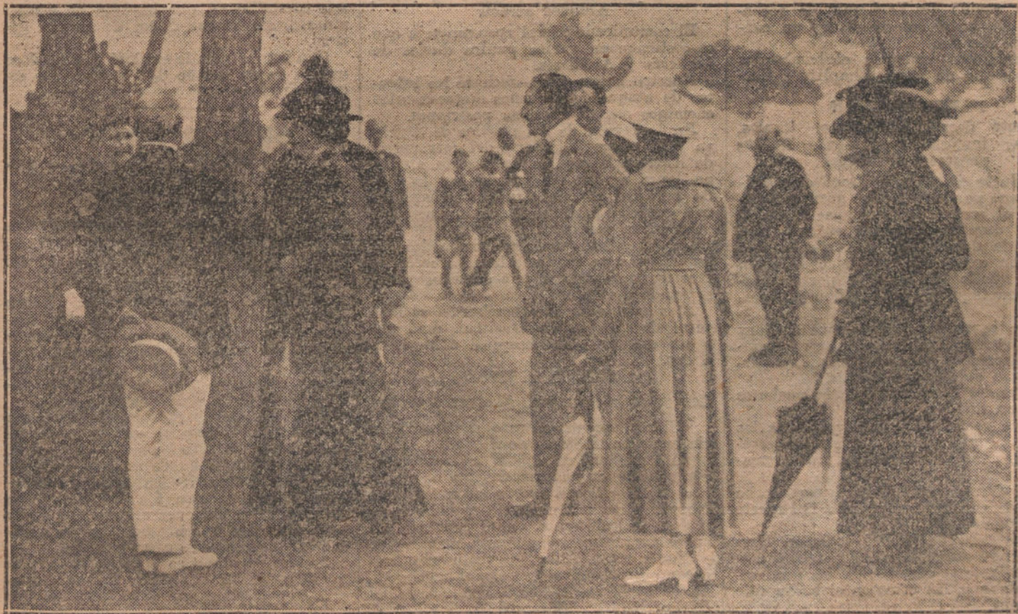
EL NUEVO GOLF-CLUB DE ZARAUZ.—SS. MM. el Rey y la Reina Cristina, vistiendo el nuevo campo de golf durante la inauguración de los partidos.