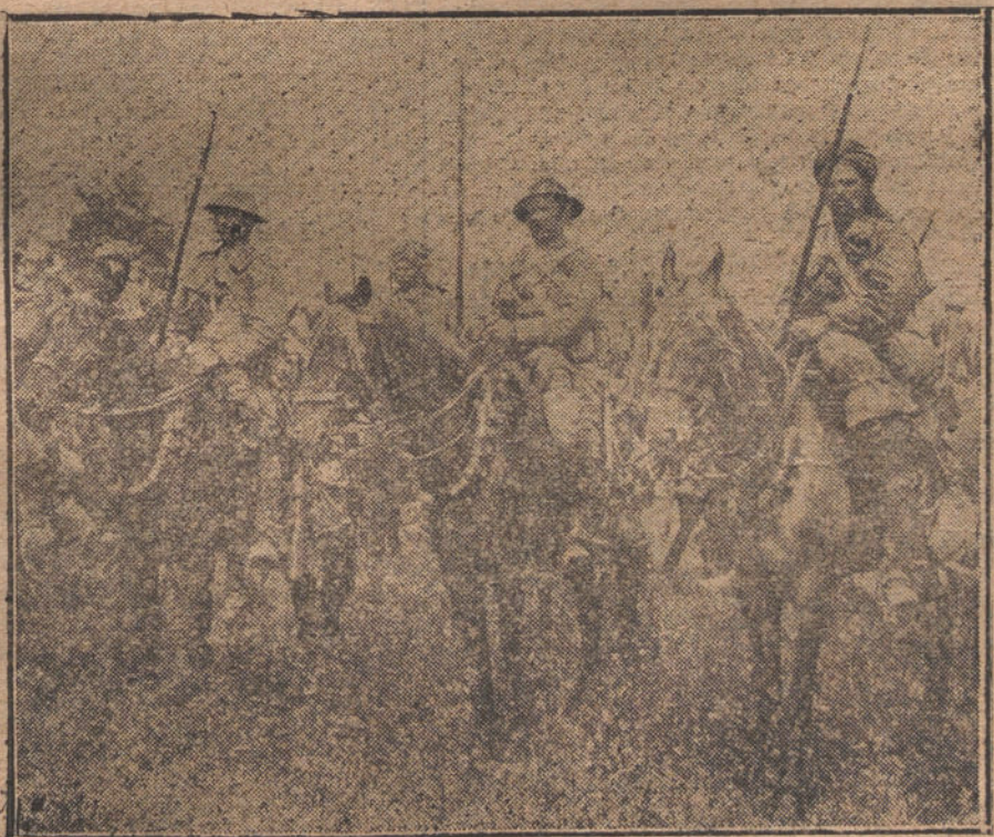
Tipos de soldados indios de Caballería, preparados con sus lanzas de bambú para entrar en combate.

Por el alcalde se ha advertido al director de la Hidroeléctrica que el Ayuntamiento está dispuesto a oponerse resueltamente al aumento de los alquileres de contadores y que se exigirá a la Compañía el estricto cumplimiento del contrato.