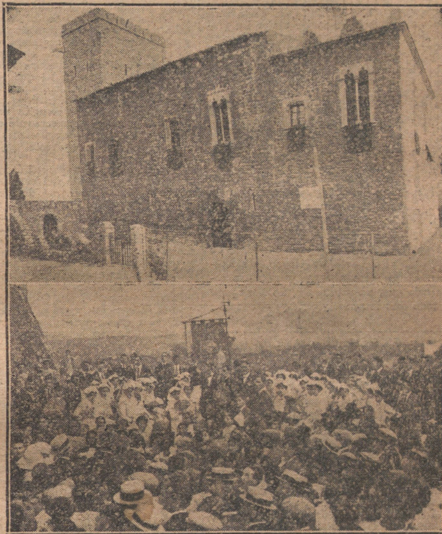
CEREMONIA INTERESANTE EN BARCELONA.—Vista general del castillo de Piera, recién restaurado, propiedad de los barones de Almenar, donde, según tradición, descansó el Rey Jaime I después de la conquista de Mallorca. El barón de Almenar entregando al presidente del Orfeón Pienés el estandarte que le ha regalado con motivo de las fiestas celebradas por la restauración del castillo.

No podemos juzgar si las amenazas hechas al duque de Montellano y al marqués de la Mina tienen algún fondo de verdad. De todos modos, los que tal propalan han debido fundarse en que ambos señores, y en especial el