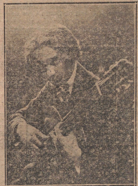
REGINO SAINZ DE LA MAZA, notabilísimo guitarrista, que está dando una serie de conciertos en el Norte de España.

El herido fué curado en la Casa de Socorro del distrito de Palacio, y después conducido al Hospital de la Princesa.